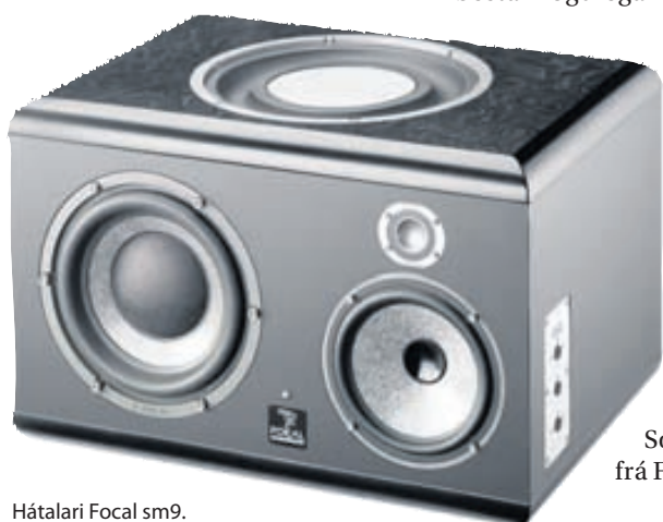
Hátalari Focal sm9.

Kynningin í Hljóðfærahúsinu Tónabúðinni verður á morgun, 11. september klukkan 18 og stendur til klukkan 20. Einnig verða Solo 6 og CMS 50 frá Focal sýndir.