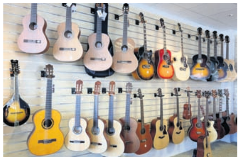
Rín selur gott úrval gítara fyrir byrjendur jafnt sem lengra komna.