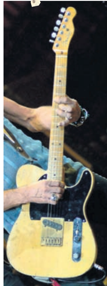
Þessi gítar er sextíu ára gamall.

leiddir hjá Fender- og Gibson-verksmiðjunum. Fender-gítarnir eru sumir komnir vel til ára