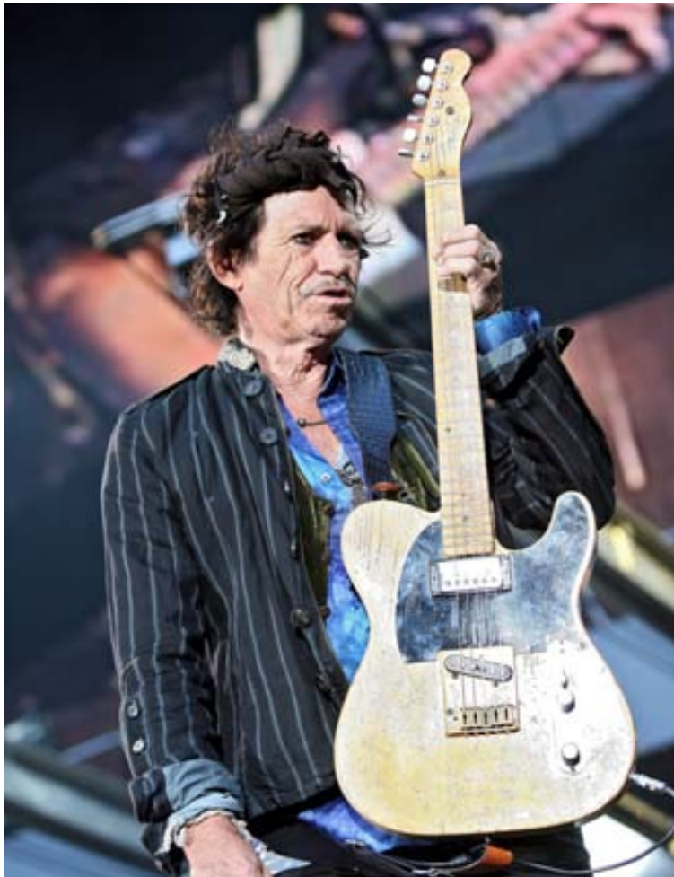
Keith Richards notar um það bil tíu gítara á hljómleikaferðum.