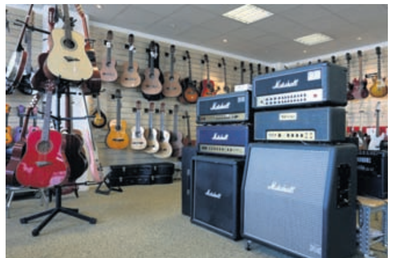
Vöruúrval í verslun Rínar er afar fjölbreytt.