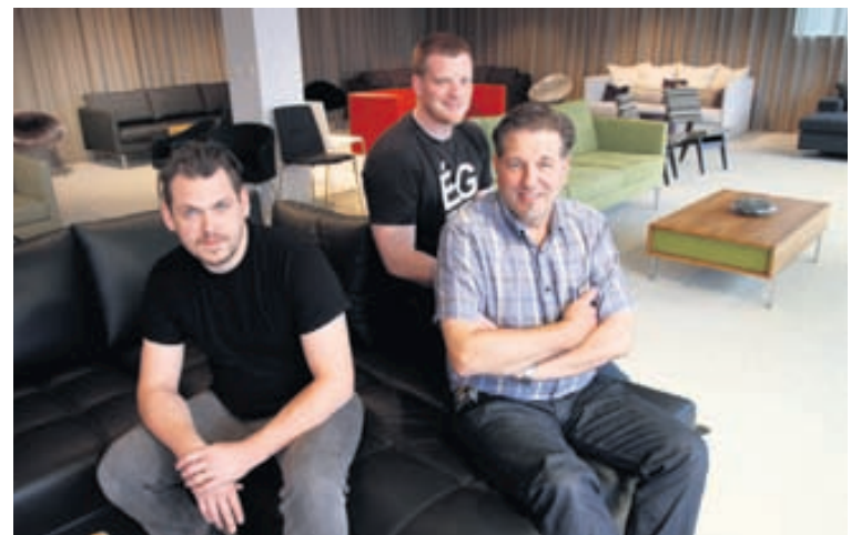
Starfsmenn GÁ Húsgagna hafa áralanga reynslu í bólstrun húsgagna.

Ármúla 19 | S: 553-9595 | gahusgogn@gahusgogn.is | www.gahusgogn.is