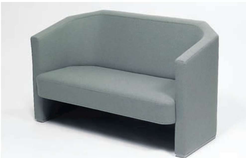
Bólstursmiðjan á framleiðslurétt á húsgögnum sem húsgagnahönnuðurinn Pétur B. Lúthersson teiknar fyrir fyrirtækið.