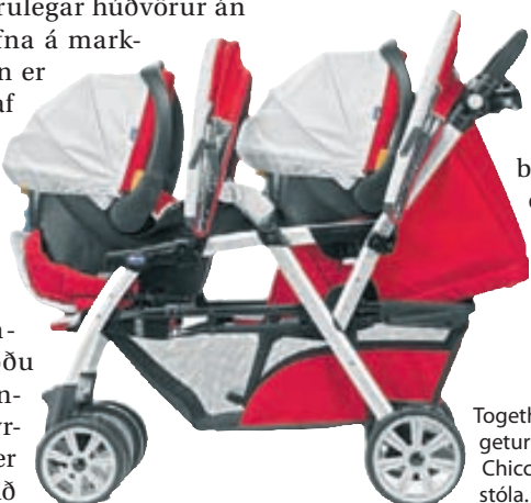
Together kerra sem getur tekið tvo Chicco ungbarnastóla.

Allar upplýsingar um vörur Chicco á Íslandi má finna á www.chicco.is og einnig á Facebook. Þar er mikið magn upplýsinga og myndbanda sem sýna notkun varanna, meðal annars hvernig festa á bílstóla rétt í bíla.