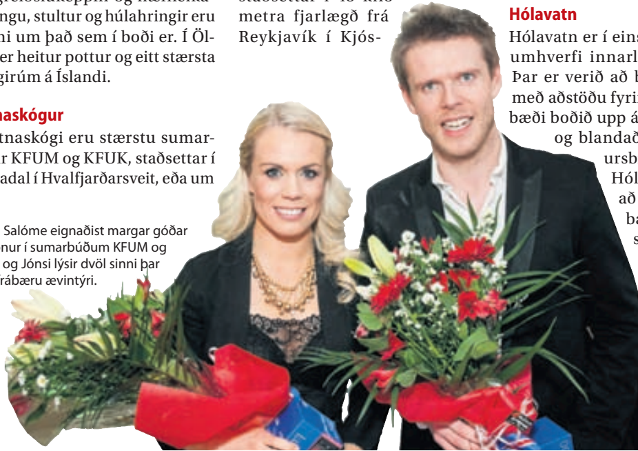
Greta Salóme eignaðist margar góðar vinkonur í sumarþúðum KFUM og KFUK og Jónsi lýsir dvöl sinni þar sem frábæru ævintýri.

Þeir eru ófáir Íslendingarnir sem dvalið hafa í sumarþúðum KFUM og KFUK enda fara þangað tæplega 3000 börn á hverju sumri. Íslensku keppendurnir í Eurovision, Greta Salóme og Jónsi eru í hópi þeirra fjölmörgu Íslendinga sem eiga góðar minningar úr sumarþúðum KFUM og KFUK. „Sem krakki fór ég alltaf í Ölver og á ég margar ógleymanlegar minningar þaðan. Ég eignaðist margar góðar vinkonur þarna og boðskapurinn var auðvitað frábær,“ segir Greta Salóme. Jónsi lýsir dvöl sinni í sumarþúðunum á Hólavatni sem frábæru ævintýri sem sé sveipað ljóma. „Ég mæli óhikað með því fyrir alla krakka.“ Allar nánari upplýsingar má sjá á heimasíðu KFUM og KFUK: www.kfum.is