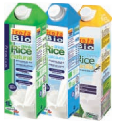
hreinn með kalki með vanillu