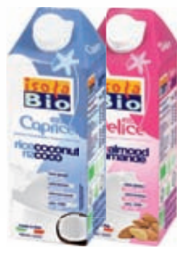
með kókos með möndlu