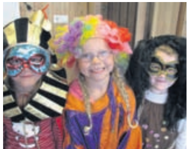
Gleði og grímudansleikur.