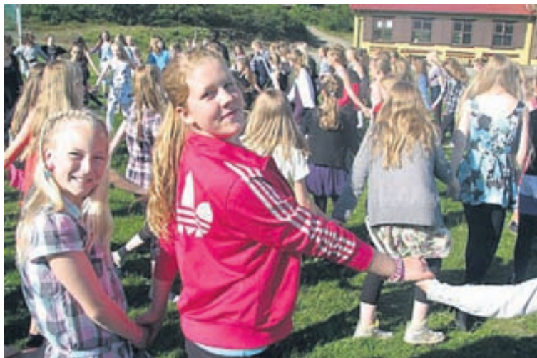
Fjör í Vindáshlíð.