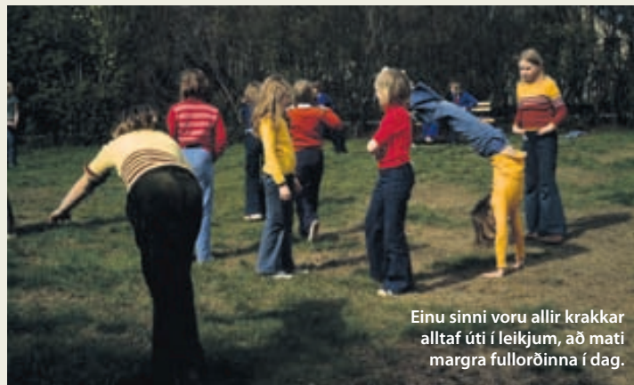
Einu sinni voru allir krakkar alltaf úti í leikjum, að mati margra fullorðinna í dag.

Yfir – boltaleikur og eltingaleikur. Skipt er í tvö lið. Annað liðið hendir bolta yfir skúr og kallar „yfir“. Hitt liðið reynir þá að grípa boltann. Ef það tekst læðist sá sem grípur boltann með hann að hinu liðinu og reynir að hitta í þá. Þeir sem hann hittir flytja þá yfir í það lið. Ef boltinn er ekki gripinn er honum einfaldlega kastað yfir aftur. Leiknum lýkur þegar allir eru komnir í sama liðið.