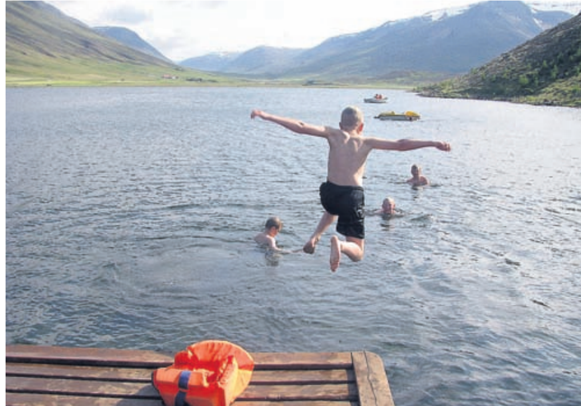
Á Hólavatni er hægt að fara í hressandi bátsferðir, stunda stangveiði og baðstrandarlíf.

Í Vatnaskógi eru stærstu sumarþúðir KFUM og KFUK, staðsettar í Svínadal í Hvalfjarðarsveit, eða um