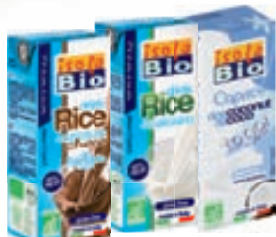
fernur - góðar í nestisboxið