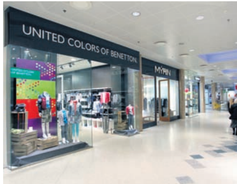
Verslunin í Kringlunni er rétt hjá blómatorginu á fyrstu hæð.