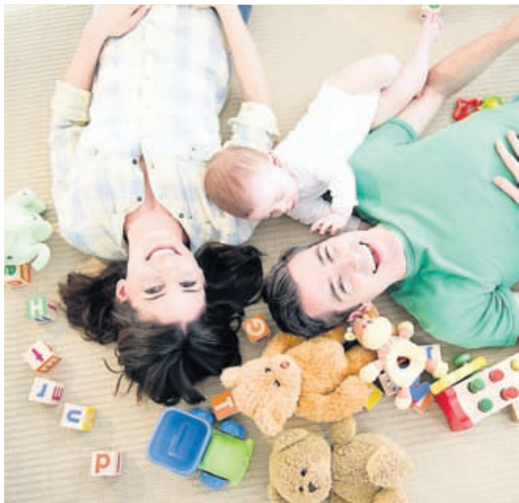
Dragið fram leikföng barnanna og leikið ykkur saman.