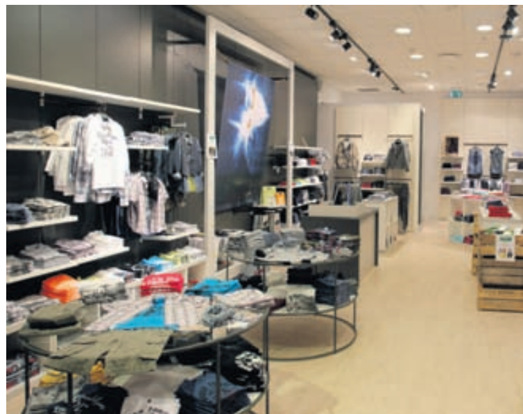
Í Kringlunni er að finna fót fyrir börn á aldrinum fimm til þrettán ára.