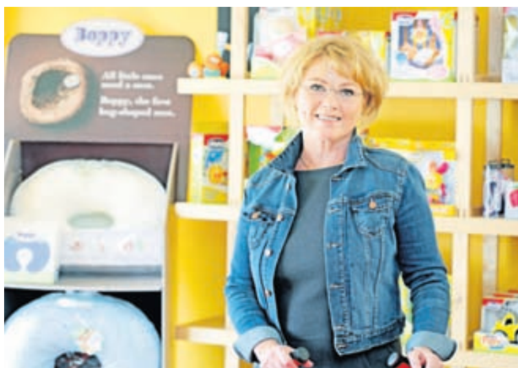
Elisabet segir Chicco umboðið bjóða upp á allt sem tilheyrir börnum frá fæðingu.

Chicco hefur einstaka sérstöðu á meðal annarra barnafyrirtækja. Það er í samstarfi við