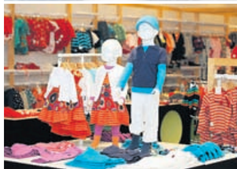
Verslun Polarn O. Pyret í Smáralind er glæsileg.