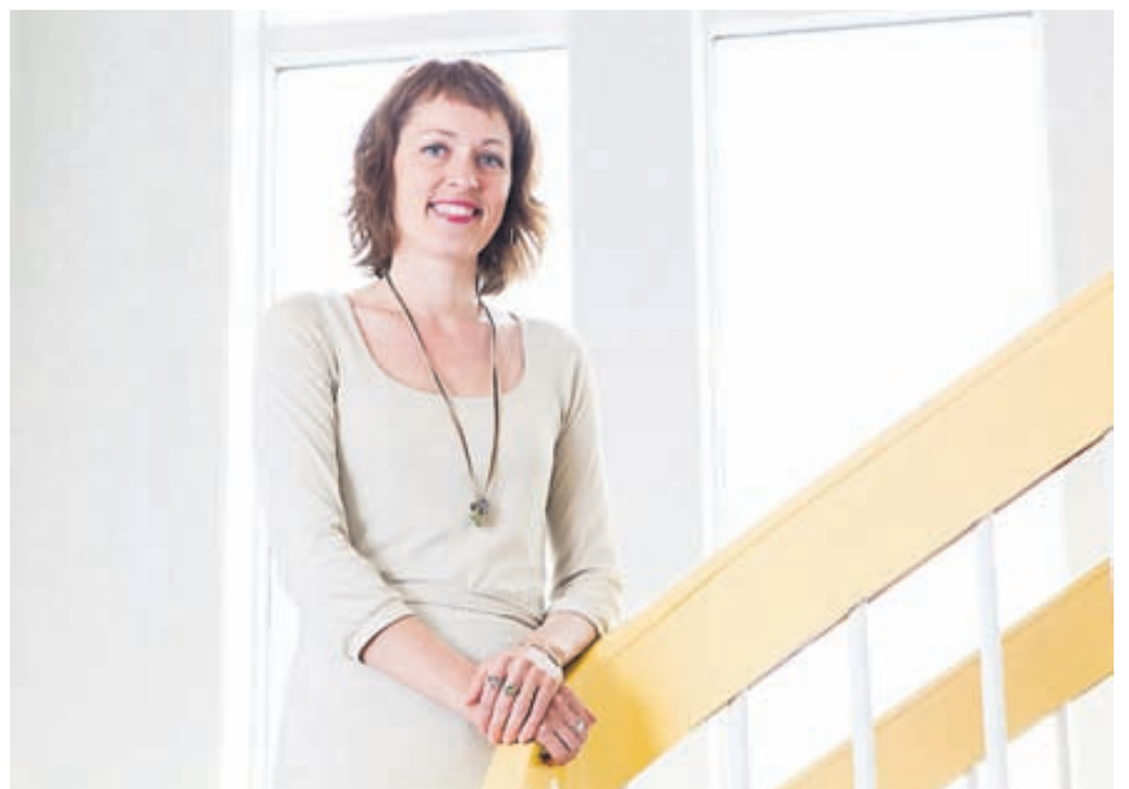
„Frá blautu barnsbeini er vinna takmark okkar og tilgangur og stór hluti sjálfsmyndarinnar upp frá því.“

„Í dag leiðum við hugann að kjörum fólks á vinnumarkaði, fögnum sigrum sem hafa náðst í baráttu launafólks í gegnum tíðina