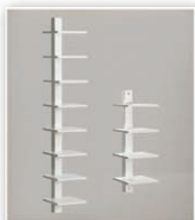
Flinga tímaritahillur 160 cm kr. 16.990 80 cm kr. 9.980