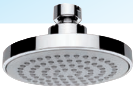
EMOTION sturtuhaus kringlóttur 10 cm verð kr. 3.990.-