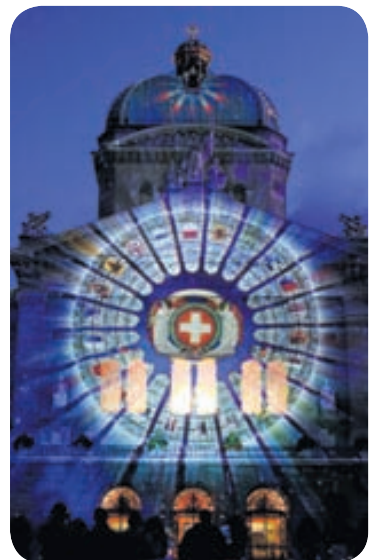
Starfsmenn Les Allumeurs d'Images varpa litríkum myndum á þinghúsið í Bern í Sviss, gestum og gangandi til ómældrar gleði.