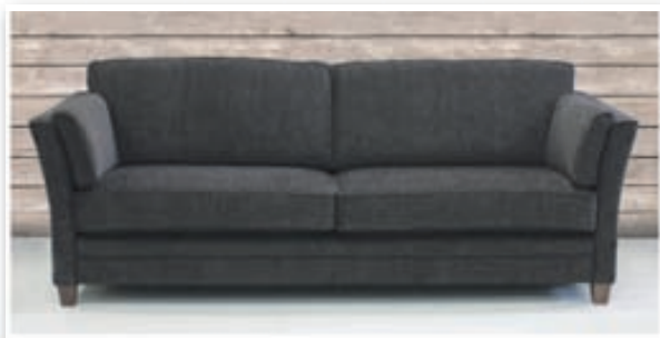
Simone 3ja sæta kr. 199.800 / 2ja sæta kr. 171.400

Eterna sófi 230 cm kr. 192.300 / laugardagstilboð kr. 153.800 Eterna sófi 173 cm kr. 159.900 / laugardagstilboð kr. 127.900