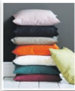
Samba púðar kr. 5.200