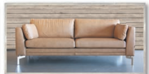
Avignon 3ja sæta leðursófi kr. 274.400