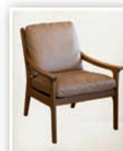
Revir stóll - kr. 147.000