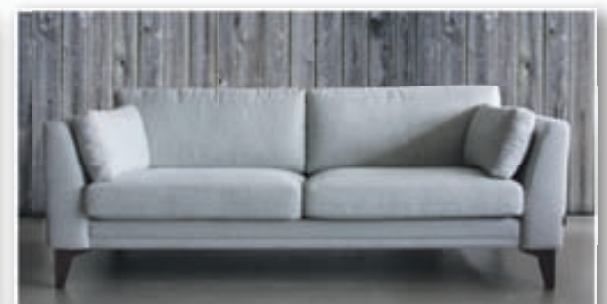
Avignon 3ja sæta kr. 211.600 / 2.5 sæta kr. 178.000