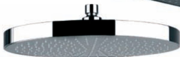
SPRING sturtuhaus kringlóttur 20 cm verð kr. 9.450.-