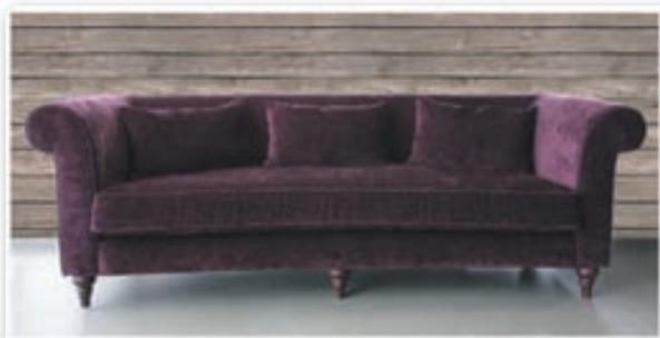
Manchebo 3ja sæta kr. 226.800