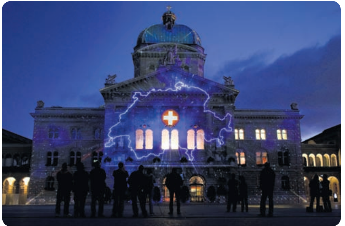
Kort af Sviss er á meðal þess sem listamenn Les Allumeurs d'Images hafa leikið sér með.