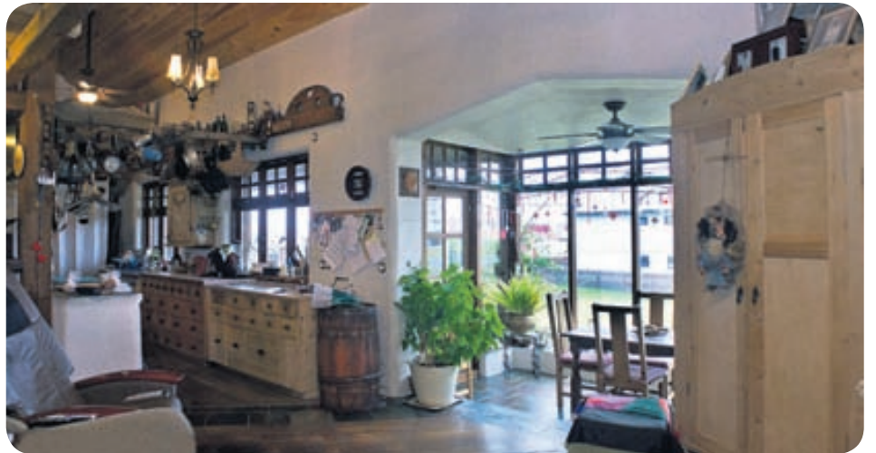
Sólstofan er þar sem dyr fjóssins voru áður og eldhúsinréttingin er tveir gamlir apótekaraskenkar.