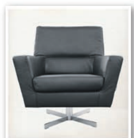
Cooper armstóll á snúningsfæti kr. 152.200 Litir: svart - brúnt - hvítt