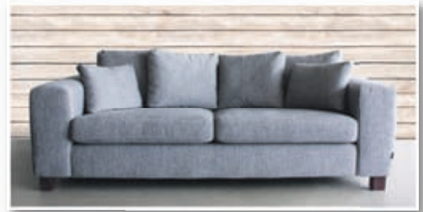
Hera 3ja sæta kr. 218.900 / 2.5 sæta kr. 193.800