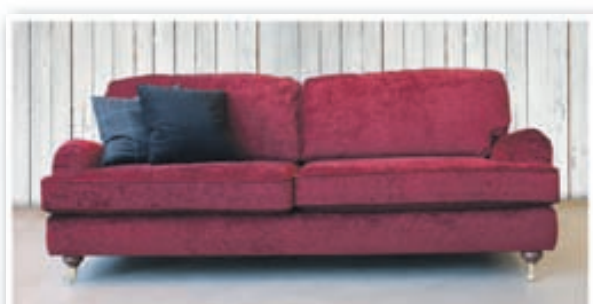
Birmingham 3ja sæta kr. 247.800