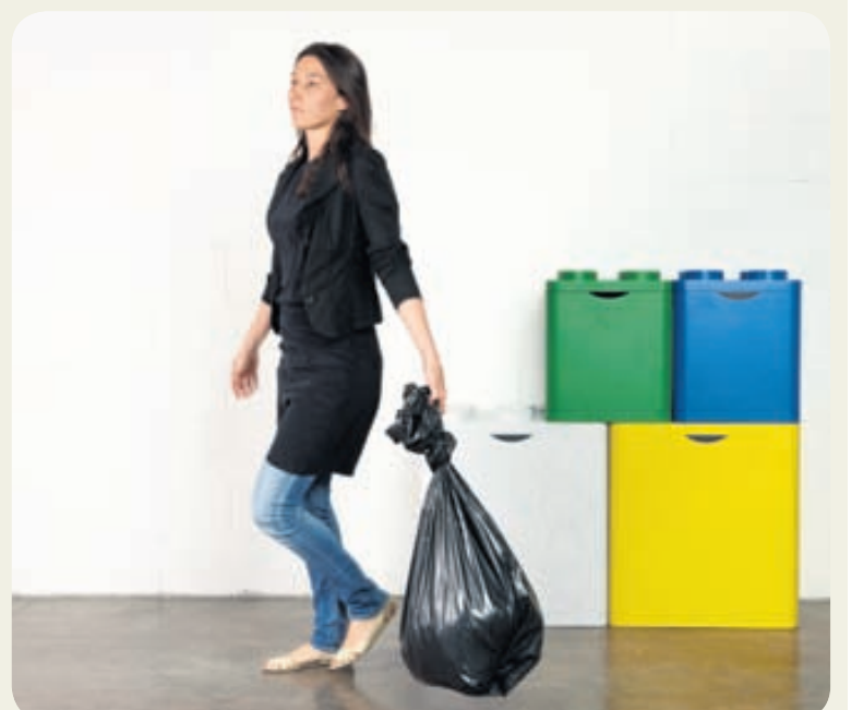
Leco-boxin sækja form sitt og liti til LEGO-kubba.

Sjá nánar á vefsíðunni, www.flussocreativo.it.