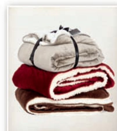
Milton - Kúruleppi 130x1470 Hlý og notaleg jólagjöf kr. 9.980