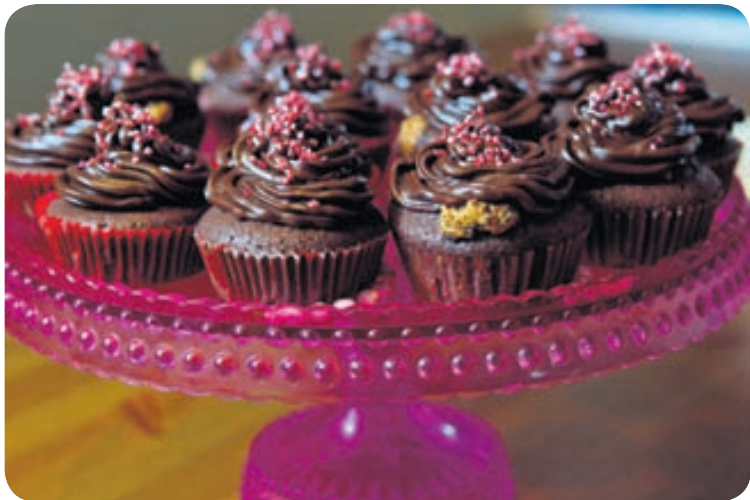
Ljúffengar bollakökur á bleikum diskum taka sig vel út á borðinu.