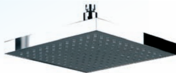
ESPRITE CARRÉ ferkantaður 20 cm verð kr. 12.400.-