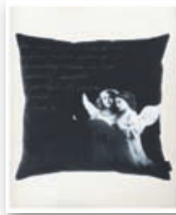
Angel púðar kr. 6.200