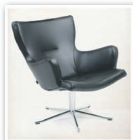
Gyro stóll - Hönnun: Jan Ekström kr. 198.800