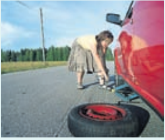
Allir geta skipt um dekk, en mikilvægt er að gera hlutina vel og í rétttri röð.