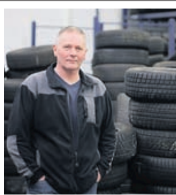
Gömul dekk eru tekin upp í ný eða til inneignar fyrir þjónustu sem Vaka veitir.