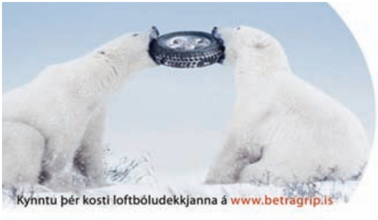
Kynntu þér kosti loftbóludekkjanna á www.betragrip.is

Allar nánari upplýsingar eru veittar í síma 533-3999 eða á heimasíðu fyrirtækisins, slóðin er betragrip.is.