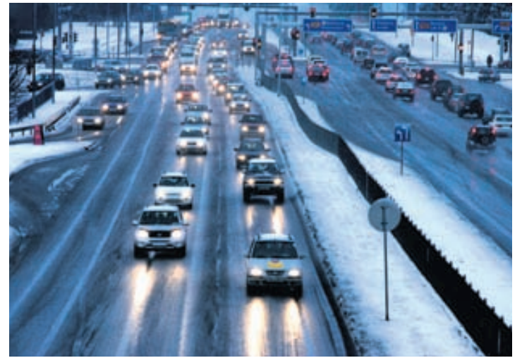
Þótt enn sé snjólaust og haustið milt veit enginn hvenær vetur skellur á af þunga og gott er að vera þá vel undirbúinn.

Hin árstíðabundnu dekkjaskipti byrjuðu af krafti fyrir um viku að sögn Jóns Ágústss sem tekur fram að Sólning geymi dekk fyrir almenning á öllum sínum verkstæðum.