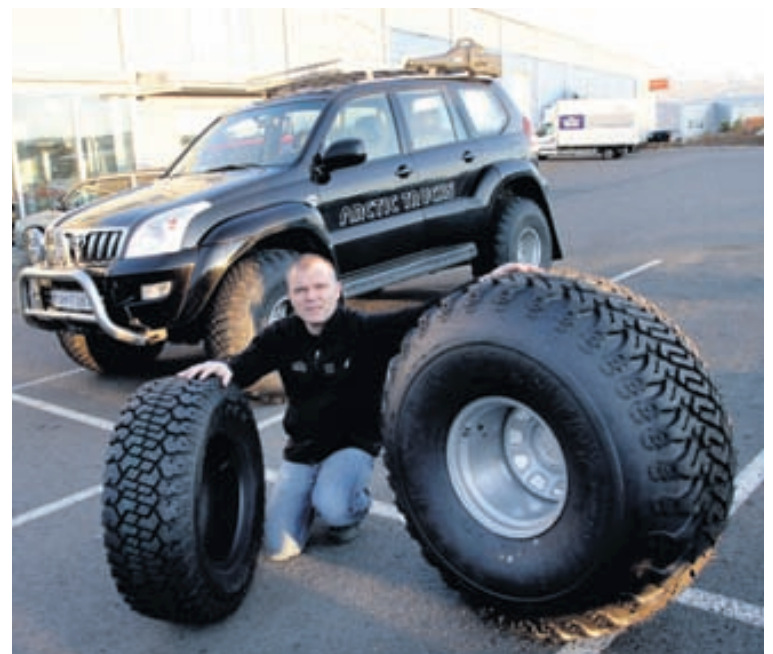
Gunnar segir fáa dekkjaframleiðendur enn framleiða 38 tommu dekk og því séu AT405 dekkinn frá Arctic Trucks mjög eftirsótt.

Arctic Trucks selur einnig AT405, sem er 38 tommu dekk