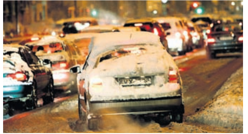
Réttur loftþrýstingur gefur traustara veggrip hjólbarða, sem eykur öryggi til muna.