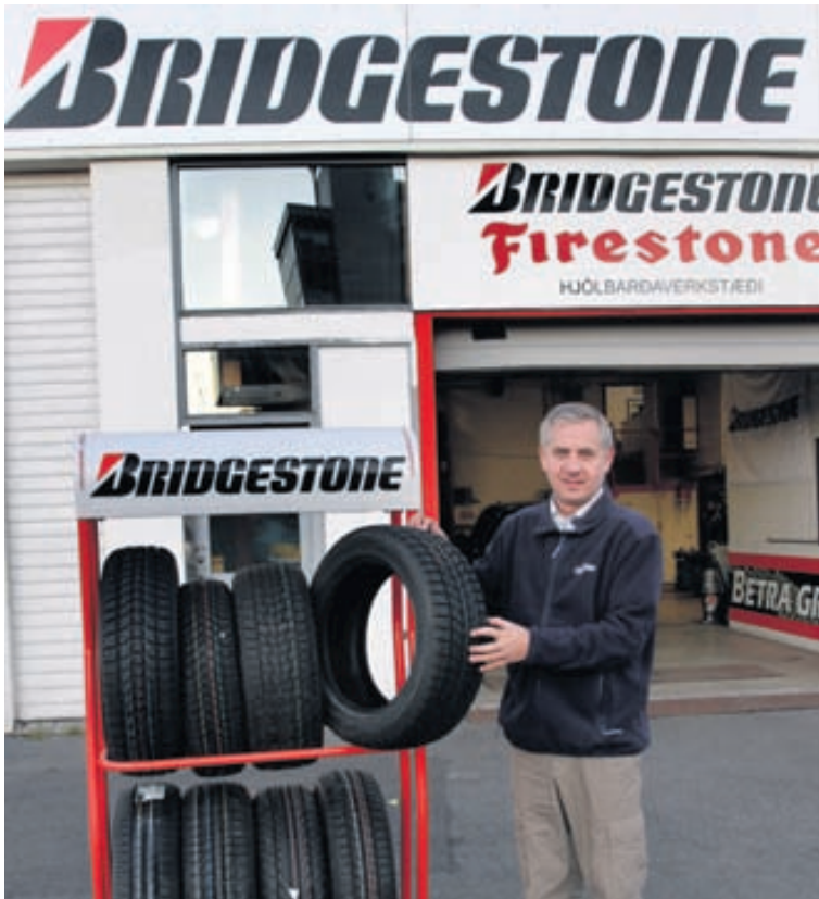
Loftbóludekkir eru fyrsti raunverulegi valkosturinn við hefðbundin vetrardekk.