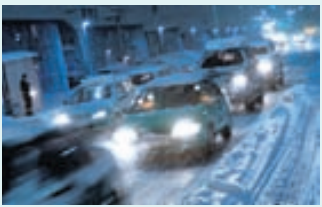
Hemlunarvegalegd er misjöfn eftir færð.