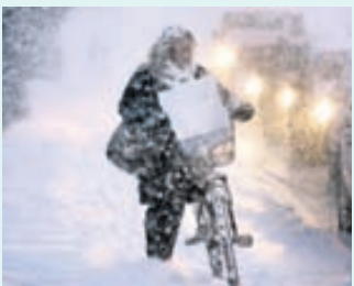
Keyrt í snjó.