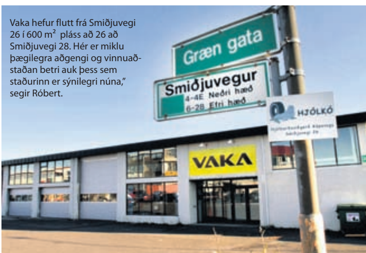
Vaka hefur flutt frá Smiðjuvegi 26 í 600 m 2 pláss að 26 að Smiðjuvegi 28. Hér er miklu þægilegra aðgengi og vinnuaðstaðan betri auk þess sem staðurinn er sýnilegri núna,“ segir Róbert.

Hjá Vöku er veitt öll almenn hjólbardabjónusta, hjólbardasala og rekið dekkjahótel. „Við erum með mjög gott verð á hjólbörðum og á allri þjónustu og leggjum okkur fram við að bjóða topp þjónustu.