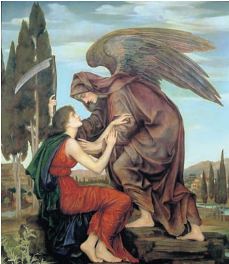
Engill dauðans. Oftast er sláttumaðurinn þó ekki fagur engill, heldur fremur óhugnanleg persóna eða beinagrind.