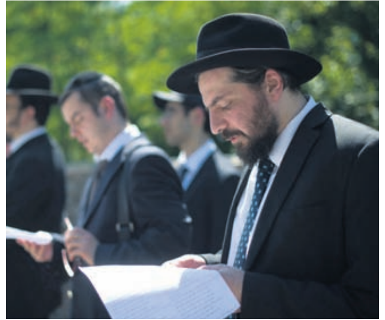
Rétttrúnaðargyðingar hafna líkbrennslu og leggja sitt fólk til hinstu hvílu eins fljótt og auðið er.

Hægt er að hafa samband við Athöfn hvenær sem er sólahringisins í síma 551-7080.