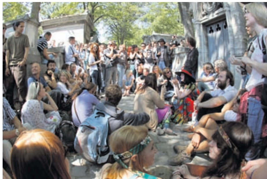
Fjöldi fólks safnaðist saman við leiði Jims Morrison í Père Lachaise-kirkjugarðinum í París í júlí til að minnast þess að 40 ár voru liðin frá dauða hans.

Vinsældir leikkonunnar Marilyn Monroe (1926-1962) eru slíkar að árlega flykkjast þúsundir manna að gröf hennar í Westwood Memorial Park í Los Ange-