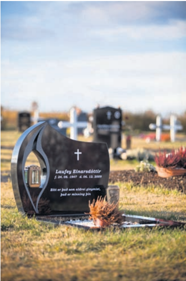
Graníthúsið sendir legsteina frítt út á land.