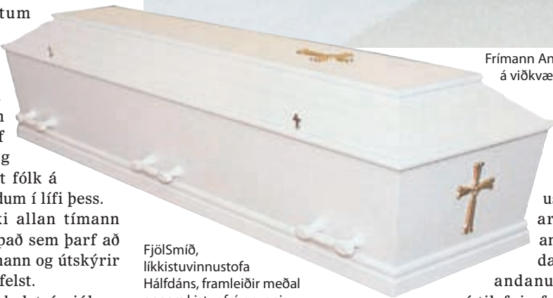
Fjölsmíð, líkkistuvinnustofa Hálfáns, framleiðir meðal annars kistur frá grunni.

og eins eru í boði kistur sem koma frá útlöndum, meðal annars úr eik, birki og furu. Einnig erum við með ýmsar tegundir af duftkerum en það hefur verið mikil aukning í bálförum síðustu árin. Allar kistur og duftker sem við höfum er hægt að