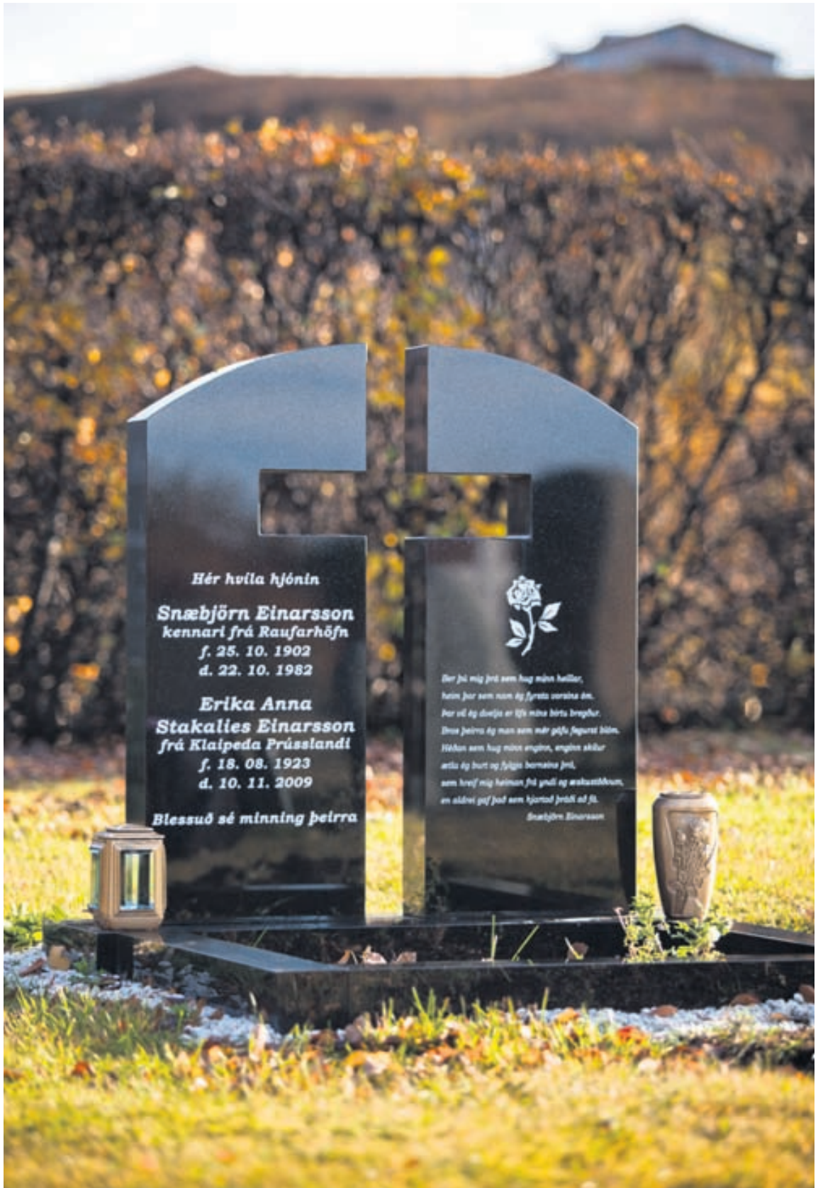
Flestir steinarnir eru úr graníti og unnir í Kína. Einnig er hægt að fá steina úr marmara og íslensku grjóti.