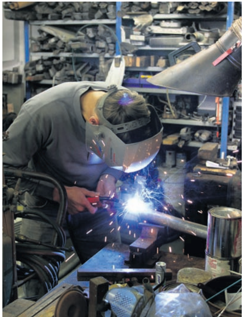
Reynt er eftir bestu getu að gera við vatnskassa og bensíntanka en Grettir vatnskassar hefur einnig yfir að ráða dágóðum lager ef eitthvað nýtt vantar.

Nánari upplýsingar um Gretti Vatnskassa er að finna á vefsíðunni www.vatnskassar.is .