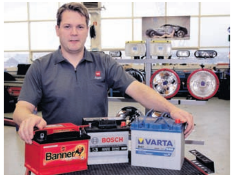
N1 er umboðsaðili fyrir viðurkennd merki, Bosch, Banner og Varta.

„Til að tryggja betri endingu rafgeyma verður að huga að nokkrum atriðum. Þess verður að gæta að þeir verði ekki fyrir verulegu hnjaski eða skemmdum. Svo verður að velja rétta gerð hleðslutækis og í viðeigandi stærð, ekki of lítið eða stórt miðað við rafgeyminn. Of lítil eða mikil hleðsla getur sett strik í reikninginn og líka lítil notkun á rafgeymi. Þá verður að passa upp á sýru- og vökvamagn en vanti vökva á geymi hefur hann annaðhvort lekið eða verið ofhlaðinn sem getur gerst þegar hleðslukerfið bílar og spennan (Volt) er of há í lengri tíma.“