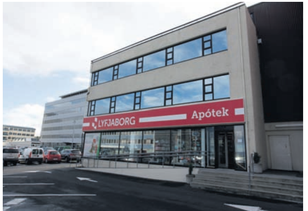
Lyfjaborg, sem áður hét Laugarnesapótek, flutti í Borgartún í byrjun maí.