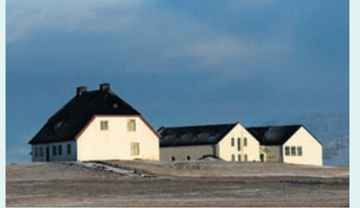
Lyfjafraeðisafnið er í endurgerðu fjósi við Nesstofu þar sem Lækningaminjasafnið er.

Lyfjafraeðisafnið er opið frá júní til ágúst og er aðgangur ókeypis. Aðrir opnunartímar eru eftir samkomulagi. Heimild: www.laekningaminjasafn.is/