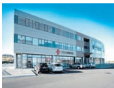
Urðarapótek er rétt við Vesturlandsveginn til hægri handar þegar ekið er í átt að Esjunni.

Urðarapótek í Grafarholti fagnar ársafmæli í næsta mánuði. Apótekið er við Vínlandsleið 16 og er þegar orðið vinsælt hjá íbúum hverfisins og vegfarendum um Vesturlandsveg sem koma þar við á leið sinni út úr bænum.