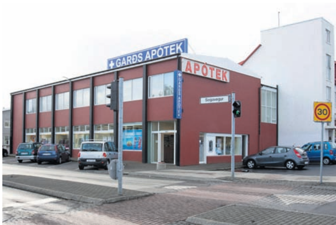
Garðs Apótek er við Sogaveg 108 og því í alfaraleið í miðju höfuðborgarsvæðisins.