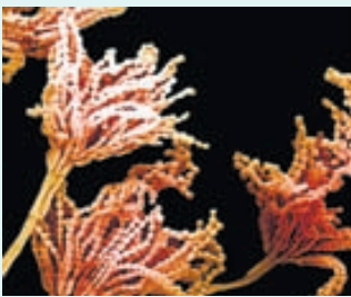
Gró sveppsins penicillium notatum varð til þess að sýklalyfið penisillín uppgötvaðist.

Leikföng, barnabækur og spennandi baðvörur má víðast finna í úrvali handa börnum og auðvelt að gleðja konur með eðal snyrtivörum, dýrindis ilmvoðnum, skarti, undirfatnaði og heilsubókmenntum í fallegum pakka. Karlar verða ekki út undan þegar kemur að notalegum gjafahugmyndum og er nóg að nefna vönduð rakakrem, fótisnyrtiset, rakvélur, unaðsvörur, sokka og nuddtæki fyrir þreytta skrokka.