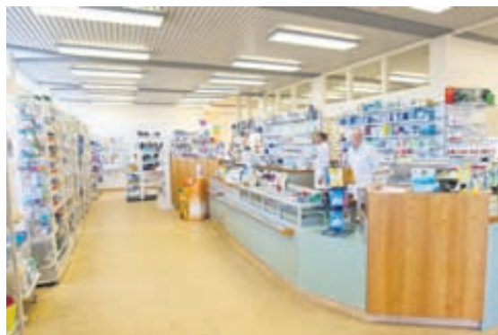
Apótekið tók til starfa árið 1956 og fagnar því 55 ára afmæli í ár.