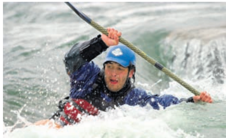
Ísland þykir vera langt komið í svokallaðri ævintýraferðamennsku samkvæmt The Independent.

Athygli vekur að tvö önnur Norðurlandaráki eru á lista yfir