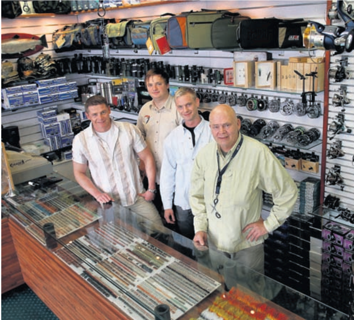
Í Veiðiporti er reynt að höfða til allrar fjölskyldunnar. Þá hnýtir starfsfólkið margar flugurnar sjálf.