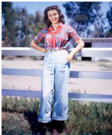
Konur gengu almennt ekki í buxum fyrr en um miðja síðustu öld.

Þá vakti leikarinn og fyrirsætan Cody Fern mikla athygli þegar hann mætti í bláum kúreka-stígvélum með hæl í veislu í The Metropolitan Museum of Art's. Svo má ekki gleyma John Travolta sem gekk á hælum í kvikmyndinni Saturday Night Fever og skapaði mikla diskótísku. Þá var söngvarinn Prince ávallt á háum hælum en það gerði hann líklega til að hækka sig um nokkra sentimetra.