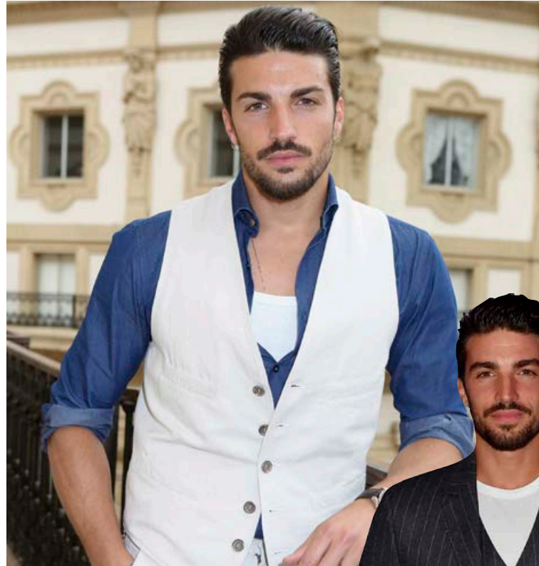
Mariano Di Vaio er fjölhæfur og með fjölda fylgjenda á Instagram.

Mariano di Vaio er með sína eigin fatalínu og hefur einnig unnið með stórum nöfnum á borð við Hugo Boss og Maserati auk þess sem hann hefur skrifað bók um