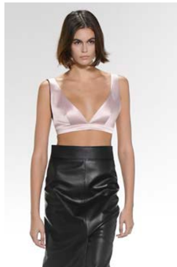
Hér á sýningarpallinum í París fyrir Givenchy, vor- og sumartískan 2020.

Cindy segist hafa kennt dóttur sinni eitt og annað um fyrirsætuheiminn en á móti hafi dóttir