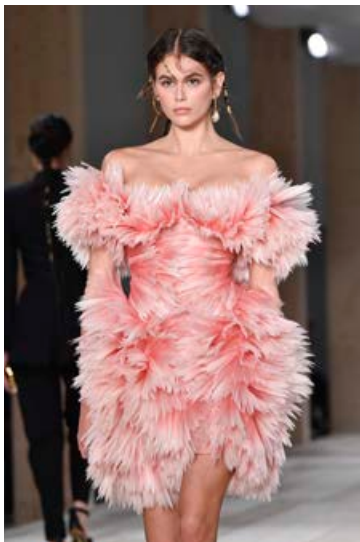
Hér er Kaia að sýna fyrir Alexander McQueen, sumartískuna 2020.

Í viðtali við októberhefti Vouge segir Kaia að móðir hennar hafi alltaf lagt áherslu á heilbriggt samband. „Þegar hún kom heim úr vinnunni tók hún af sér farðann og varð bara venjuleg mamma.“