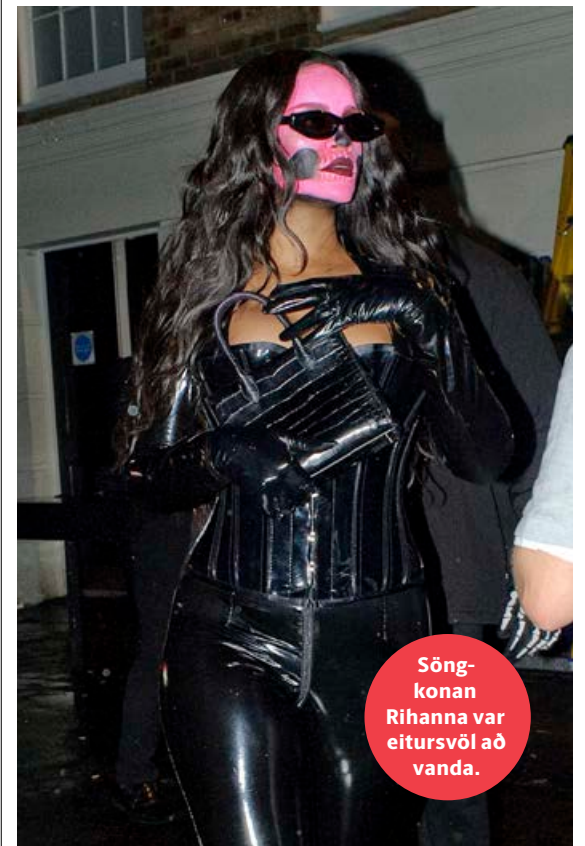
Söngkonan Rihanna var eitursvöl að vanda.