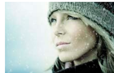
Vetur konungur getur rifið fast í hárið með kuldakrumlu sinni.