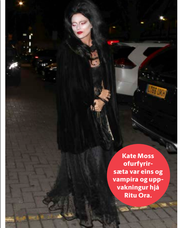
Kate Moss ofurfyrirsæta var eins og vampíra og uppvakningur hjá Ritu Ora.