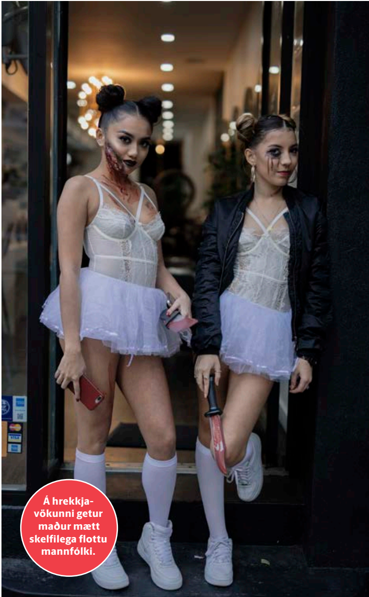
Á hrekkjavökunni getur maður mætt skelfilega flottu mannfólki.

líkamsleifum. Enn eru ósédur búningarnir sem verða fyrir valinu hjá hinum frægu og fínu í ár en til að gefa landsmönnum hugmyndir að skemmtilegri innkomu í hrekkjavökupartíin hér heima er tilvalið að skoða hverju fræga fólk þetta klæddist á hrekkjavökunni fyrir ári.