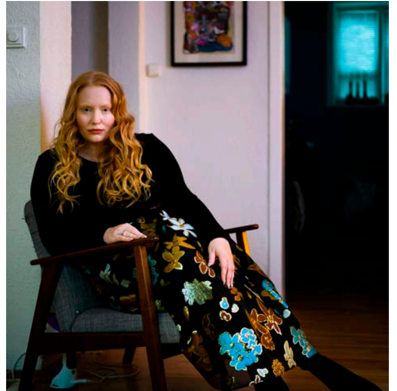
Hérna er Hekla í kjól frá Stine Goya og skóm frá Vagabond.

Ég finn mér alltaf eitthvað fallett í Stefánsbúð og Yeoman, stundum á Asos og svo leynast margar þerlur