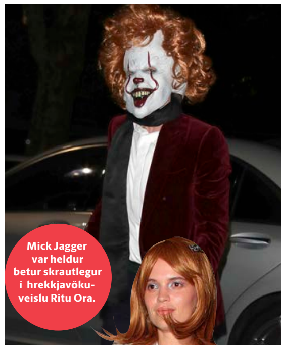
Mick Jagger var heldur betur skrautlegur í hrekkjavökuveislu Ritu Ora.