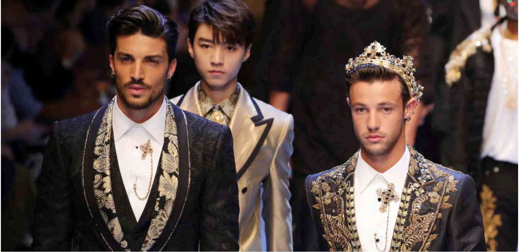
Mariano Di Vaio er andlit nýs herrailms frá Dolce & Gabbana. Hér sýnir hann fót frá þeim þegar herrastískan 2019 var kynnt.