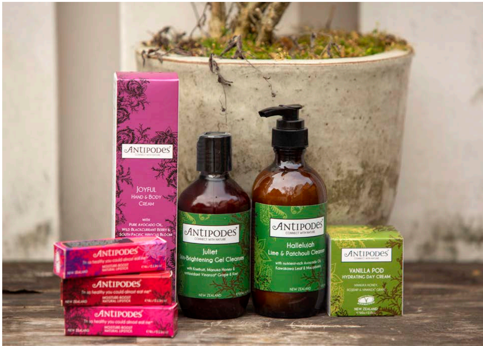
Antipodes lífrænt vottaðar snyrtivörur; þú færð hreinsimjólka fría ef þú kaupir einn hlut frá Antipodes.