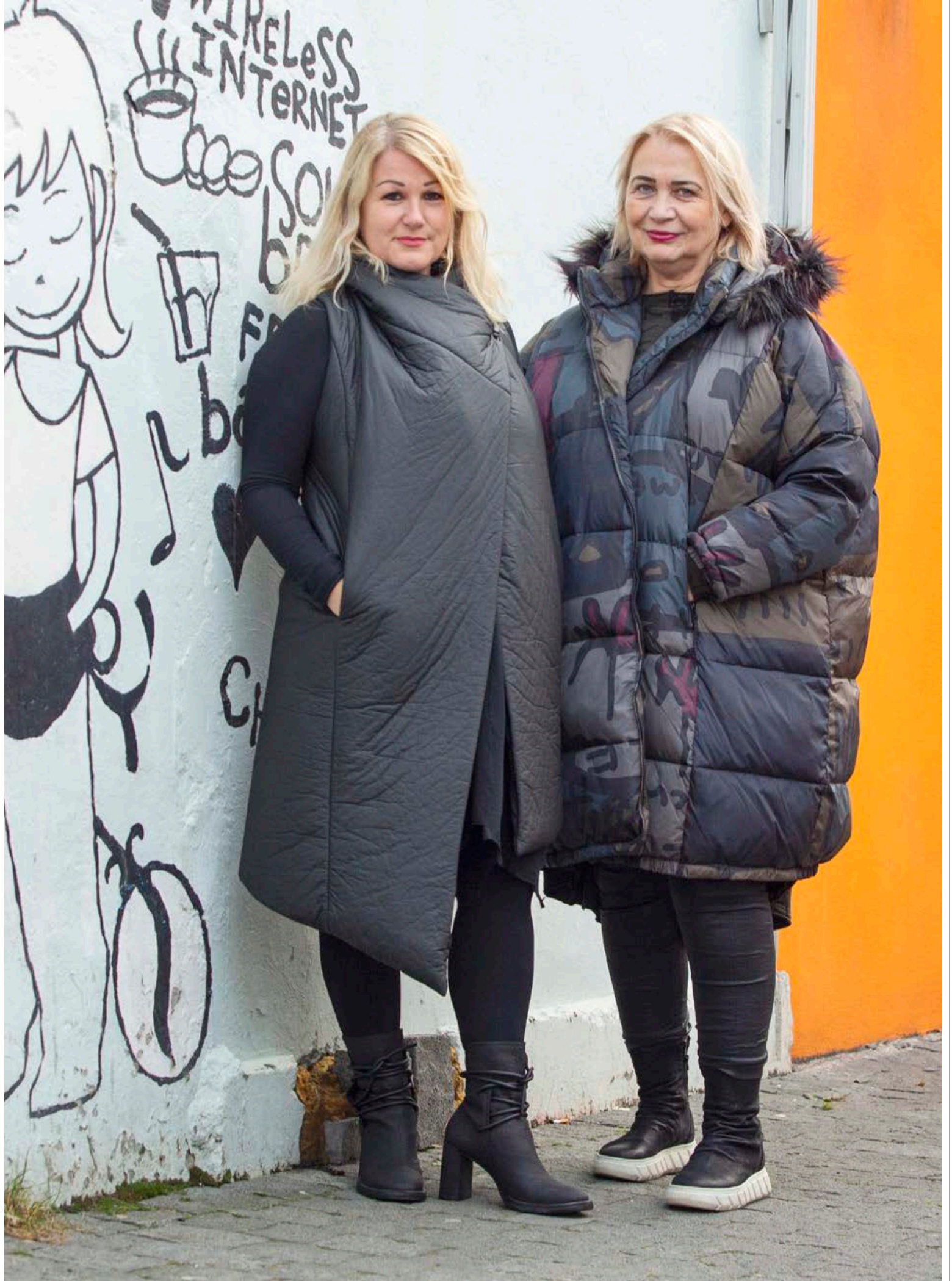
Eva er í varmavesti frá studiob3 og skóm frá Puro. Púriður er í dúnúlpu frá Rundholz og skóm frá Lofina.