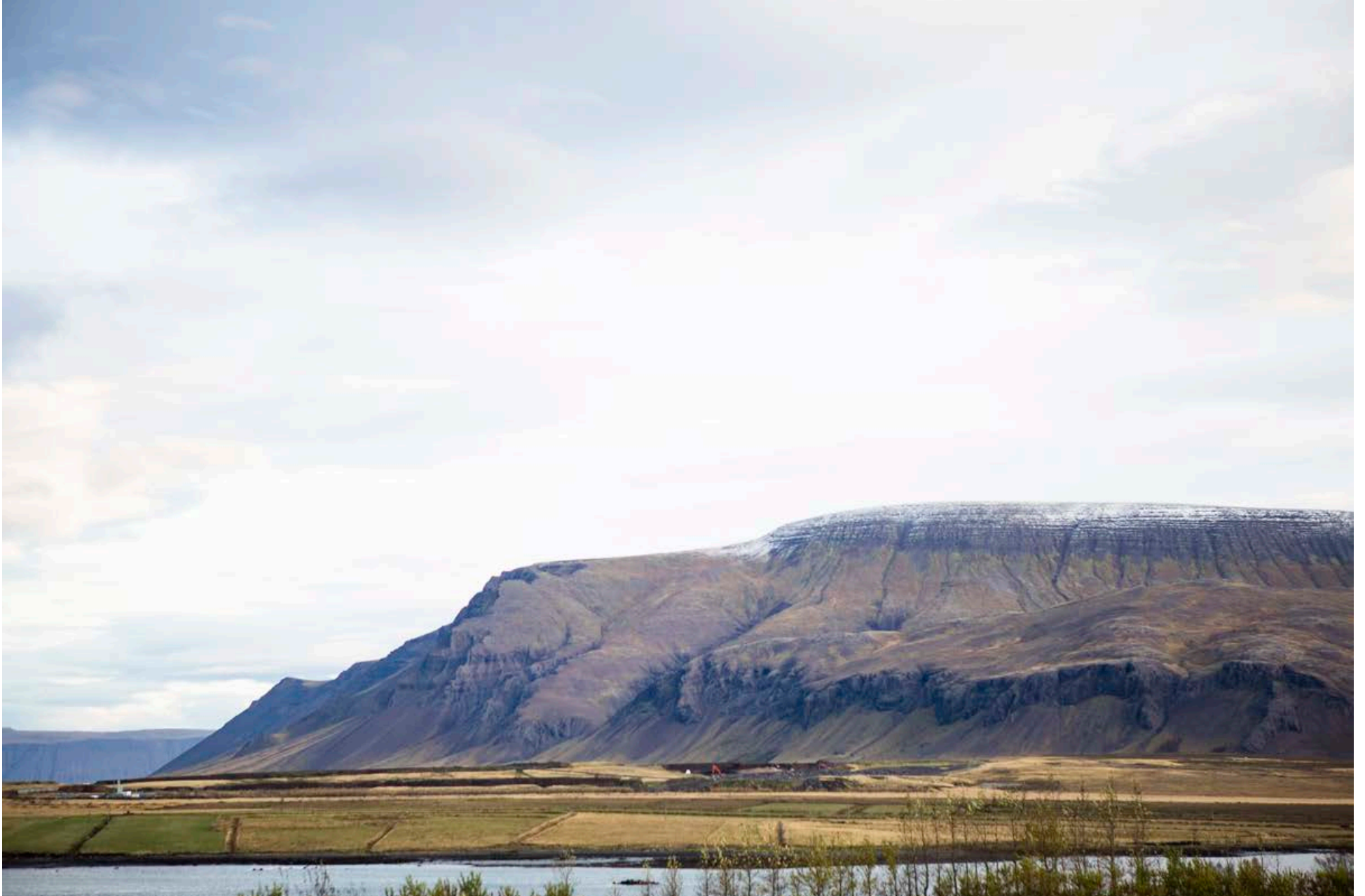
Lóðirnar eru á fyrrverandi æfingasvæði og aðstöðu golfklúbbs Mosfellsbæjar og bjóða upp á fallett og einstakt útsýni yfir Esjuna og sundin blá, sem er vandfundið á höfuðborgarsvæðinu.

B æjarráð Mosfellsbæjar hefur samþykkt úthlutunarskilmála fyrir lóðir við Súluhöfða í Mosfellsbæ. Lóðirnar eru ætlaðar fyrir einbýlishús og þær lóðir sem eru fyrir neðan götu liggja að sjó með óskert útsýni yfir voginn og flóann. Einungis einstaklingum er heimilt að sækja um lóðirnar en þeir geta hins vegar gert tilboð í fleiri en eina lóð. Hver aðili getur eingöngu fengið úthlutaða eina lóð.