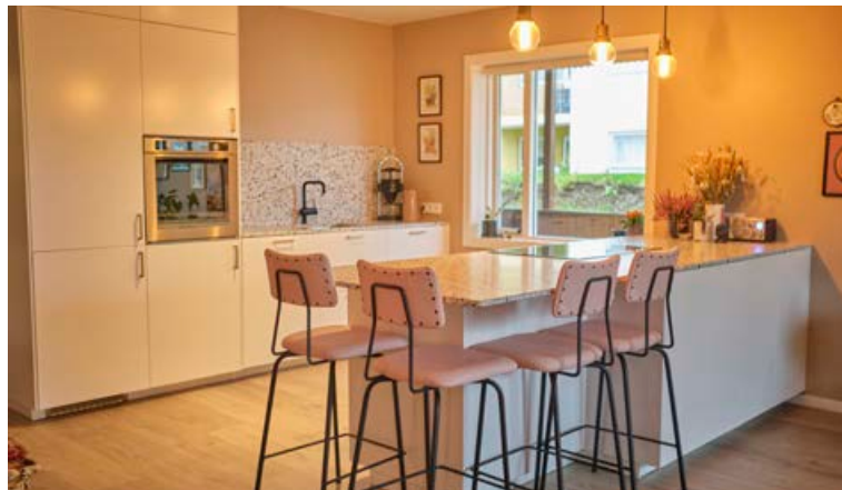
Það þurfti þolinmæði til að biða eftir borðplötunni sem brotnaði á leiðinni.