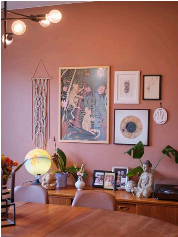
Veggir heimilisins eru prýddir fallegum myndum.

„Þegar við fluttum tókum við meðvitada ákvörðun um að hörfa frá hvítum veggjum og reyna að velja inn eins marga liti og hægt væri. Við fundum okkur snemma