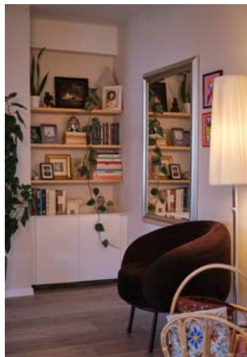
Plöntur og listaverk af ýmsu tagi eru áberandi á heimilinu.