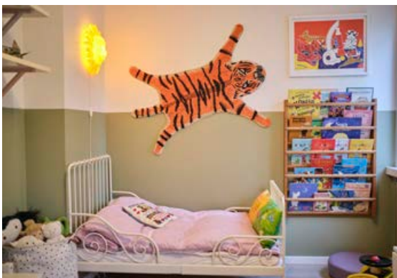
Barnaherbergin eru full af bókum og dýrum.

litapallettu, og í miklu samstarfi við systur mína keyrðum við í málningarbúðir til að safna saman þeim litum sem okkur þóttu flottastir.“ Þá er femínisminn, sem er fjölskyldunni svo hugleikinn, áberandi víða á heimilinu. „Við erum að vinna með femíniska list, að reyna að koma kvenlíkamanum fyrir á eins mörgum stöðum og okkur dettur í hug.“ Listin kemur úr ýmsum áttum. „Þetta er líka blanda af heimagerðri list og føndri.“