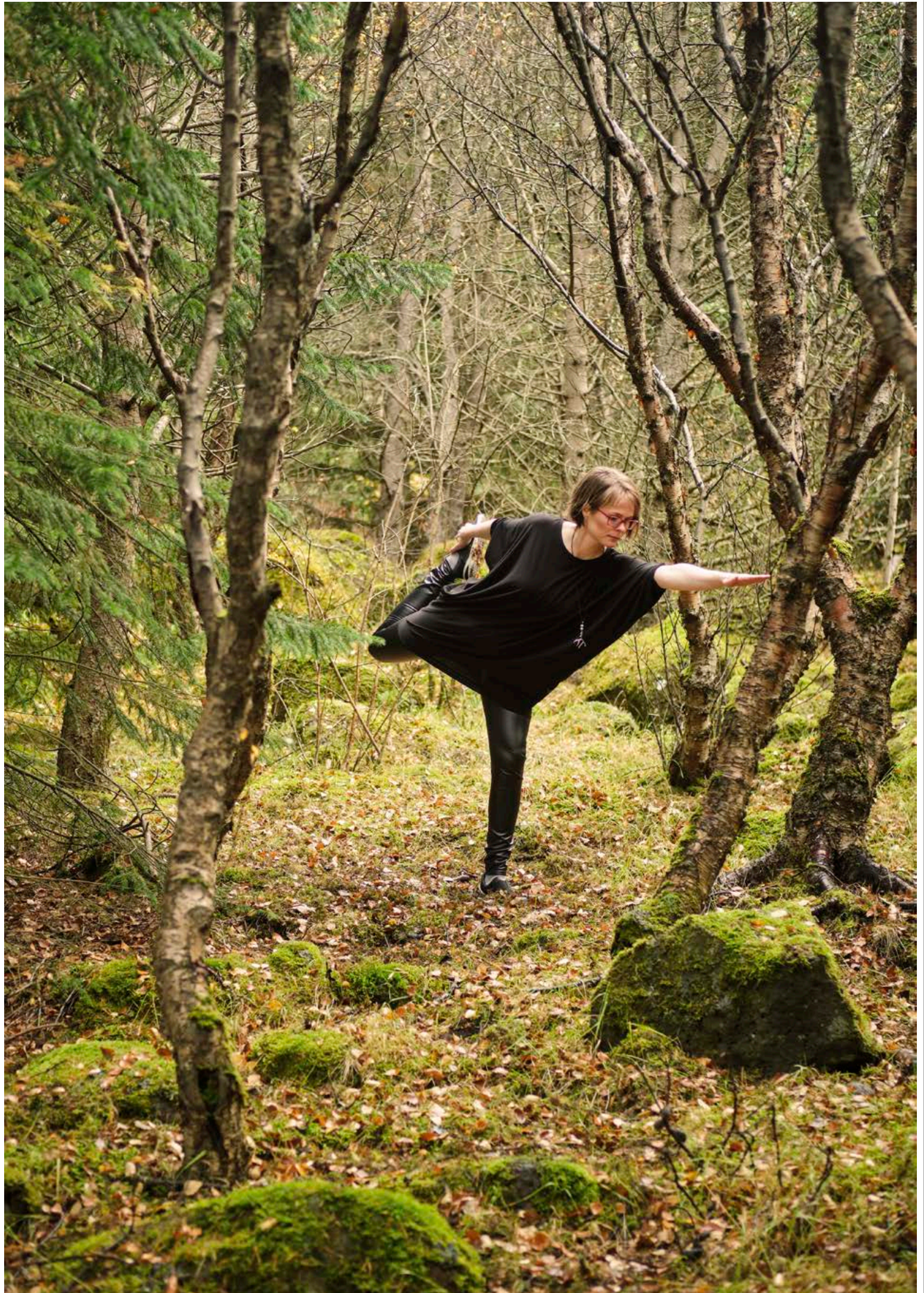
Bjarney lærði jógakennslu til að deila jákvæðri reynslu sinni.