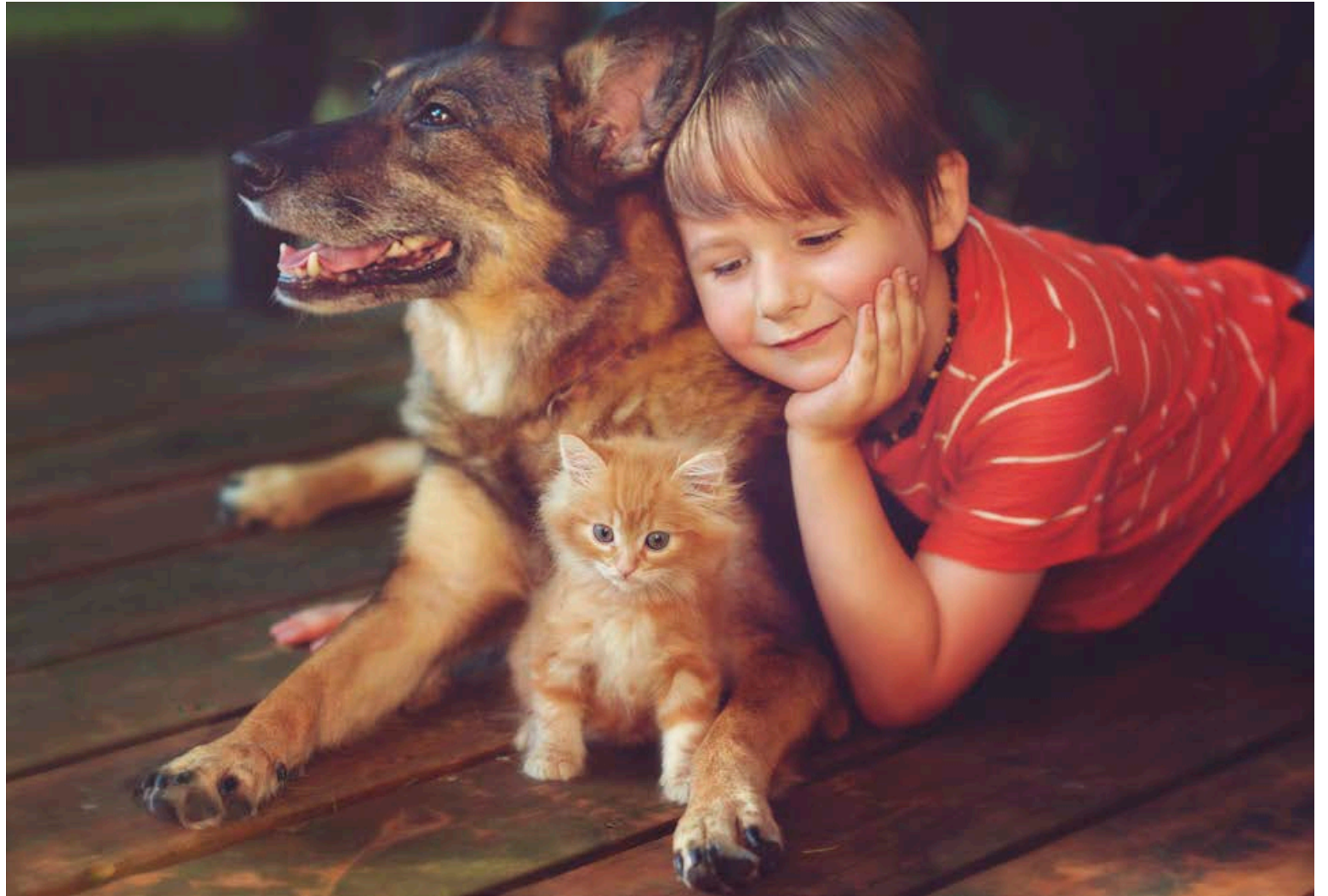
Bæði kettir og hundar hafa hæfileika til tengslamyndunar.

Niðurstöðurnar voru þær að kettirnir mynda tengsl á ótrúlega svipaðan hátt og ungbörn. 65% ungbarna eru í öruggum tengslum við aðal-umönnunaraðila sinn. Rannsóknin sýndi að hlutfallið er það sama hjá heimilisköttum,