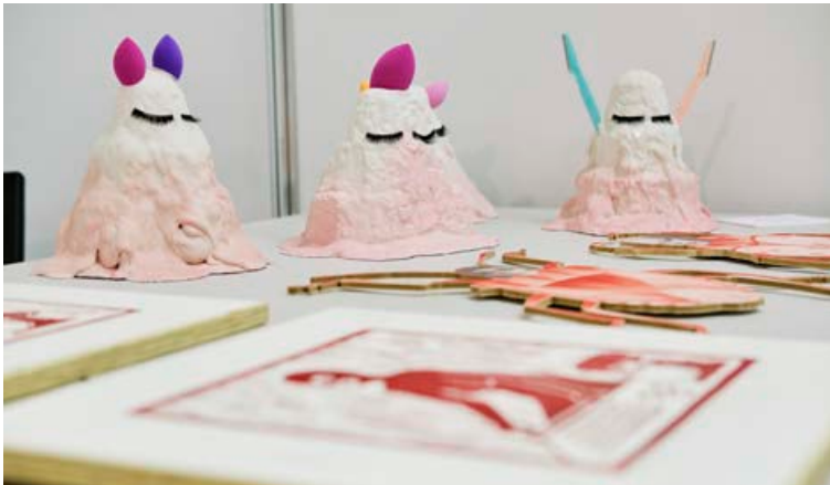
Spennandi sköpunarverk myndhöggvarans Valgerðar Guðlaugsdóttur.