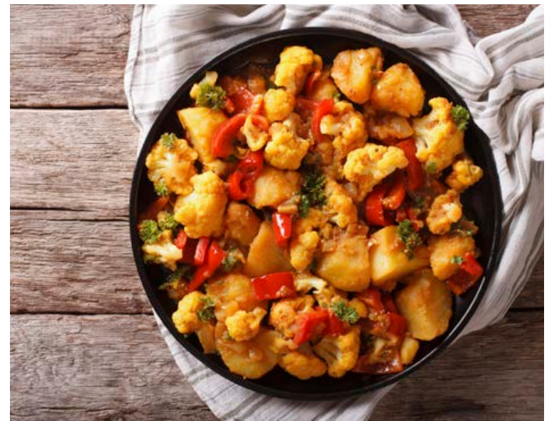
Einfaldur blómkálsréttur með indversku ivafi.

Síðumúli 31 | www.parketverksmidjan.is | s. 581 2220 & 840 0470