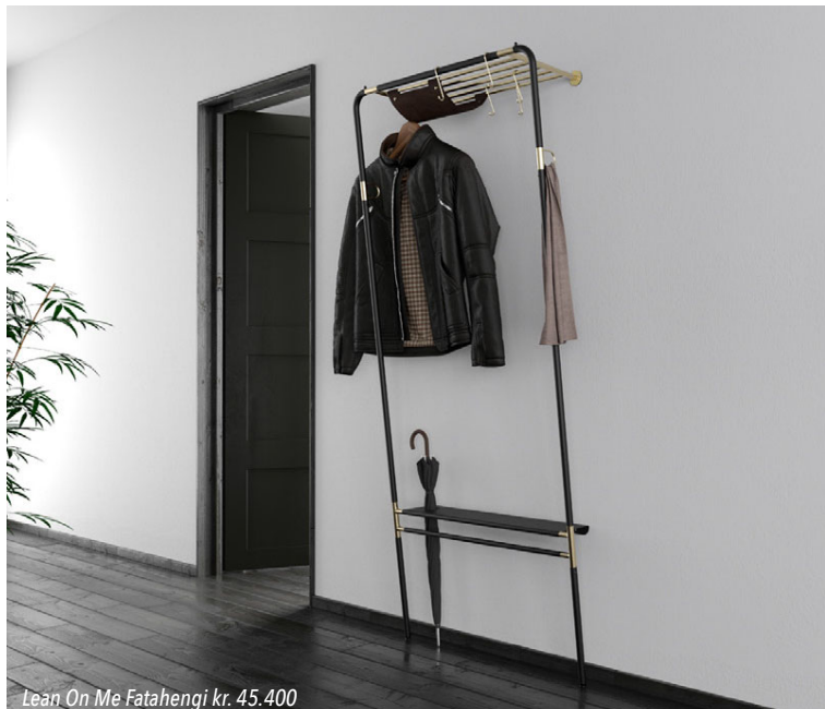
Lean On Me Fatahengi kr. 45.400