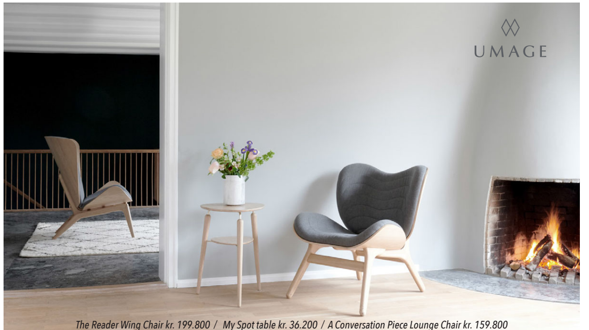
The Reader Wing Chair kr. 199.800 / My Spot table kr. 36.200 / A Conversation Piece Lounge Chair kr. 159.800