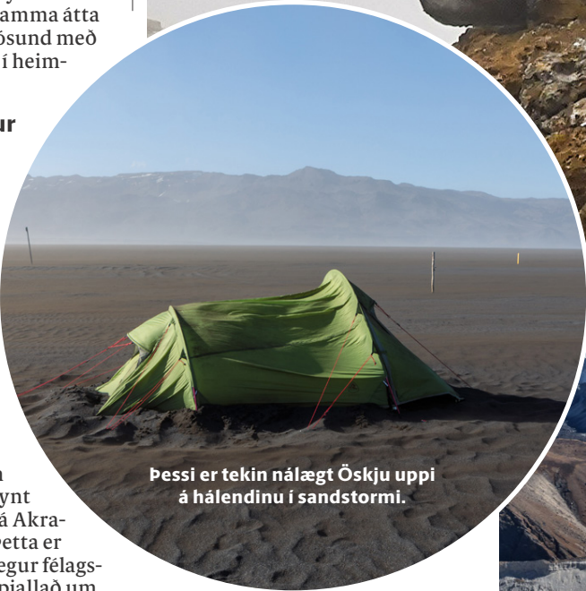
Þessi er tekin nálægt Öskju uppi á hálandinu í sandstormi.