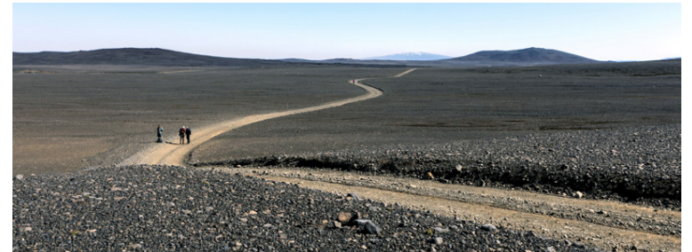
Á hálandinu. Þessi mynd sýnir vel auðnina á þessum slóðum.

„Það getur verið erfið að fara upp og niður fjöllin með mikinn þunga á bakinu. Þetta hafðist þó með reglulegri hvíld á leiðinni. Við sváfum í tjöldum utan eina nótt,“ útskýrir hún og bætir við að henni finnst best að ganga á millistífum