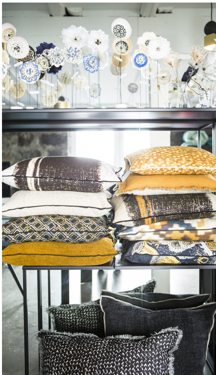
Í sýningarrýminu má sjá úrval fallegar franskra hönnunar.

Við erum ekki komin komin hingað í stutt stopp. Við viljum vera hér svo lengi sem við erum hamingjusöm.