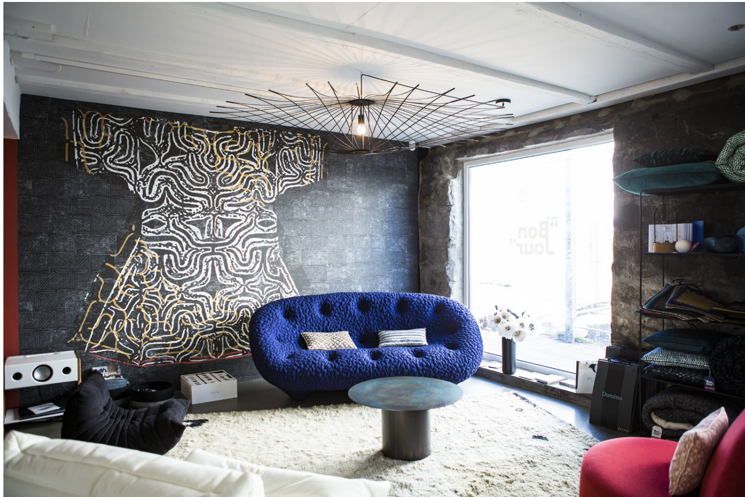
Sýningarrýmið er hugsað til að gefa viðskiptavinum hugmyndir.

„Viðskiptavinirnir geta verið einstaklingar en þeir geta líka verið fyrirtæki. Ég byrja oftast á að heimsækja viðskiptavinina til að