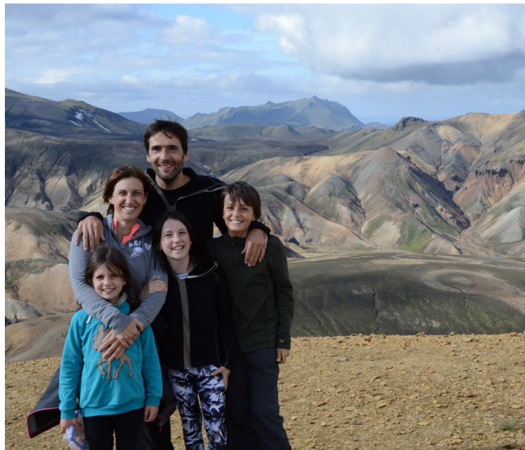
Fjölskyldan heillaðist af landi og þjóð og settist að hér á landi

„Hann vann við fjármálaráðgjöf áður en við fluttum til Íslands. Hann er búin að stofna fjármálaráðgjafar fyrirtæki á Íslandi, X.FIN, og er þegar kominn með viðskiptavinum. En hann vinnur stundum í stúdíóinu þegar ég er þar ekki. Fjölskyldan gengur fyrir og stundum fer ég að gera eitthvað með krökkunum og þá hleypur hann í skarðið.“