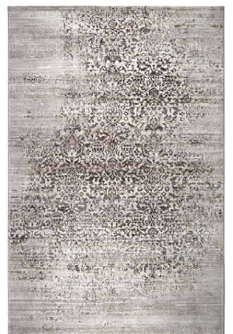
160X230 / KR. 71.400