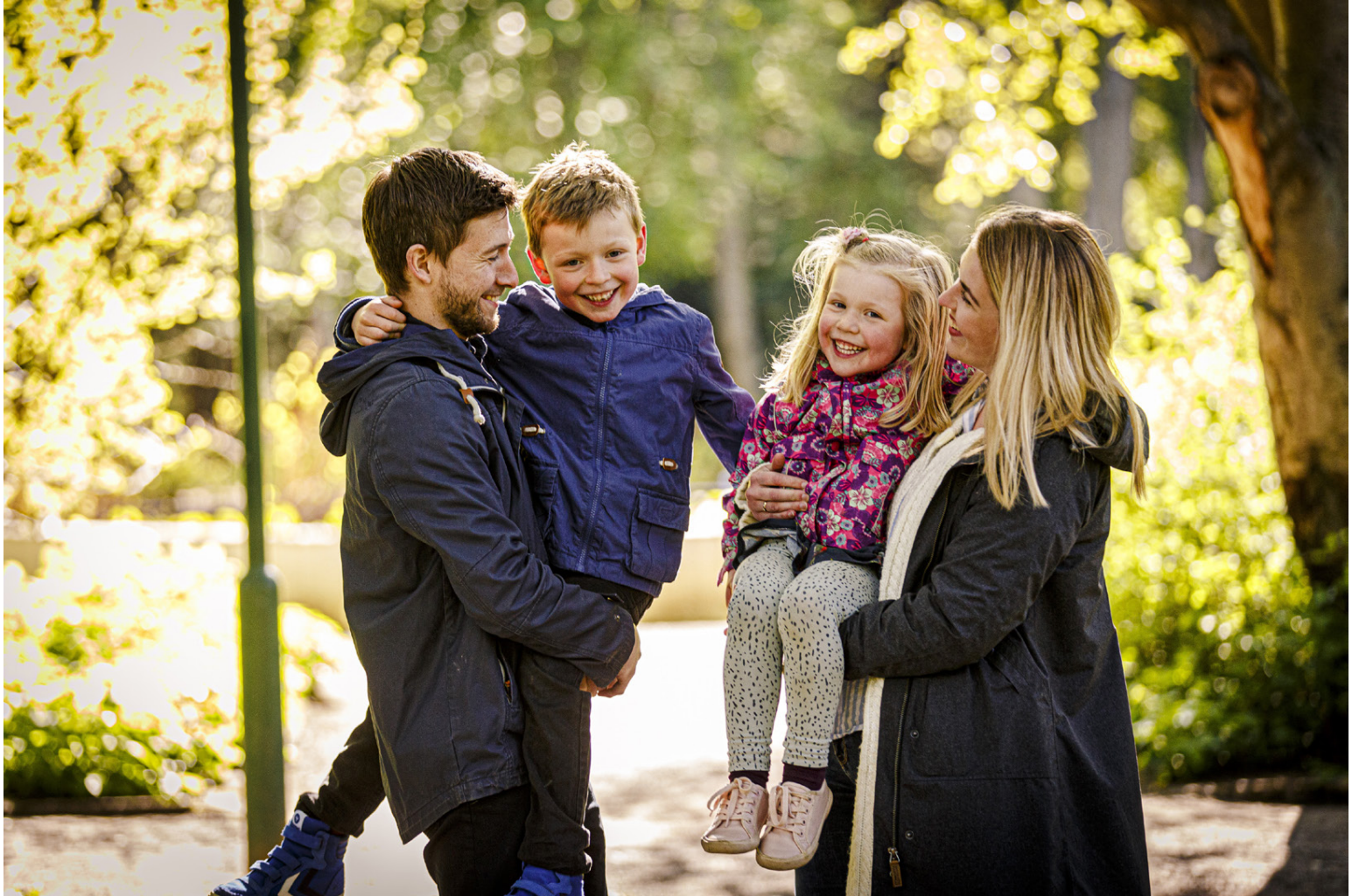
Fjölskyldan er mjög samtaka í umhverfisvænum lífsstíl.

Dagfríður segir að breyttum lífsvenjum fylgi hugarfarsbreyting. „Ég upplifi þetta svöltil eins og ég sé að hægja á mér. Maður reynir aðeins að aftengja sig hraðanum í