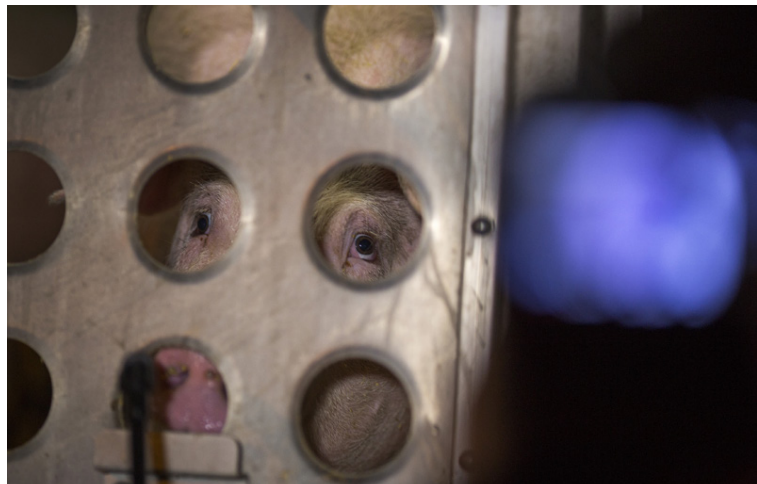
Sífellt fleiri kjósa að borða ekki kjöt því að þeir efast um réttmæti iðnaðarframleiðslu á kjöti. Mikill vöxtur hefur verið í veganisma undanfarin ár.

Samkvæmt skýrslunni er það bara tímaspursmál hvenær kjöt sem er ekki framleitt úr dýrum