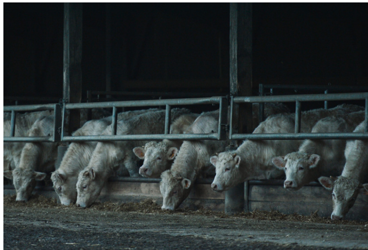
Iðnvædd kjötframleiðsla hefur gríðarlega slæm áhrif á umhverfið.

nær umtalsverðri markaðshlutdeild. Enn um sinn eru fyrirtæki sem selja vegan mat lítil í samanburði við kjötiðnaðinn, en þau vaxa hratt.