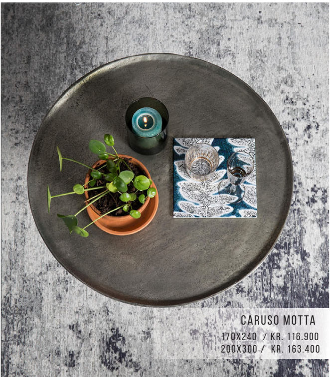
CARUSO MOTTA 170X240 / KR. 116.900 200X300 / KR. 163.400