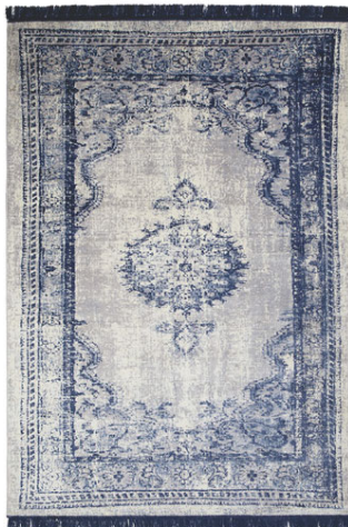
170X240 / KR. 61.200