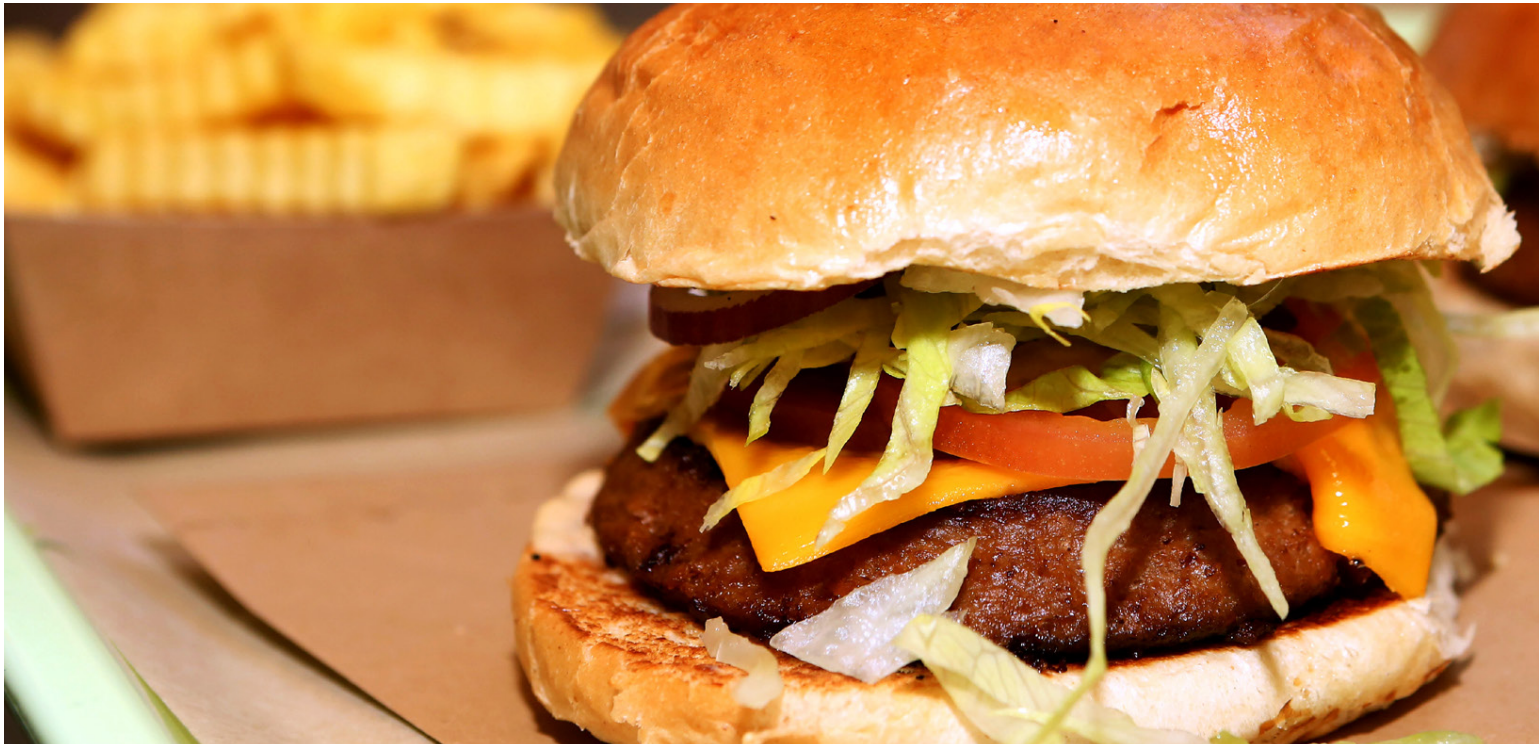
Kjötlausir hamborgarar eru framtíðin, samkvæmt skýrslu alþjóðlega ráðgjafarfyrtækisins AT Kearney.

Í nýrri skýrslu frá alþjóðlega ráðgjafarfyrtækinu AT Kearney er því spáð að eftir 20 ár verði ræktað kjöt og kjöt úr plöntuafurðum búið að taka yfir rúmlega helming kjötmarkaðarins.