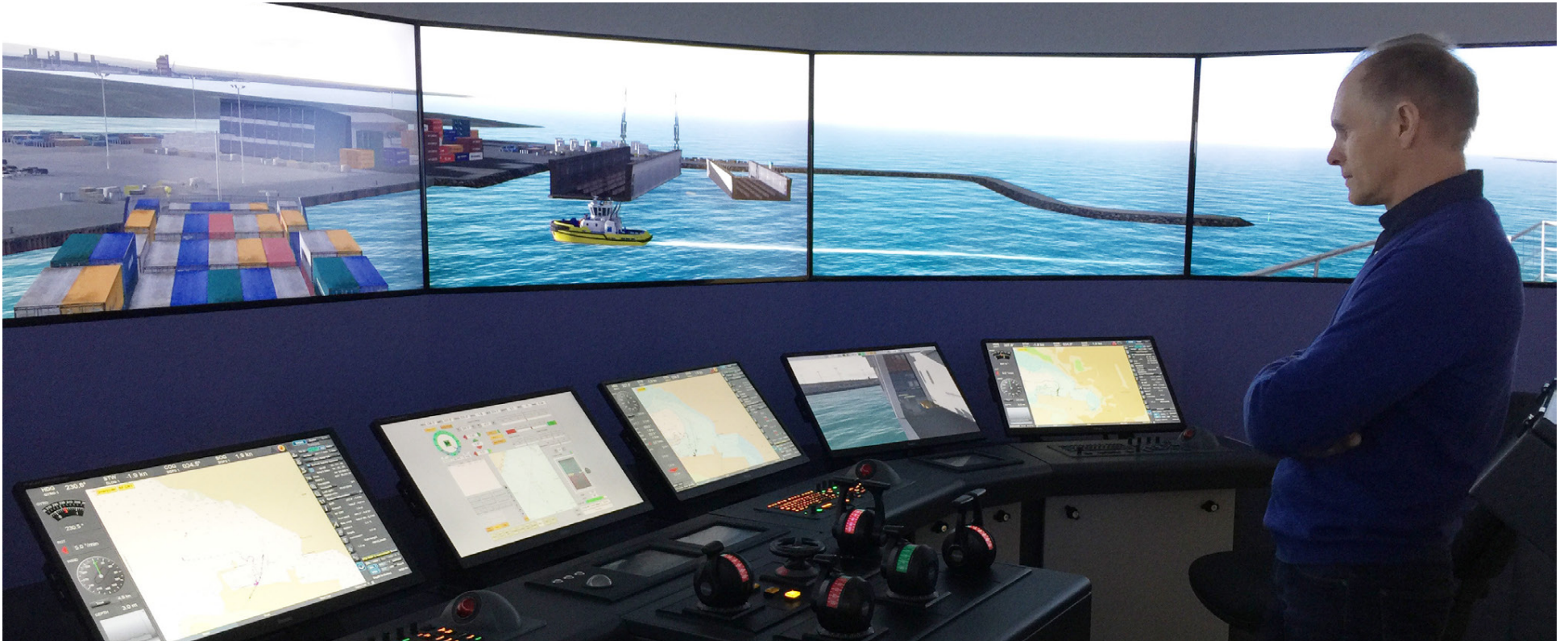
Námið samanstendur af skemmtilegum, lifandi og krefjandi námsgreinum. Verknámið fer fram í Sjómannaskólanum á Háteigsvegi en bóknámið er bæði hægt að taka í dagskóla eða dreifnámi.