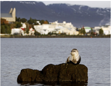
Það verður margt um að vera á Akureyri um helgina.

Á morgun einkennist dagurinn af hátíðarhöldum sjómannadagsins, til heiðurs sjómönnum og fjölskyldum þeirra. Hátíðarmessa verður í Grindavíkarkirkju þaðan sem gengið verður í Sjómannagarðinn þar sem krans verður lagður að minnisvarðanum Von. Þaðan liggur leiðin að hátíðarsvæðinu og eftir athöfn þar hefst fjölbreytt barnadagskrá. Leiktæki, andlitsmálning, fiskabúr með nytjafiskum og furðufiskum.