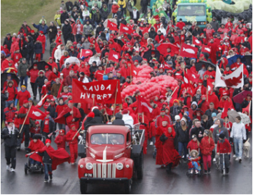
Grindavík breytist í litríkan bæ.