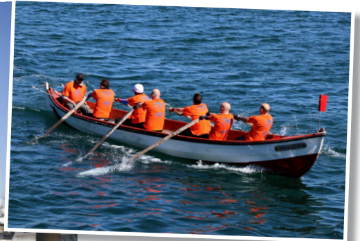
Kappróðurinn er gömul hefð frá því um 1950.