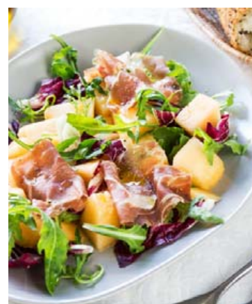
Salat með hráskinku og melónu.

Þetta er mjög ljúffengt salat sem passar vel með góðu, nýbökðu brauði. Síðan má alltaf bæta út í það eftir því sem fólk vill. Geitaostur eða brie-ostur henta vel með þessu salati og sömuleiðis er gott að setja jarðarber eða granateplafra yfir. Allt eftir því hvað hver vill gera mikið úr salatinu sem er borðað sem aðalréttur og hentar mjög vel á sumrin.