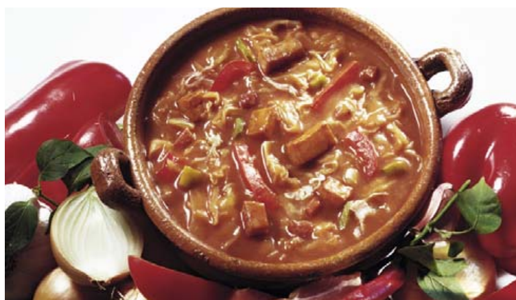
Gúlassúpa er alltaf göð, sama hvort það er sumar eða vetur.

1 msk. maizenamjöl 2 tsk. hrisgrjónaedik eða sérrí 1 msk. ljós sojasósa Smávegis malaður hvítur pípar 8 korn þurrkaður chili-pípar Smávegis salt (þarf að smakka til) 1 msk. ferskt engifer, fint rífið 4 hvítlauksrif, smátt söxuð 1 búnt vorlaukur 80 g kasjúhnetur Hrisgrjón