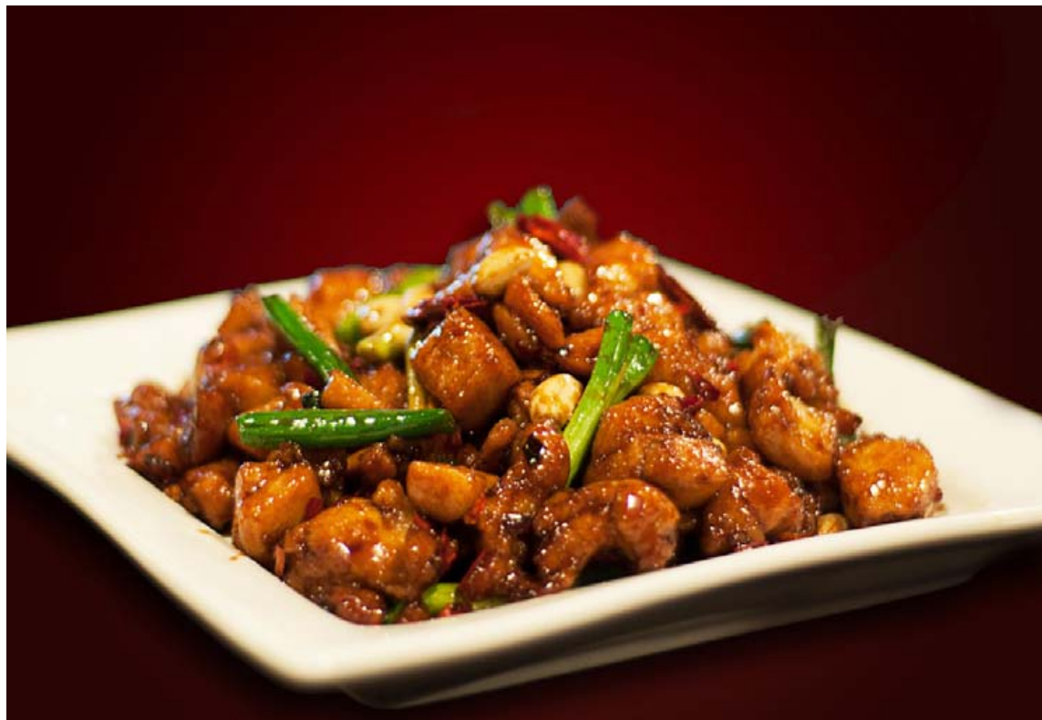
Einn vinsælasti kínverski kjúklingarétturinn.