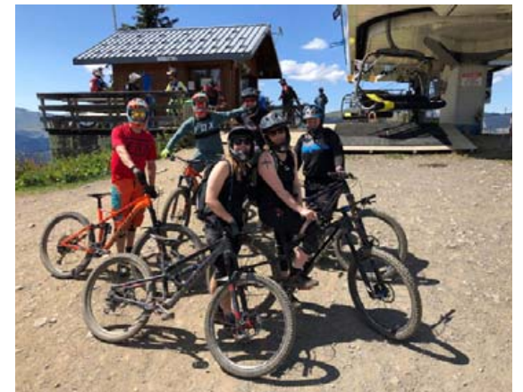
Hópurinn eyddi þremur dögum í Les Gets Bikepark.