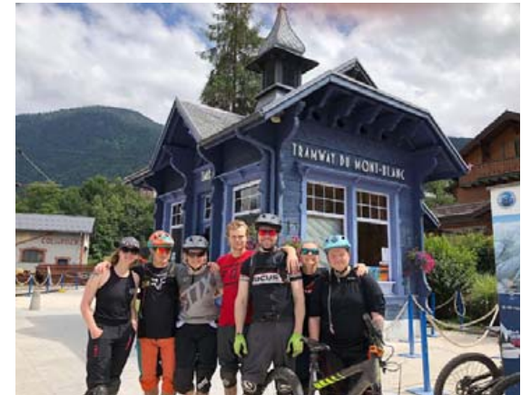
Hópurinn mættur og tilbúinn í ævintýrin fram undan.