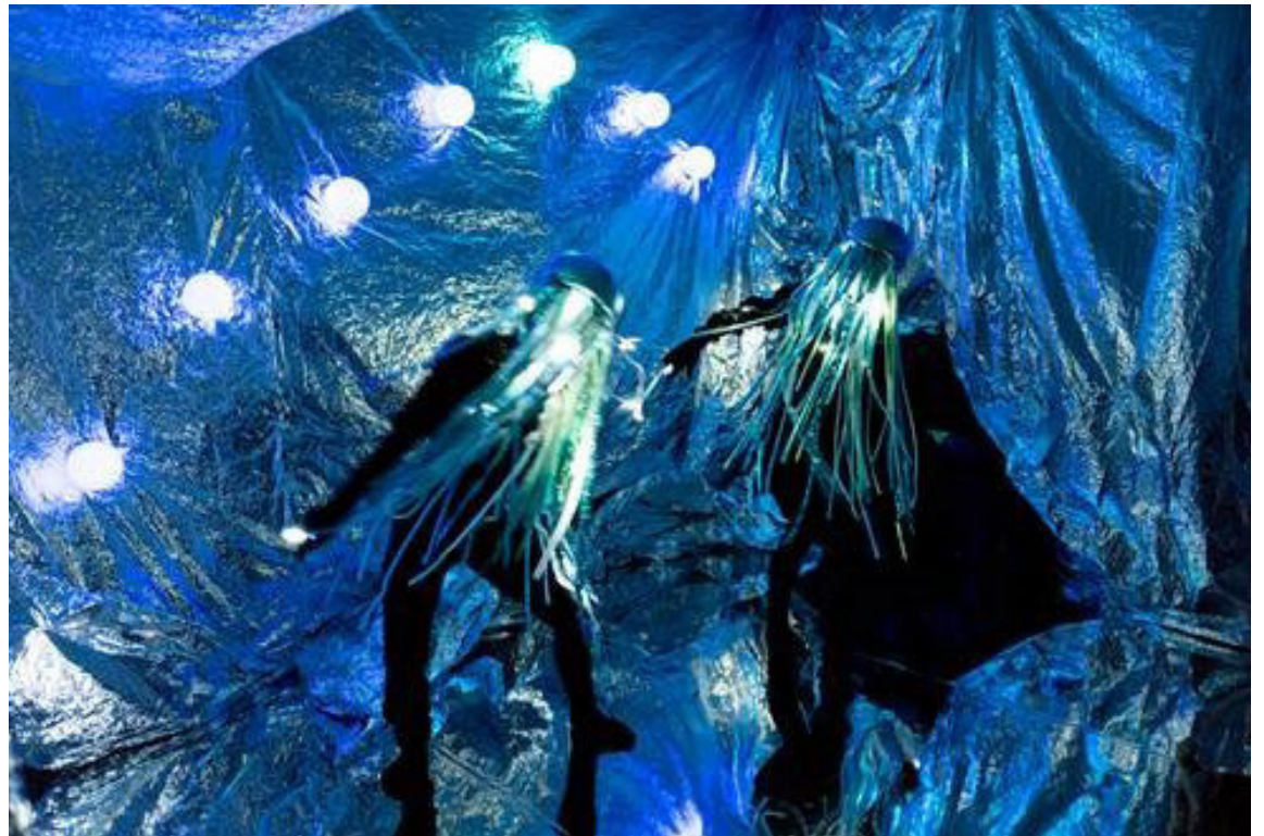
Könnunarleiðangurinn SPOR er spennandi upplifun sem á engan sinn líka og biður gesta í Ævintýrahöllinni.

Síðumúli 31 - 108 Reykjavík - S: 562-9018 / 898-5618