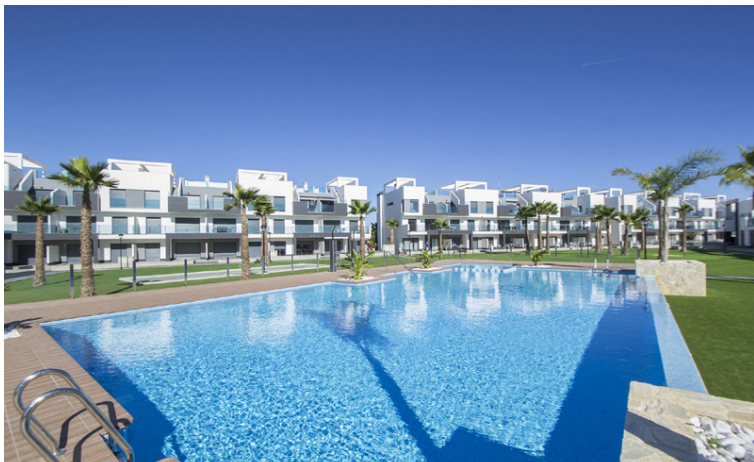
Bygðakjarnar með sameiginlegum sundlaugargarði eru vinsælir hjá Íslendingum sem flytja til Spánar í lengri eða skemmri tíma.

„Það var mikil gleði þegar markaðurinn opnaðist aftur og gjaldeyrishöftum var aflétt.“