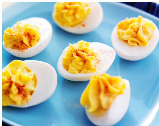
Djöflaegg eru gómsæt og lokkandi.

Hægt er að fylla eggin með hverju sem hugurinn gírnist út í eggjarauðuhræruna, til dæmis laxi, kryddpýlsum, beikoni, síld eða grænmeti og hægt að nota rjómaost eða gríska jógúrt í stað majónesi.