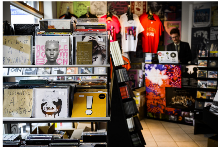
Það er fátt notalegra og meira róandi fyrir hugann en að róta í plötum.