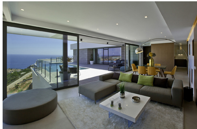
Verulega notalegt um að listast í þessari íbúð á Spáni og ekki skemmri útsýnið.