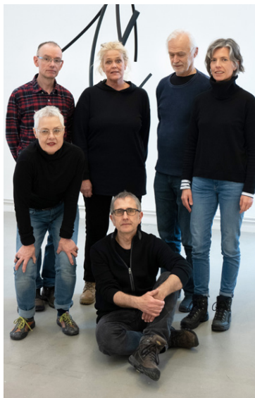
Listamennirnir sem sýna í Listasafni Árnesinga.