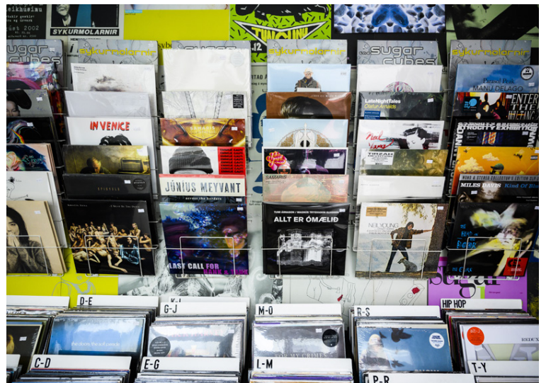
Plötubúðir bjóða flestar upp á gott úrval af nýjum og gömlum plötum.

Þrátt fyrir allt hefur vínplatin verið að auka við sig í sölu undanfarinn áratug þannig að við sjáum fram á góða tíma.