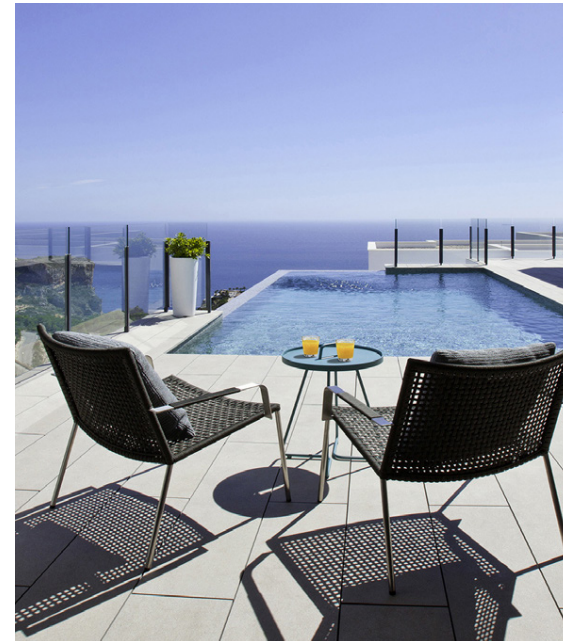
Paradís í sól. Hver gæti ekki hugsað sér að sitja þarna?