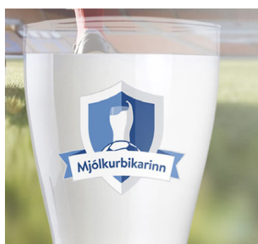
Knattspyrna er góð skemmtun.