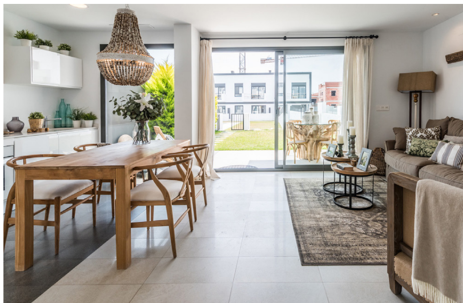
Steina aðstoðar fólk við að innrétta íbúðirnar og sömuleiðis með nettengingu og þess háttar.