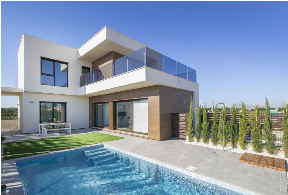
Eignirnar sem bjóðast á Spáni eru fjölbreytilegar að stærð og eru staðsettar í fögru umhverfi.

Þegar Steina er spurð um meðalverð á eignum sem vekja mestan áhuga hjá Íslendingum, svarar hún: „Ódýrustu eignirnar hjá okkur eru með einu svefnherbergi og kosta rúmar ellefu milljónir eða um 85 þúsund evrum en verð á eignum með tveimur svefnherbergjum er frá um 120 þúsund evrum. Vinsælli eignir í þeim flokki eru ívið dýrari eða frá um 160 þúsund evrum. Verðið hekkar svo ef bæta á við einu svefnherbergi til viðbótar en vinsælar eignir í þeim flokki eru frá um 170 þúsundum. Svo eru sumir sem