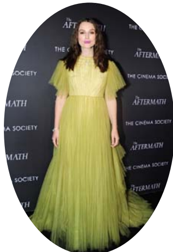
Enska leikkonan Keira Knightley á frumsýningu The Aftermath í efnismiklum, gulum kvöldkjól.