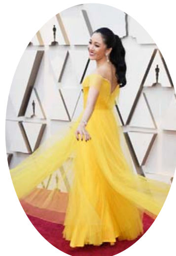
Constance Wu mætti í ævintýrlega gulum galakjól á Óskarsverðlaunin.