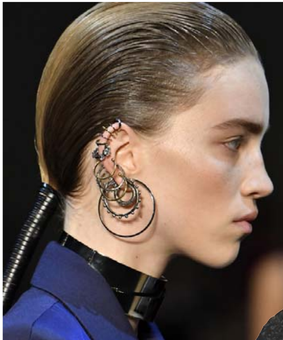
Þessi dama var ekki bara með einn eyrnalokk. Hún er með leðurband um hálsinn og um taglið er vafið leðurband.