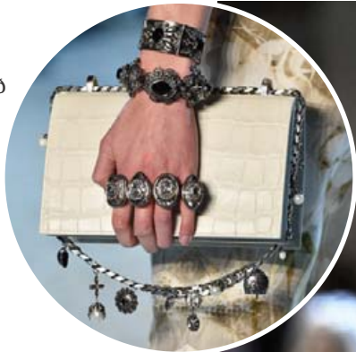
Stórir hringar og breið armbönd.

Sumum fannst sýningin svo mögnuð að þeir töluðu um dýrgrip, að Sarah hefði leitað aftur til Viktoriutímabilsins eftir innblæstri og náð þannig að tengja söguna við nýjustu tísku. Einnig má segja að fatnaðurinn og útlit fyrirsætanna hafi verið í gotneskum stíl.