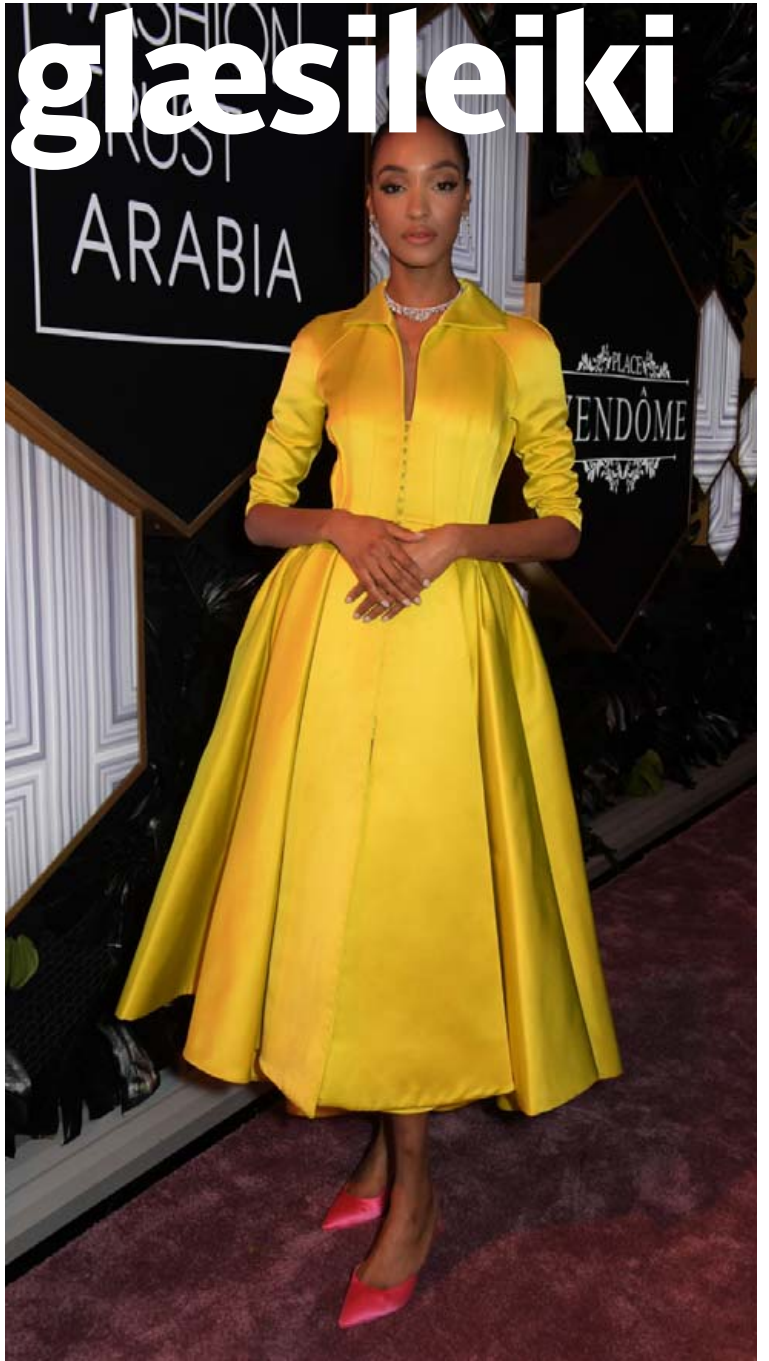
Enska ofurfyrirsetan Jourdan Dunn var íklædd kvenlegum gulum kjól í anda tisku rokkáranna á verðlaunahátíð Fashion Trust Arabia í mars.