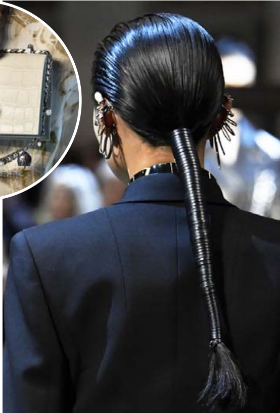
Magnað hvernig leðurbandið er vafið utan um taglið.