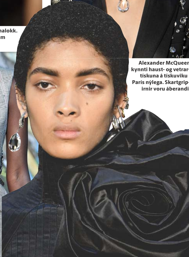
Talað var um að sumar fyrirsætarnar hefðu gotneskt yfirbragð.