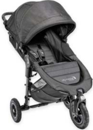
BABY JOGGER CITY MINI GT Baby Jogger City Mini GT - ársögmul litið notuð og vel með farin. Regnplast, flugnanet og Matar/glasa bakki. Tilboð óskast í allt. S. 663 3313