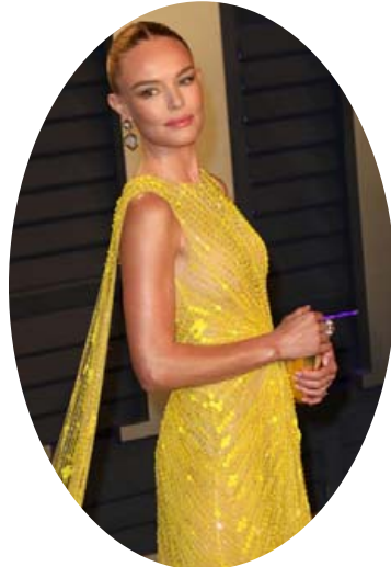
Kate Bosworth stal senunni í gulu skarti í Óskarspartii Vanity Fair.

Gulur er litur páskanna en líka einn af heitustu tískulitum vorsins. Því er ákaflega viðeigandi að skarta gulu á samfundum páska og njóta þess að lífga upp á tilveruna í lit sem skín eins og sólin. Hér má sjá hvernig margar af frægustu konum heims hafa klæðst gulum sparikjólum við lífsins tilefni undanfarið en allar eiga þær sameiginlegt að tolla vel í tískunni.