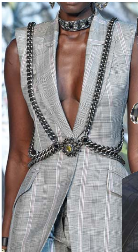
Stórt hálsmen og keðja yfir vestið.