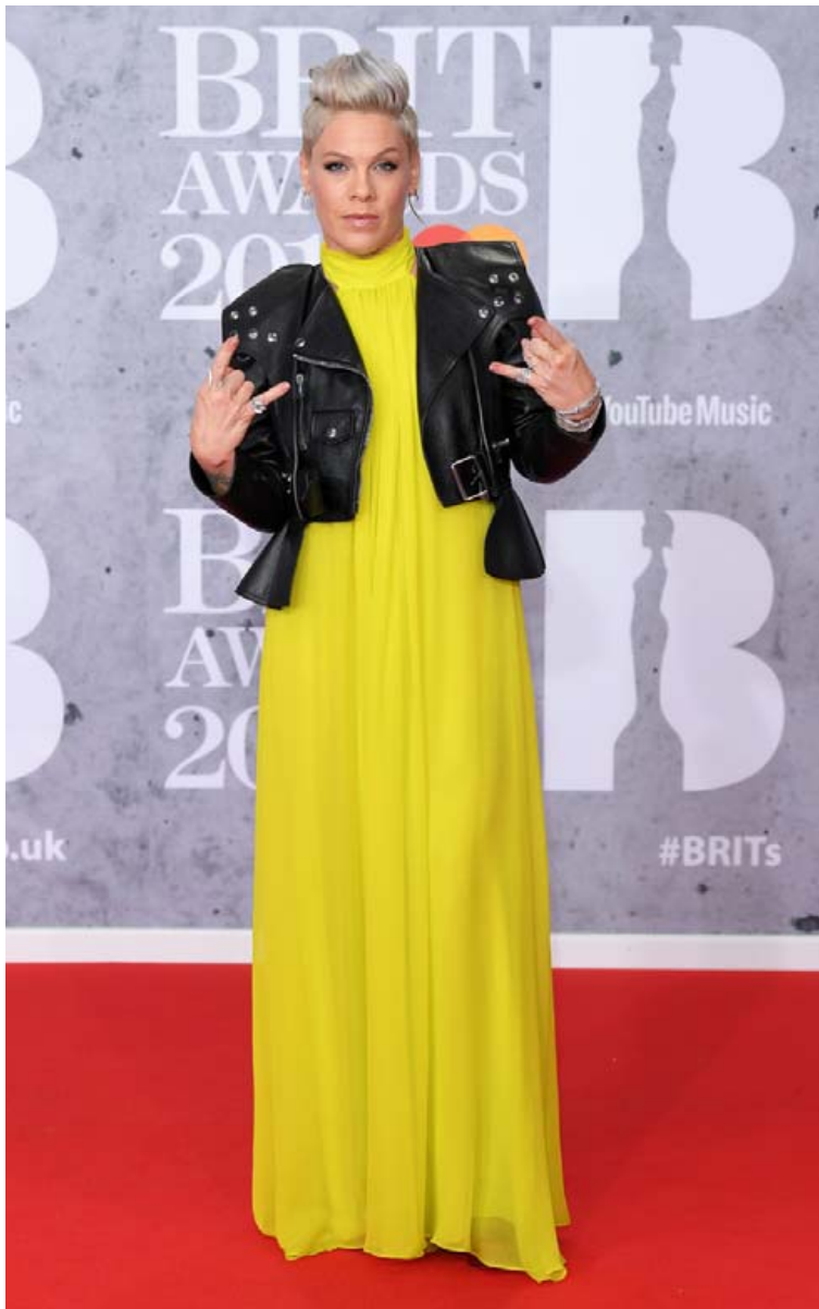
Söngkonan Pink var í gulum síðkjól á BRIT-verðlaununum í febrúar.