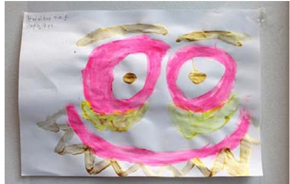
Myndirnar voru litfagar og fjölbreyttar.