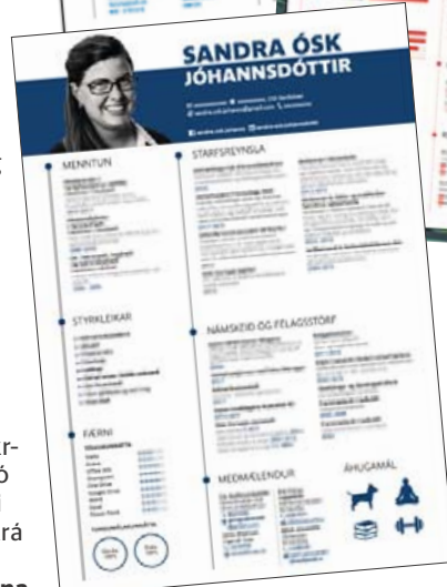
Ferilskrár sem Birgitta gerir skera sig svo sannarlega úr fjöðanum.

Fólk er kynningarblað sem býður auglýsendum að kynna vörur og þjónustu í formi viðtala og umfjallana. Í blaðinu er einnig hefðbundni ritstjórnarefni. Blaðið fylgir Fréttablaðinu daglega.