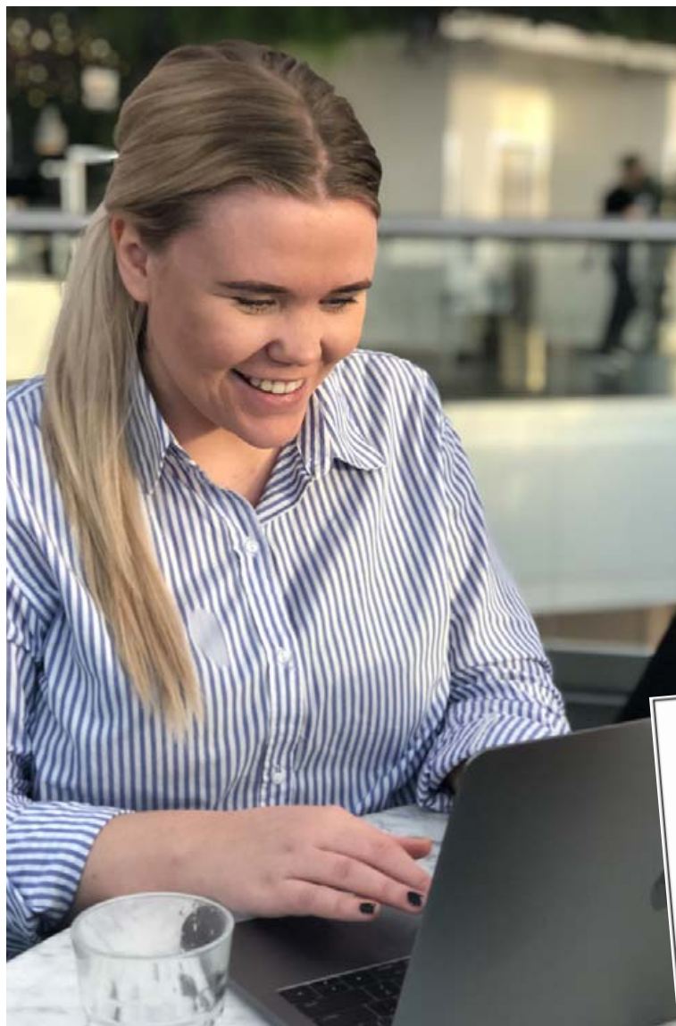
Ferilskrá sem sker sig úr í umsóknabankanum eykur líkur á að fá vinnuna.