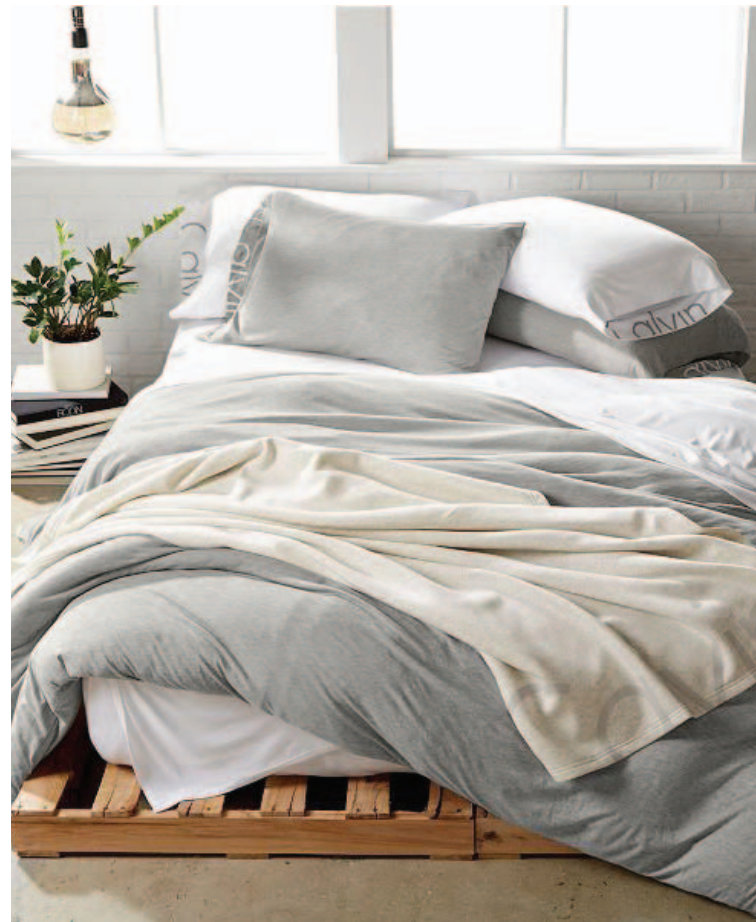
Kósi rúmföt frá Calvin Klein.

Nánari upplýsingar hjá Betra baki, Faxafeni 5 í Reykjavík, sími 588 8477. Betra bak er einnig á Akureyri og Ísafirði. Sjá nánar á betrabak.is.