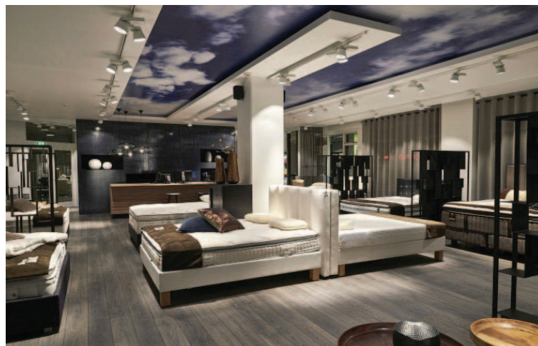
Það er fjölbreytt úrval rúma og dýna í Betra baki.

Sængurnar í Betra baki eru til í mörgum verðflokkum og mismunandi að gerð.