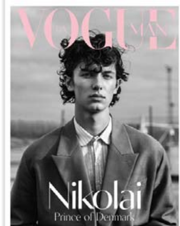
Nikolai prins er eftirsótt fyrirsaeta.

Þess má geta að rafskútur eru leigðar út í tólf borgum í Evrópu. Það er sænskt fyrirtæki, Voi, sem gerði samning við sveitarfélagið í Árósum um leigu á rafdrifnum hlaupahjólum.