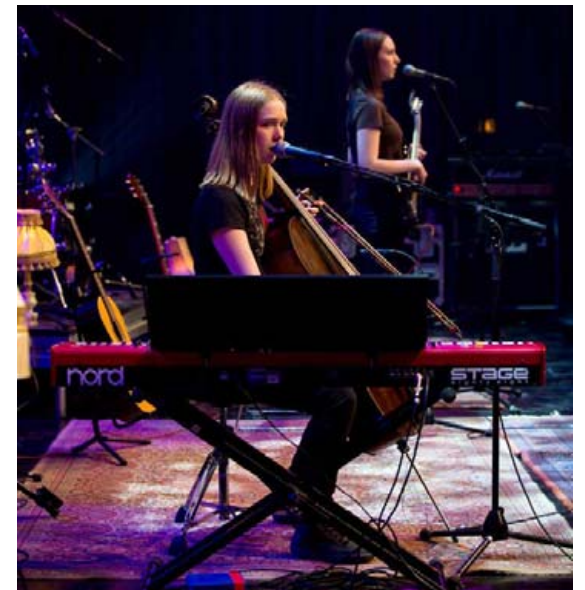
Sveitin hefur leikið víða undanfarið ár, m.a. á tónleikum á Loft hosteli í fyrra.