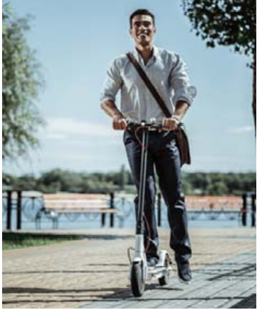
Rafskútur eru skemmtileg tæki.