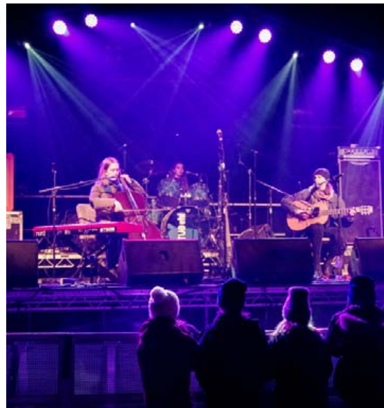
Ateria spilaði á tónlistarhátiðinni Aldrei fór ég suður, á ísafirði, um síðustu páska.