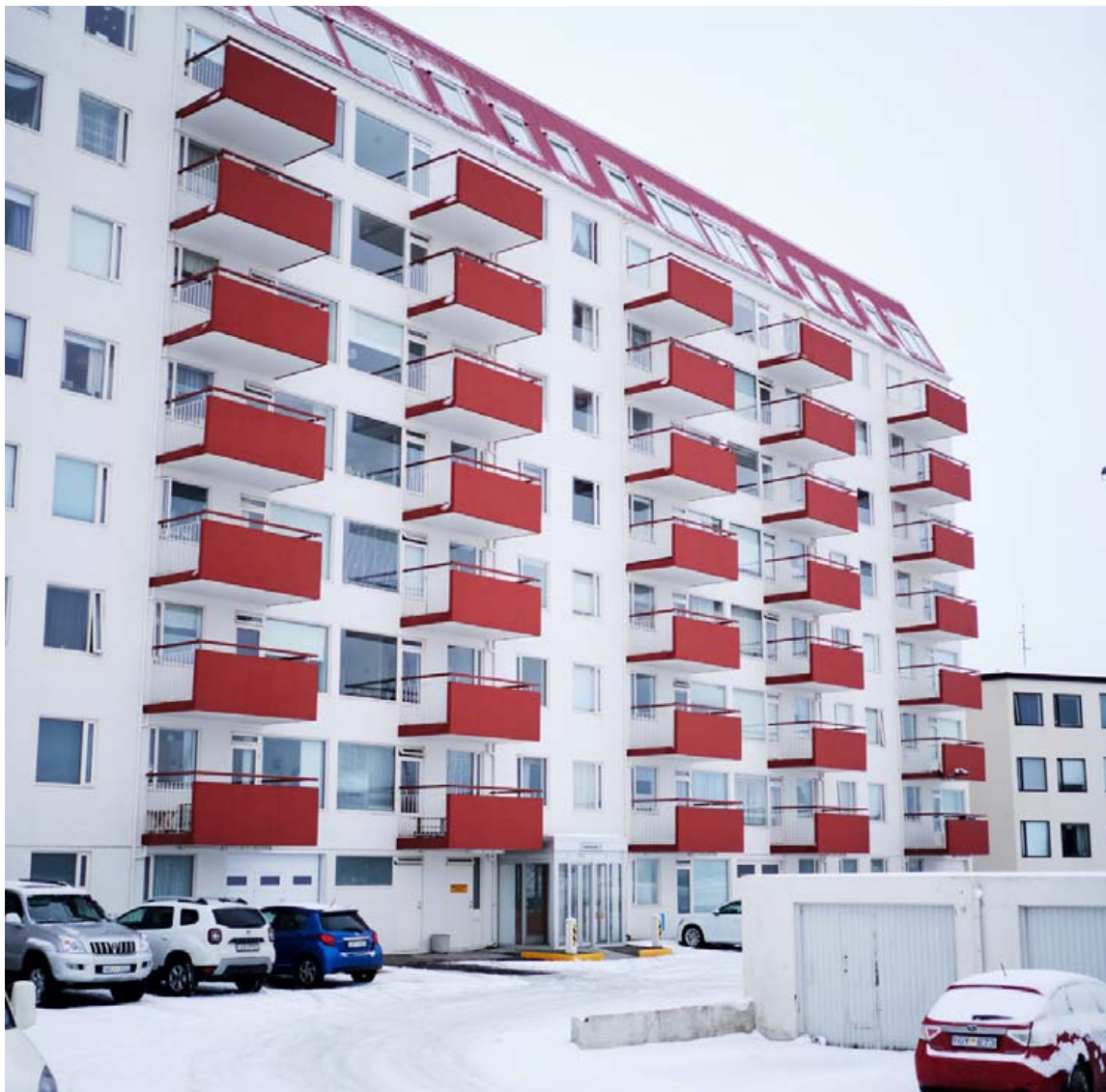
Um 110 íbúar búa í 64 íbúðum í Gaukshólum 2 í Efra-Breiðholti.