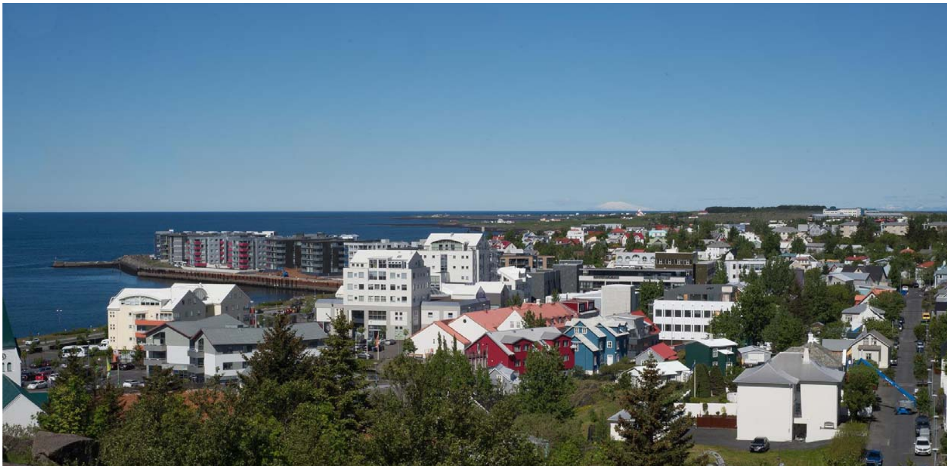
Rekstrarumsjón er hafnfirskt fjölskyldufyrirtæki en sinnir húsfélögum á landinu öllu.