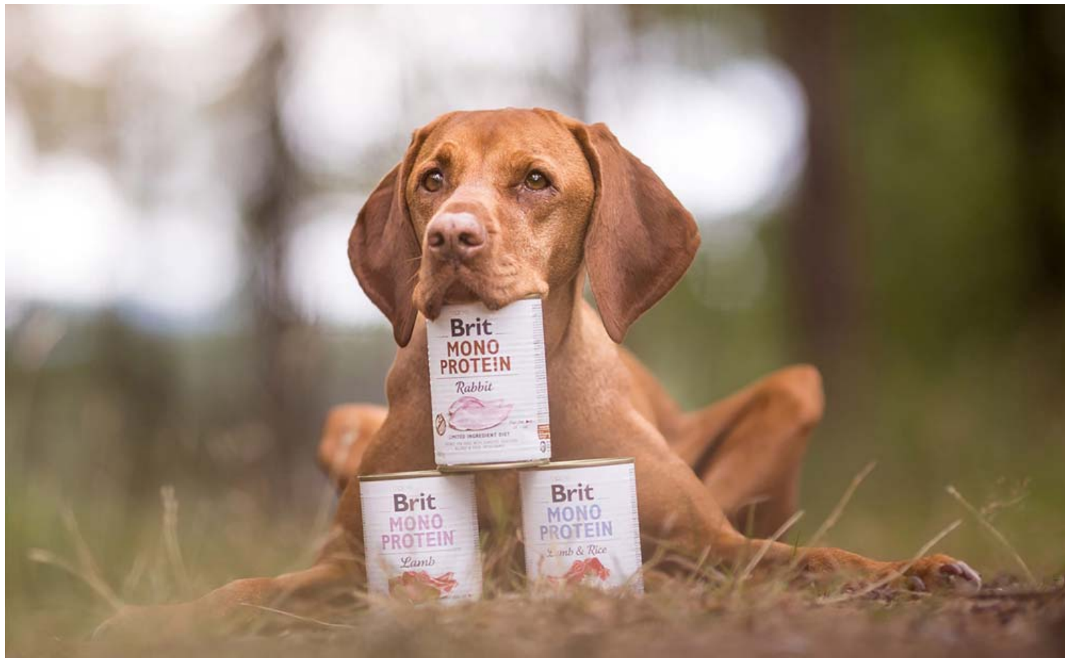
Undir Brit Care vörulínunni má finna fóður sem hentar öllum gæludýrum. Framleiðendur Brit eru framsæknir í vöruþróun og kynna sífellt nýjar vörur.

Brit Care Mini er sérhannað fóður fyrir smáhunda. Þetta er ný lína af