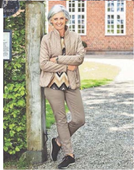
Jakki Áður 15.990 Nú 12.792 Stærðir 36-52