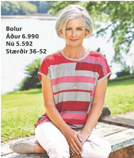
Bolur Áður 6.990 Nú 5.592 Stærðir 36-52