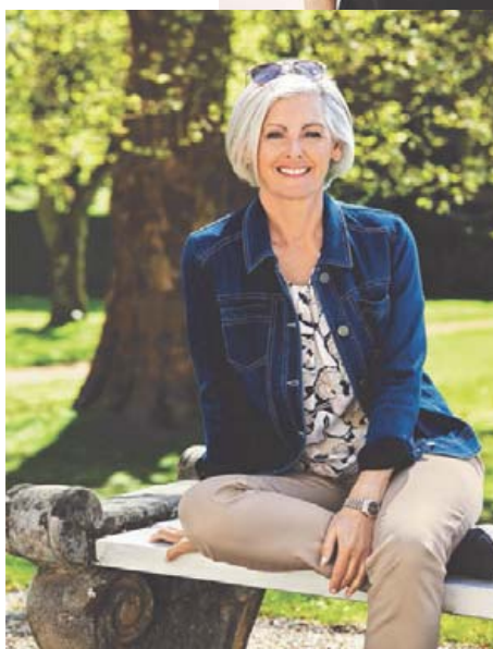
Gallajakki Áður 14.990 Nú 11.992 Stærðir 36-52