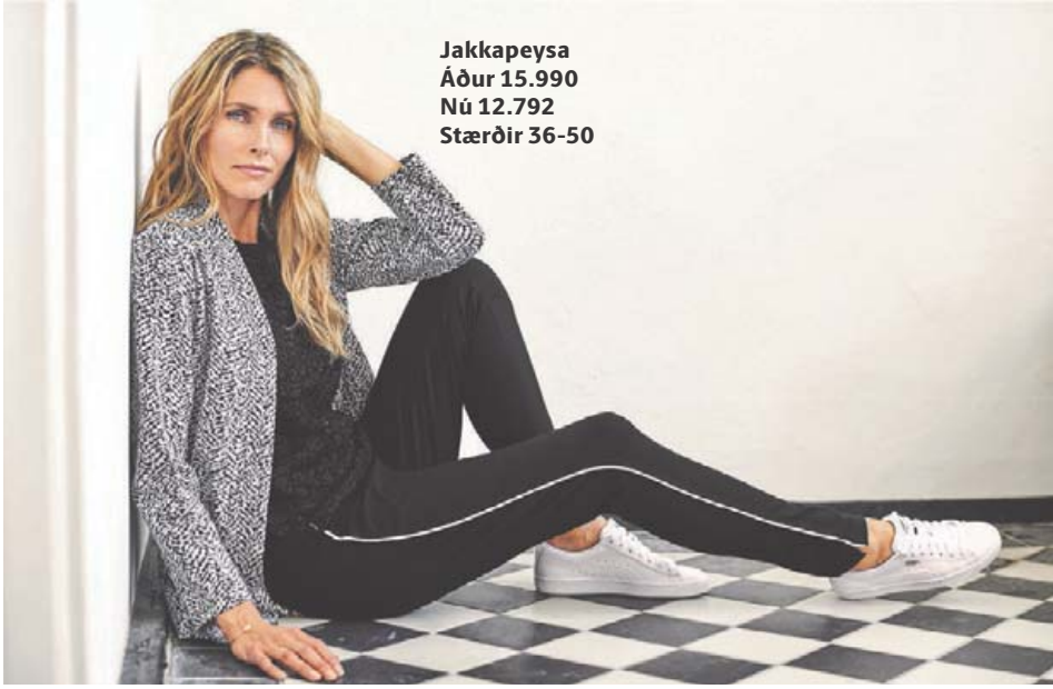
Jakkapeysa Áður 15.990 Nú 12.792 Stærðir 36-50