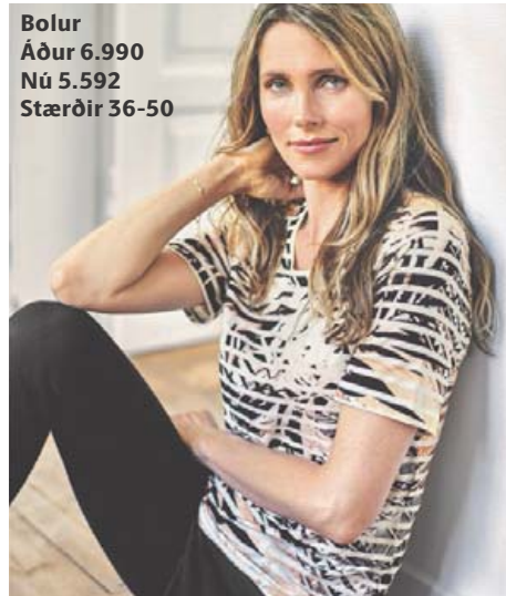
Bolur Áður 6.990 Nú 5.592 Stærðir 36-50