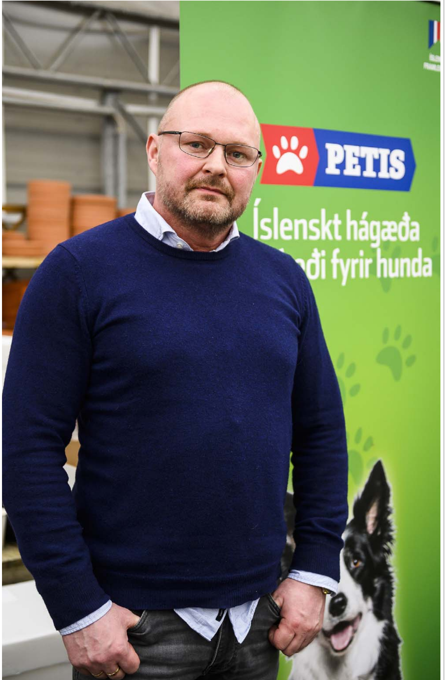
Steinar segir rétta fóðrun skipta máli fyrir alla hunda, en sérstaklega fyrir þá sem mikið mæðir á, eins og lögregluhunda.