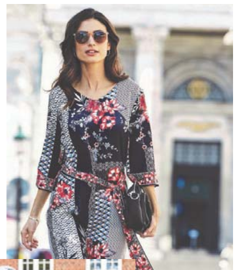
Kjöll Áður 13.990 Nú 11.192 Stærðir 36-52