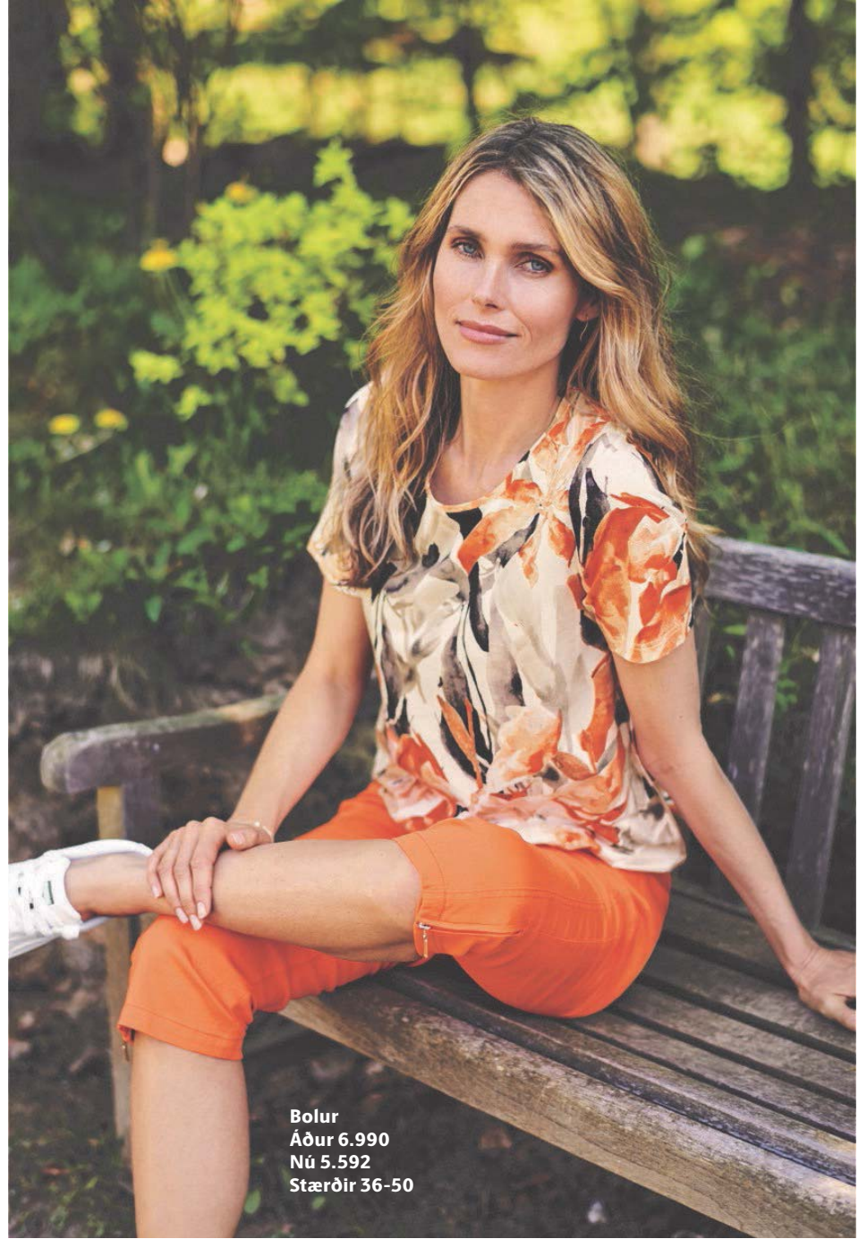
Bolur Áður 6.990 Nú 5.592 Stærðir 36-50