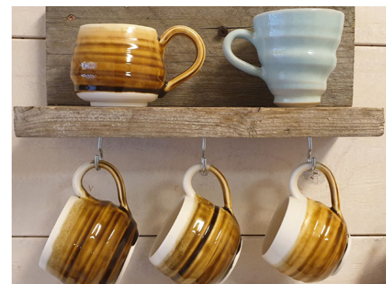
Frábærir bollar til að hengja upp eins og hvert annað veggskraut.