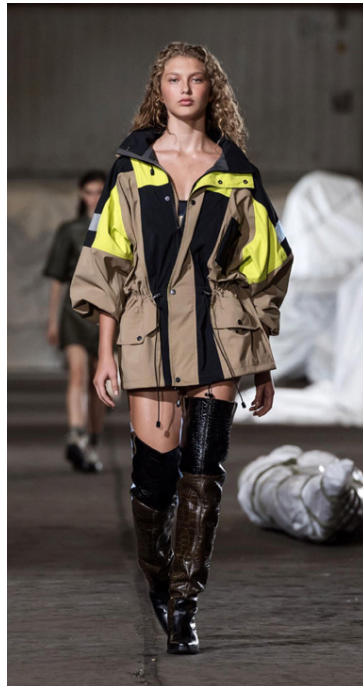
Nýja línun er glæsileg.