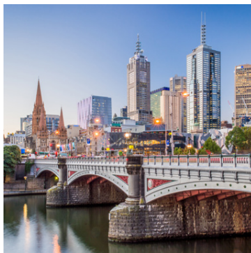
Melbourne í Ástralíu er í öðru sæti listans. Gróskumikil og skemmtileg.

búum sig hamingjusama og einungis sex prósent fundu fyrir óöryggi síðustu 24 tímuna. Borgin býður upp á fjölbreytni og umhverfið er skapandi.