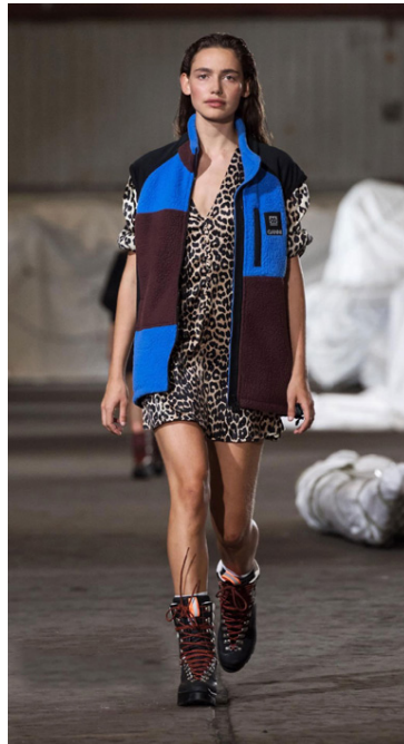
Módel sýnir flisvesti.