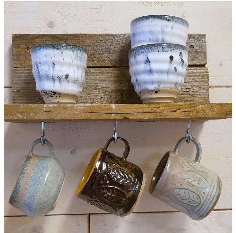
Bollar eru eins og manneskur, segja listakonurnar sem eru með sýninguna á Írskum dögum.