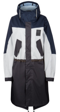
Stundum þarf að klæða sig vel.

„Eftir vel heppnað samstarf fyrirtækjanna við sumarlínuna sem er nú að koma í verslanir var eðlilegt framhald að hanna vetrarlínu og gera það með alveg nýrri nálgun“