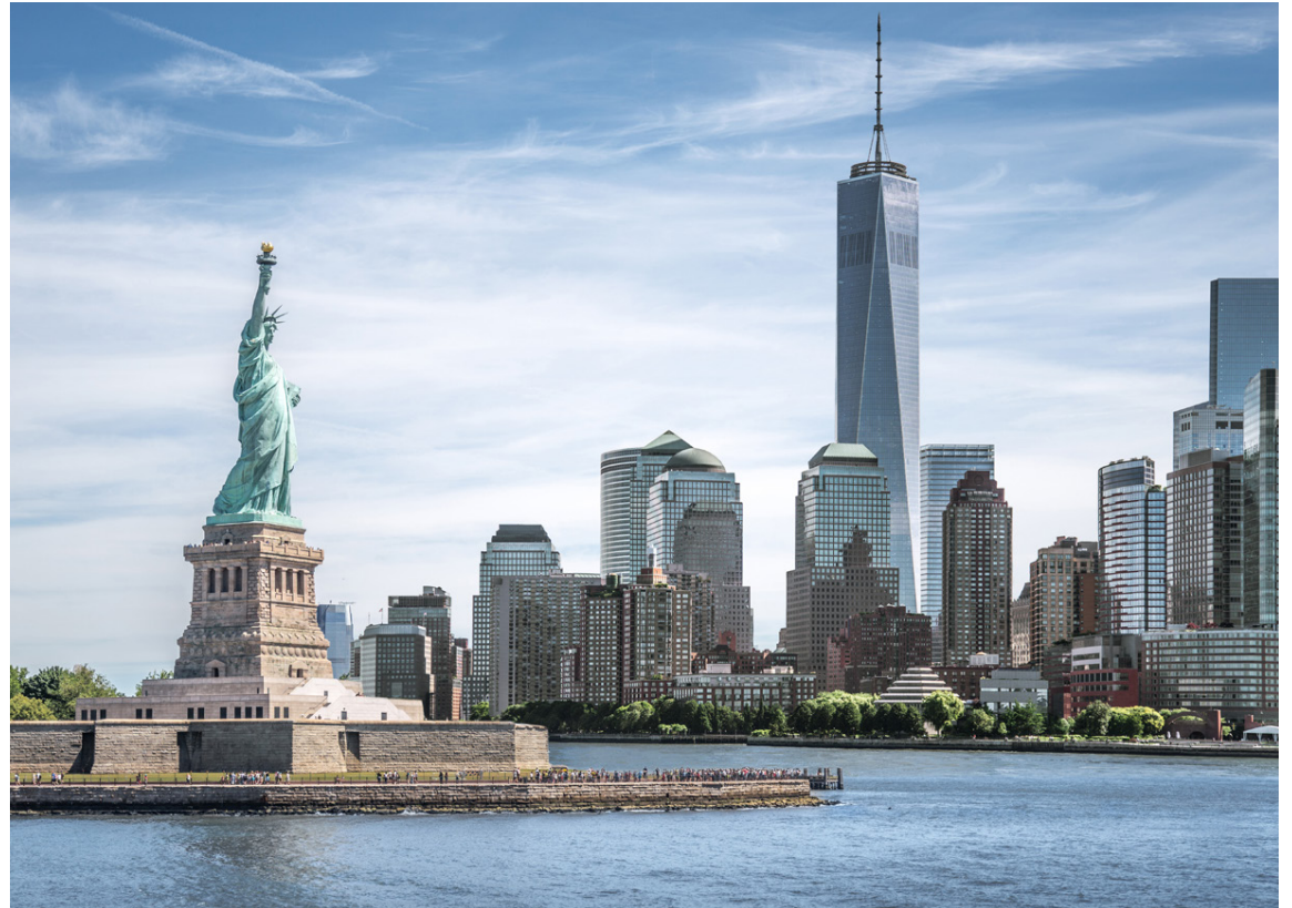
Það er gott að búa í New York, samkvæmt könnun. Menningin og fjölbreytnin er stórkostleg.

Þrátt fyrir Brexit og pólitískan óróa töldu átta af tíu Lundúna-