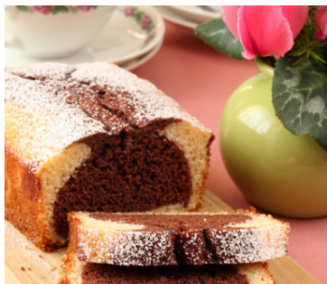
Nýbökuð marmarökaka er ljúffeng.