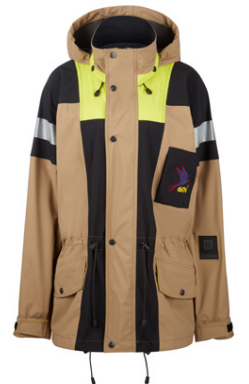
Hljór og töff jakki.