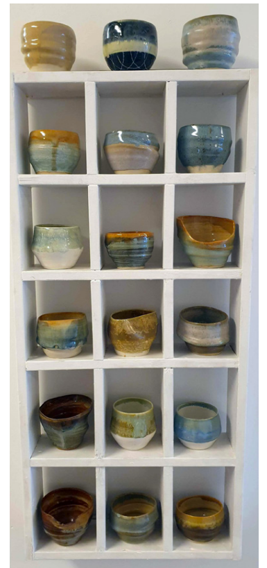
Sýningin á bollunum stendur til 30. mars.