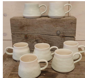
Bollarnir eru misjafnir að lit og lögun.