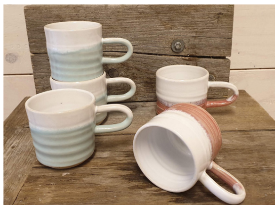
Hvernig ætli sé að spá í þessa bolla? Kannski viljið þið prófa.