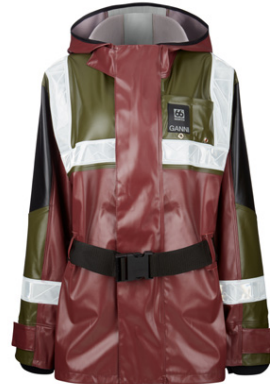
Það gæri rignt í sumar.