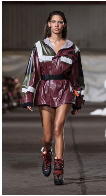
Efnin eru mjög tæknileg.