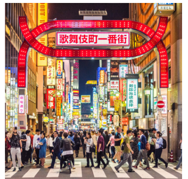
Tókýó er sú borg í Asíu sem mesta athygli vekur um þessar mundir.