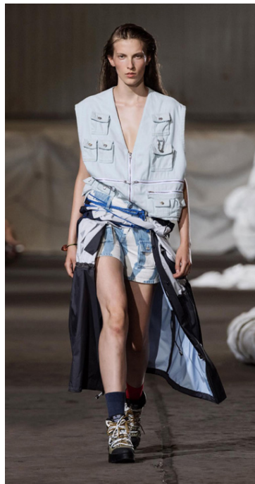
Sumarið er handan við hornið.