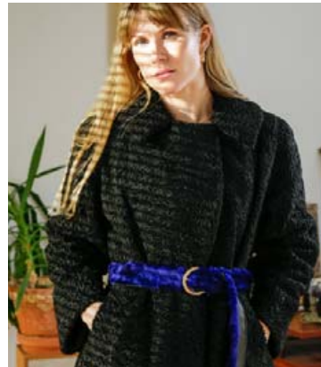
Gamall pels með nýju belti.

„Mig langaði til að gefa þessum gömlu virðulegu pelsum endurkomu í sviðsljósið.“