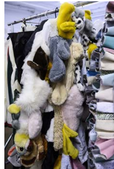
Efniviður úr fatasöfnun RKÍ gefur hugmyndafluginu lausan tauminn.