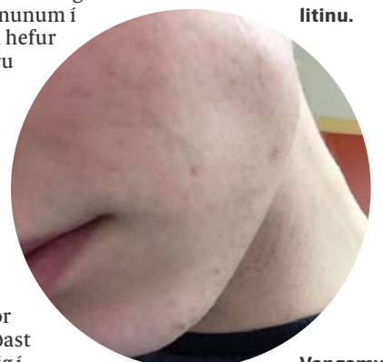
Vangamyndir áður en notkun á Tamarar hófst.