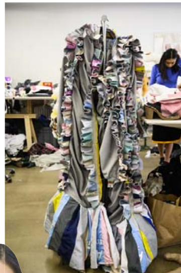
Glæstur og einstakur síðkjóll.