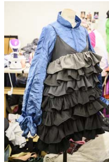
Pifutoppur í mörgum grátónum.