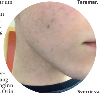
Sverrir var með ljót ör eftir bólur í andlitinu.