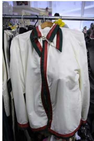
Glæsileg endurunnin skyrtu með svörtum og rauðum borðum.

„Það er mikilvægt að fatahönnuðir framtíðar og nútíðar horfist í augu við raunveruleikann í souninni, leiki sér með efniviðinn og vekji athygli á því góða starfi sem Fatasöfnun Rauða krossins er. Þeir