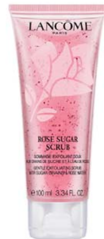
EXFOLIATING ROSE SUGAR SCRUB

Nýr þéttandi og lyftandi maski í Rénergie línunni. Maskinn nærir og gefur húðinni raka samstundis með býflugna- og Carnuba vaxi. Maskinn er borinn á andlit og háls á kvöldin og látinn vera á yfir nóttina. Nótt eftir nótt verður húðin fylltari, þéttari og finar línur og hrukkur virðast minni og útlit húðarinnar fallegra. Þú bæði séð og finnur árangurinn.