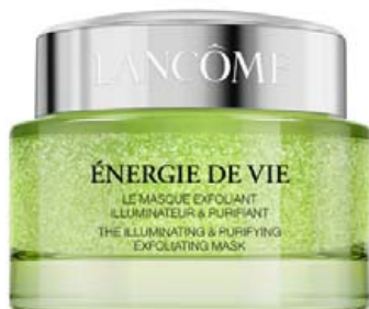
ENERGIE DE VIE ILLUMINATING & PURIFYING EXFOLIATING MASK

Nýjasta trendið. Við viljum ekki bíða með að árangur komi í ljós: Þú hefur maskann á í 10, 20 eða 30 mín og hann gefur samstundis ljóma, fyllingu og mýkt. Maskinn inniheldur góðgerlaþrennu og sama magn af Bifidus Extracti og er í einu glasi af Génifique Serum 30 ml.