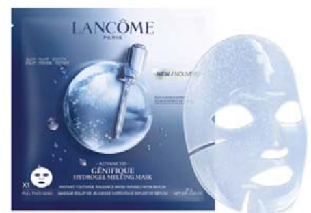
GÉNIFIQUE HYDROGEL MELTING MASK

Það besta frá Lancôme. Maski með dýrmætu rósaseyði og rósavatni sem dekrar við andlitið, róar, rakafyllir og endurheimtir ljóma, mýkt og frískleika húðarinnar á aðeins 10 mínútum. Má nota daglega.