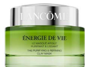
ENERGIE DE VIE PURIFYING & REFINING CLAY MASK

Næturmaski sem rakafyllir og þéttir húðina sem verður fersk og sjáanlega jafnari. Hann kælir húðina og undirbýr hana fyrir nóttina. Notist á hverju kvöldi sem næturkrem eða 2 – 3 í viku í 10 mín. sem orkugefandi maski sem vinnur á þreytumerkjum.