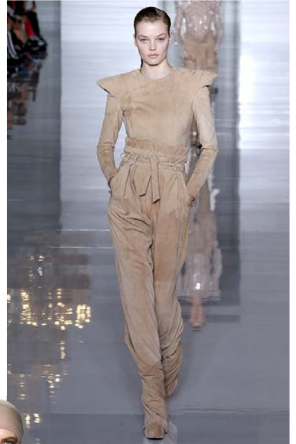
Balmain í París.