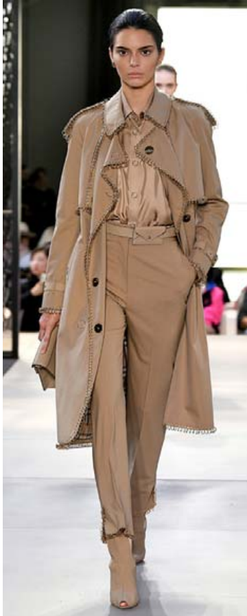
Fyrirsætan fræga Kendall Jenner á tiskusýningu fyrir Burberry.