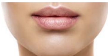
Heilbrigðar varir eru til þróði.

Sumir vildu meira að segja meina að hertogaynjan væri að senda dulín skilaboð og fylukjóllinn væri alls engin tilviljun. Hún væri augljóslega að senda skilaboð til Meghan, svilkonu sinnar, en innanbúðarmenn innan konungsfjölskyldunnar segja ansi stirt á milli þeirra. Hvort sem það er rétt eða ekki var Katrín hin glæsilegasta og sló í gegn meðal barnanna.