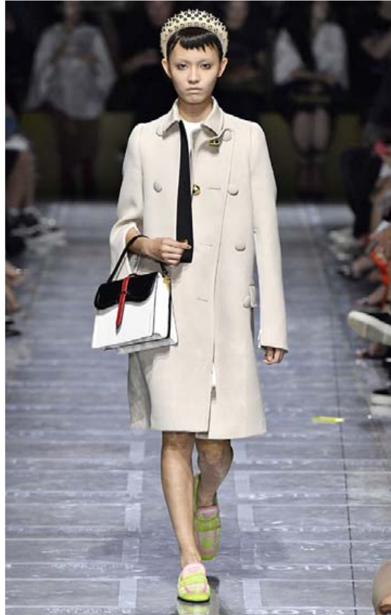
Af tiskusýningu Prada í Milanó.