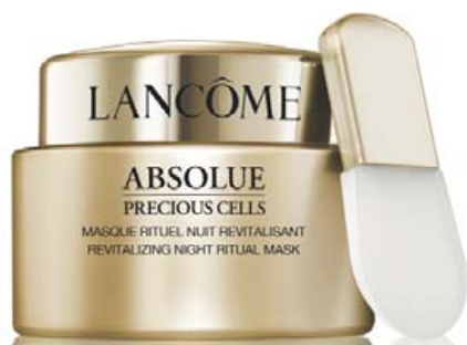
ABSOLUE PRECIOUS CELLS REVITALIZING NIGHT RITUAL MASK

Maskinn bráðnar á húðinni og myndar létt hitatilfinningu um leið og hann losar um dauðar húðfrumur. Berið á hreina raka húð og nuddið í 1 mín. Hreinsið þá af með vatni. Notist 2-3 í viku. Hentar öllum húðgerðum, líka viðkvæmum.