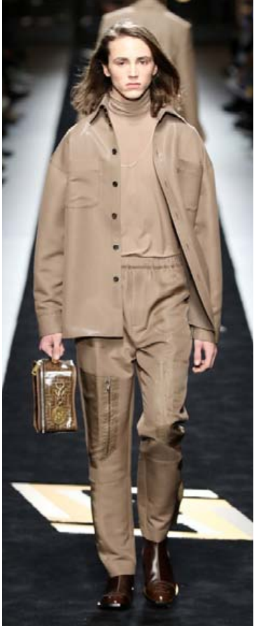
Liturinn var áberandi á herratísku-sýningu Fendi í Milanó í janúar.