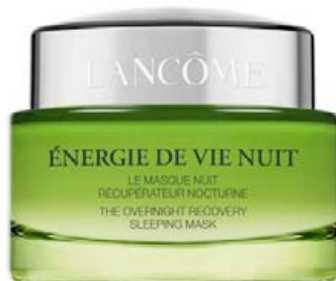
ENERGIE DE VIE ANTIOXIDANT OVERNIGHT RECOVERY SLEEPING MASK

Þessi 2-í-1 raka- og kornamaski hentar mjög vel til að losa um dauðar húðfrumur liflausrar húðar svo fersk ljómandi húðin fái að njóta sín og húðholur verði minna sjáanlegar. Notist 2 í viku í 3 mín.