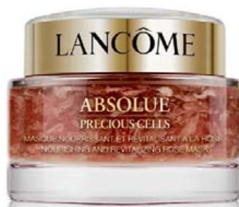
ABSOLUE PRECIOUS CELLS NOURISHING AND REVITALIZING ROSE MASK

Næturmaski sem dekrar við húðina meðan þú sefur. Húðin verður fersk, rakafyllt og þétt að morgni og betur varin gegn áreiti dagsins. Við mælum með notkun þessa lúxusmaska 2 kvöld í viku.