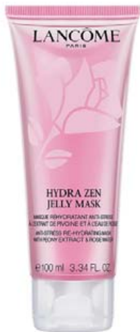
ROSE JELLY MASK

ÞVÍ EKKI AÐ DEKRA VIÐ SJÁLFA SIG EÐA EINHVERJA SEM ER ÞÉR KÆR? HJÁ LANCÔME FINNUR ÞÚ ÚRVAL LÚXUSMASKA SEM DEKRA VIÐ ÞIG DAG OG NÓTT.