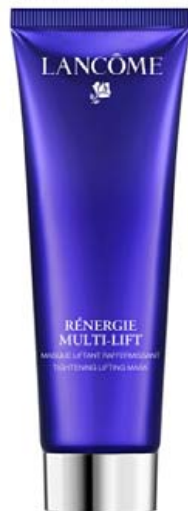
NÝTT - RÉNERGIE MULTI-LIFT TIGHTENING LIFTING MASK

Maskinn rakanærir og róar húðina. Inniheldur meðal annars hunang, rósavatn og hyaluronic sýru. Berið ríkulega á hreina þurra húð og látið vera á yfir nótt. Hentar þurri og viðkvæmri húð.