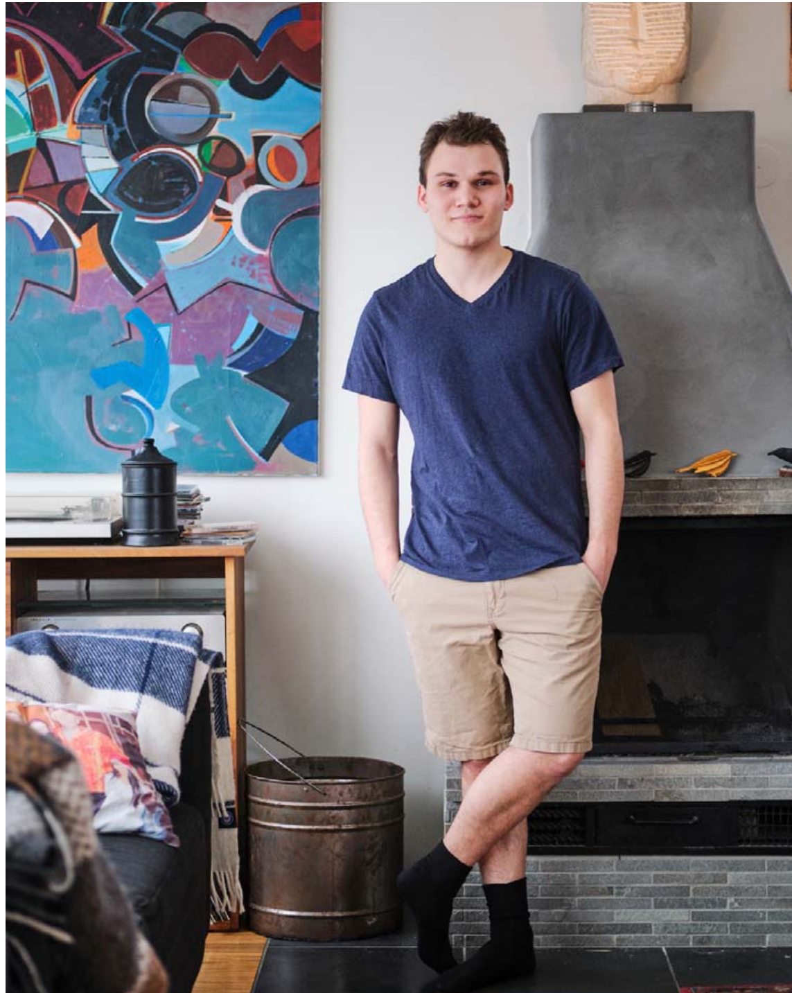
Hér er Hrafn í ljósbrúnu stuttbuxunum sem eru í miklu uppáhaldi. Blái bolurinn er frá J.Crew.