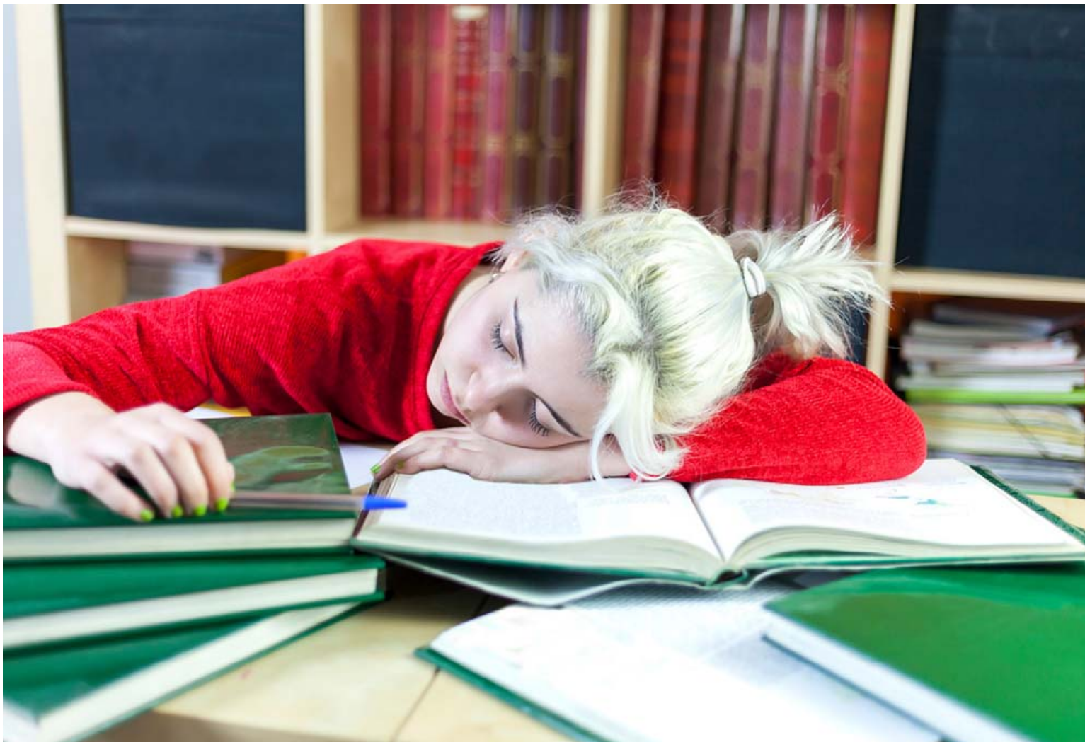
Bannað er að selja börnum undir 18 ára sterkustu orkudrykkina á markaði, en þeir fást margir hverjir í næstu matvöruverslun.

Það sem er ólíkt með koffíndrykkjum og kaffi er að það er mun auðveldara að innbyrða mikið magn af orkudrykkjum á stuttum tíma en kaffi. „Kaffi er heitt og rammt en orkudrykkir kaldir og svalandi. Fæstir drekka þrjá heita kaffibolla í einum rykk og þeir sem leggja það á sig vita að það skilar sér fljótt í magaónotum. Það er aftur á móti alls ekki óhugsandi að drekka litra af orkudrykkjum