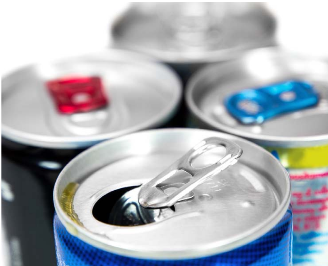
Þórhallur segir nýmæli að halda þurfi vörum sem geti flokkast sem matvæli og fáist úti í búð frá börnum.

Samkvæmt reglugerð má koffínmagn í orkudrykkjum á Íslandi ekki fara yfir 320 mg/l. Ef ætlunin er að framleiða, markaðssetja eða flytja inn orkudrykki þar sem heildarmagnid er meira þarf sérstakt leyfi frá Matvælastofnun. Þá er skylt að merkja orkudrykki sem innihalda 150 mg/l af koffíni eða meira með orðunum: „Inniheldur mikið af koffíni. Ekki æskilegt fyrir börn eða barnshafandi konur eða