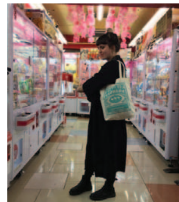
Í japanskri verslun en þær eru sumar óvenjulegar.