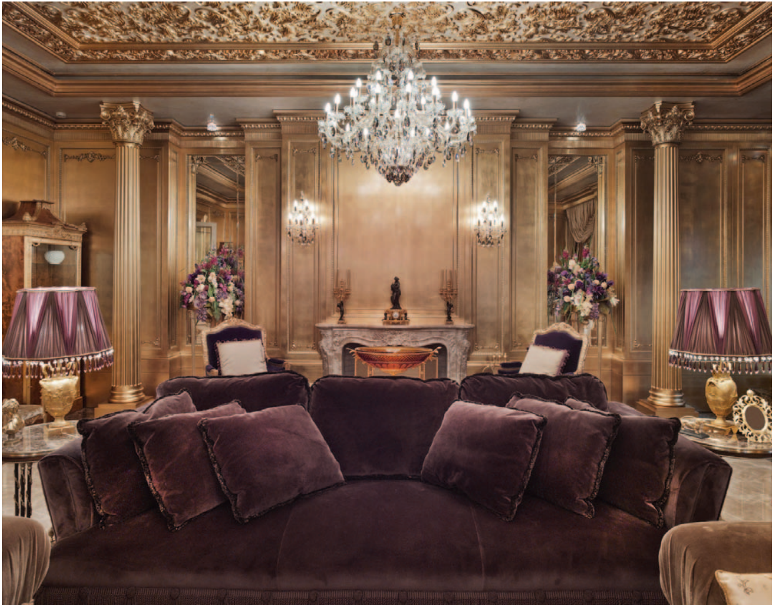
Kannski aðeins farið yfir strikið en þó má sjá margt sem verður vinsælt á árinu: Flauelshúsgögn, sterka liti, málmáferð og samstæða borðlampa.

Dökkir og gljáandi baðherbergisveggir og gólf vekja hughrif um dýrar heilsulindir og munað.