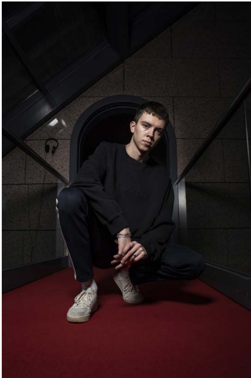
Skórnir eru frá New Balance, buxurnar frá Burberry og peysan er frá J.W. Anderson.

Ég kaup langmest af fötunum mínum erlendis, bæði gegnum netið og þegar ég ferðast. Úrvalið hérlandis hefur þó aukist talsvert undanfarin ár og eru margar fatabúðir farnar að taka meiri áhættu í innkaupum. Ég er a.m.k. farið að sjá meira úrval af fötum hér á landi sem höfða til mín.