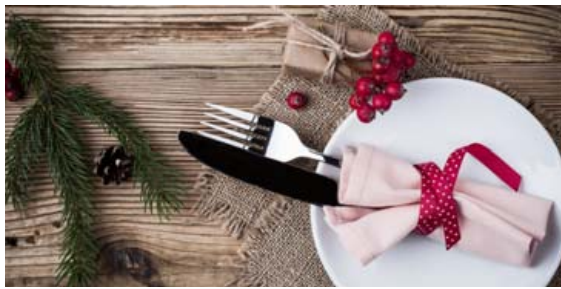
Jólin eru örðin sannkölluð matarhátíð.