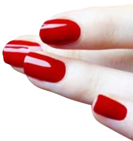
Rautt naglalakk verður vinsælt í vetur.

Það mun vera leyfilegt að setja krullur í þessa greiðslu til að breyta til. Bob þykir klæða flestar konur og þess vegna verður greiðslan vinsæl aftur og aftur. Fyrir þær sem vilja skipta um háralit koma rauðir litir sterkir inn í haust, ljósir litir með dekkri stripum og djúpir brúnir litir. Þá mun alls konar hárskraut einnig verða vinsælt í vetur.