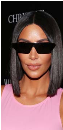
Kim Kardashian er leiðandi í tisku, jafnt í fatnaði sem hárgreiðslu.