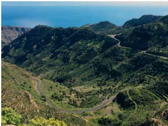
Hluti af hjólaleiðinni sem hópurinn fór á La Gomera eyju.

Dvölin á Tenerife var afar eftirminnileg að hennar sögn. „Í annarri hjólaferðinni okkar hjóluðum við