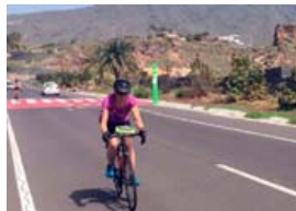
Á heimleið úr hjólaferð á Tenerife.