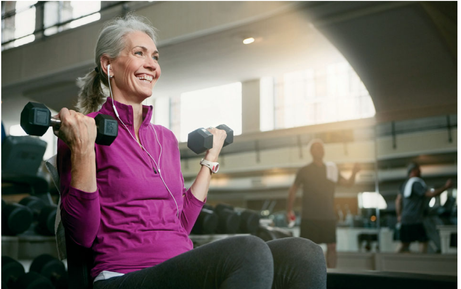
Æfingar með lóð eru ein tegund mótstöðuþjálfunar sem getur dregið úr einkennum þunglyndis.

Þar sem rannsóknin var alfarið byggð á niðurstöðum fyrri rannsókna var samt ekki hægt að svara því hvers vegna mótstöðuþjálfun hefur jákvæð áhrif né sýna orsakasambandið.