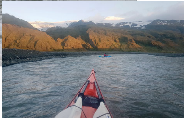
Róið niður eftir Markarfljóti en fyrsti leggurinn var um 30 km.