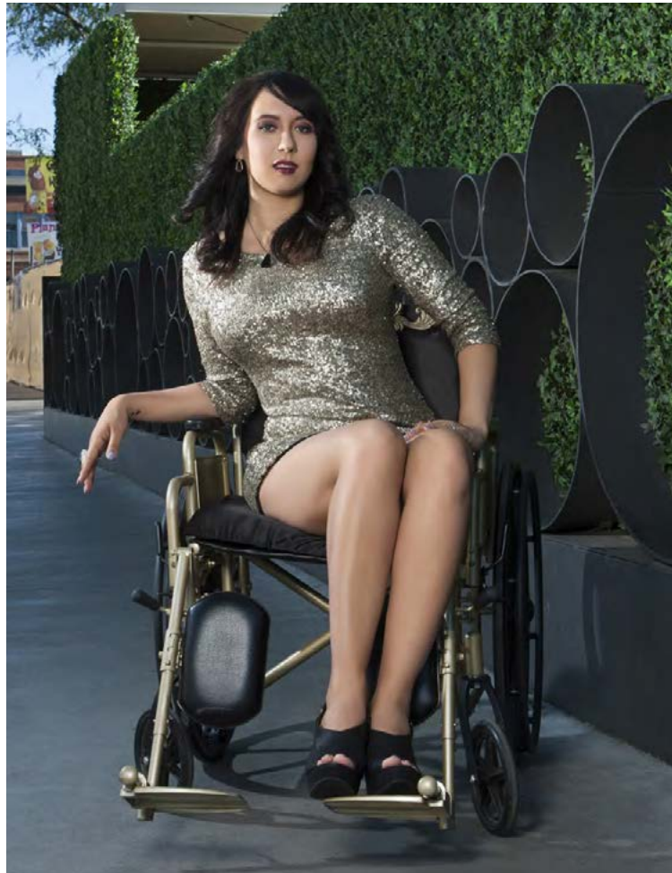
Sýningin er í Tjarnarbiói þar sem er aðgengi fyrir hjólastóla.

„Fólk lítur á þá sem eiga við fötlun að stríða sem annaðhvort engla í pislavætti eða hjálparvana. Í báðum tilfellum veldur hugmyndin um fatlaða sem kynverur óþægindum,“ segir hún. „Þessar hugmyndir verða annaðhvort til þess að fólk gerir óraunhæfar kröfur til fatlaðra eða kemur fram við þá eins og börn. Það er afar mikilvægt að sjá fólk með fötlun eins og allt annað fólk, meðal annars þegar kemur að