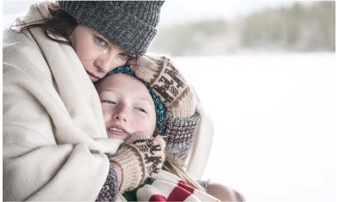
Áföll geta birst í margvíslegum myndum. Skilnaður, ástvinamissir, atvinnumissir, gjaldþrot eða andlegt og líkamlegt ofbeldi eru meðal þekktari áfalla en einnig langvinn veikindi, slys og vanvirkar heimilisaðstæður.

verða í raun til eðlileg viðbrögð við óeðlilegum aðstæðum. Viðbrögðin geta verið sterk, bæði tilfinningalega og líkamlega. Við aðlögunst engu að síður þeim aðstæðum sem okkur mæta. Það er eðlilegt að hafa sterk tilfinningaleg eða líkamleg viðbrögð í kjölfar óþægilegra atburða. Í flestum tilfellum minnka þessi viðbrögð með náttúrulegu bataferli líkamans en oft getur erfið reynsla haft veruleg og langvarandi áhrif á samskipti og virkni í fjölskyldum, við maka, vini eða samstarfsfélaga,“ bendir Hafðis á.