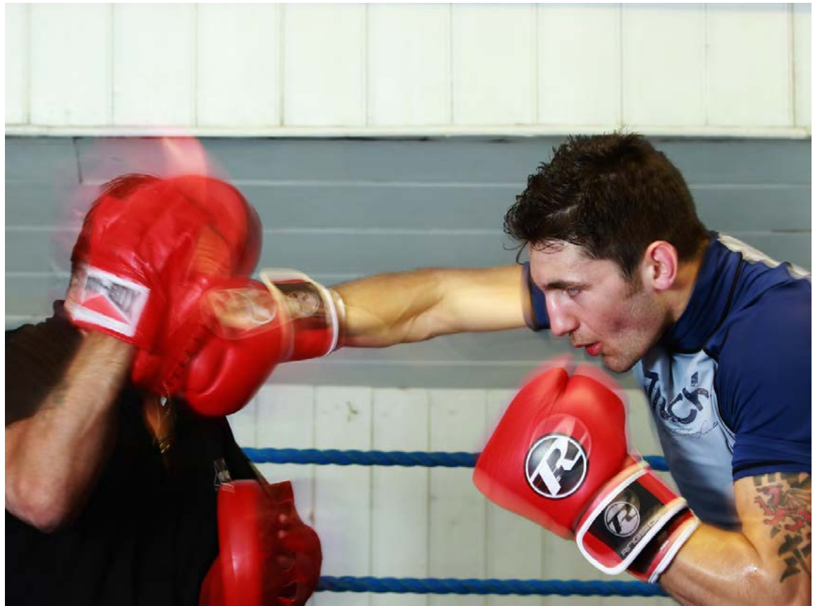
Hnefaleikar eru mjög hollir fyrir líkama og sál.

Þegar maður stundar hnefaleika lærir maður ýmislegt um sjálfan sig. Maður áttar sig til dæmis