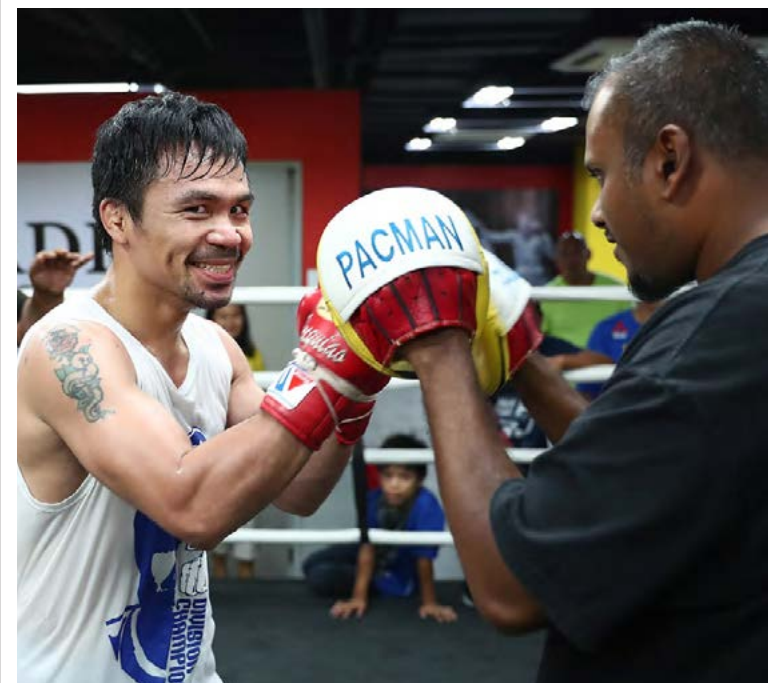
Hinum heimsfræga boxara Manny Pacquiao leiðist ekki í vinnunni.

Hnefaleikar geta líka verið góð útrás fyrir reiði eða árásgirni. Þegar maður er nýbúinn að refsboxpúðanum svo svakalega að maður getur varla staðið í lappirnar er lítil spennan eftir í líkamanum og maður hefur mun minni áhuga á að vera reiður. Hnefaleikar geta þannig verið góð leið til að fá útrás fyrir neikvæðar tilfinningar á uppbyggilegan máta, án þess að skaða sig eða aðra.