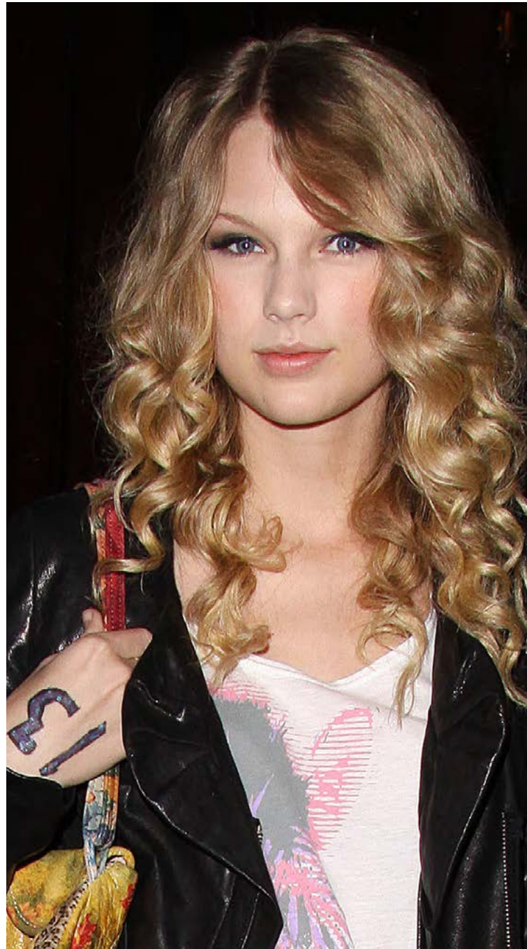
Söngkonan Taylor Swift varð þrettán ára föstudaginn þrettánda og ber töluna þrettán við ýmis tækifæri.

happa enda eru tólf mánuðir í ári, sólarhringur er tvisvar tólf, stjörnumerkin eru tólf og lærisveinarnir voru tólf svo dæmi séu tekin. Mörg hótél sleppa númerinu þrettán og hafa tólfu hæð og svo fjórtánda strax á eftir. Föstudagar eru líka taldir óheppilegir í ýmsu