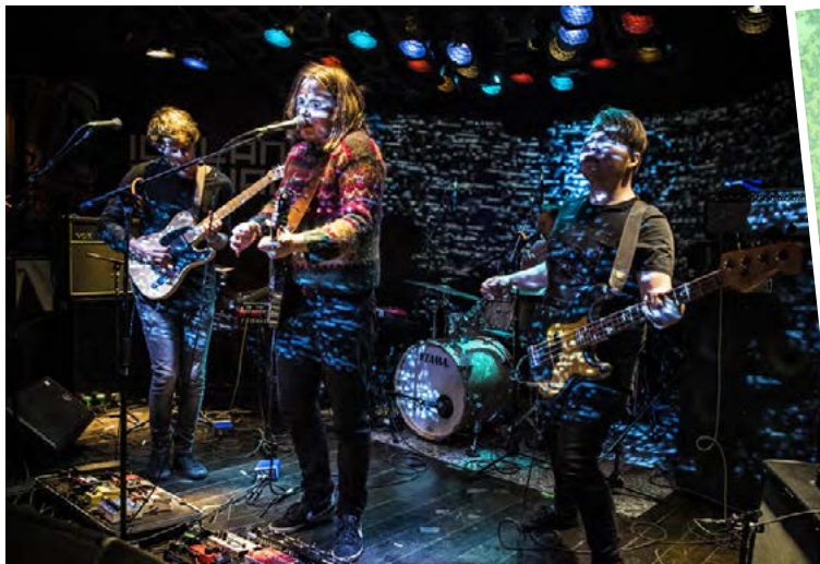
Rythmatik kom fram á Iceland Airwaves 2017 og spilar aftur í ár.

gera hluti rétt og ekki flýta okkur að gefa plötuna út. Okkur bauðst góður samningur og féllumst á að skrifa undir hann gegn því að við fengjum nægan tíma til að vinna í henni. Markmiðið var að senda frá okkur plötu sem við gætum verið virkilega stoltir af og fengum heilan helling af fagfólki til að hjálpa okkur við verkið. Þar má