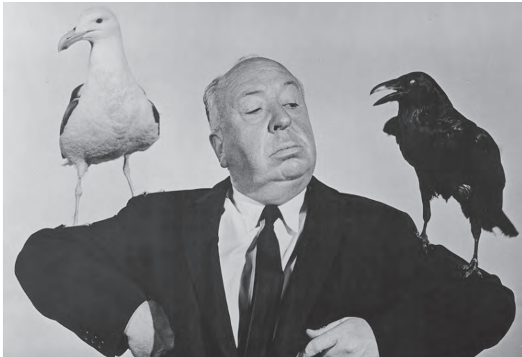
Alfred Hitchcock fæddist föstudaginn 13. ágúst 1899 og lagði sig fram um að skapa ótta og skelfingu með list sinni.

M argir óttast töluna þrettán svo mjög að til er orð yfir þá fælni, dekatríafóbía. Þetta er ekki skrýtið þar sem talan þrettán hefur gegnum tíðina verið tengd óheppni. Hún er oddatala, og brýtur upp hina gullfallega rúnnuðu tölu tólf sem er til allra