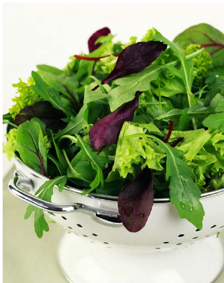
Það er skemmtilegt að rækta sitt eigið salat.