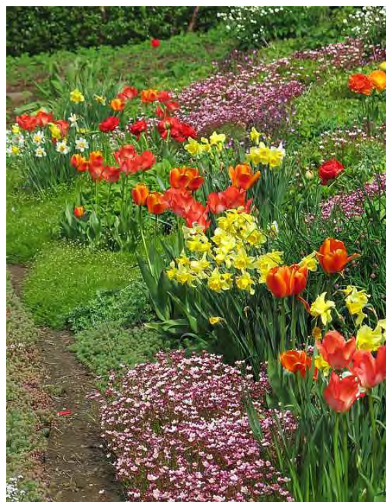
Fallegur garður er mikið augnauki.

FRÉTTABLAÐIÐ mest lesna dagblað landsins.