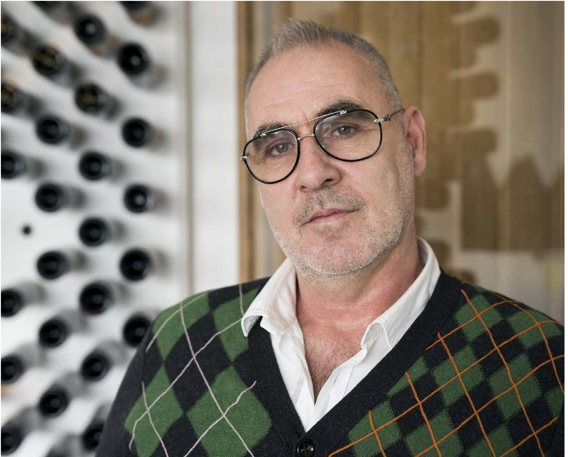
Bak við Svein má sjá listaverk úr flöskum og dósum en endurvinnsla og vistvænt heimili eru í forgrunni á umhverfishátíð í Norræna húsinu um helgina.