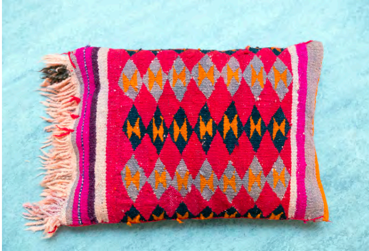
Púðarnir eru handofnir.