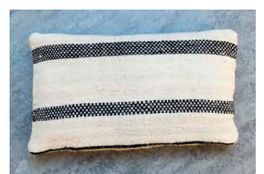
Bedúinateppi hafa fengið nýtt hlutverk í púðunum.

Í Jórdaníu eru einnig gerðir stólar sem Peter hannaði árið 1990. „Stólarnir voru útskriftarverkefni hans úr arkitektaskólanum í Kaupmannahöfn og hafa alltaf vakið mikla athygli. Við ákváðum að