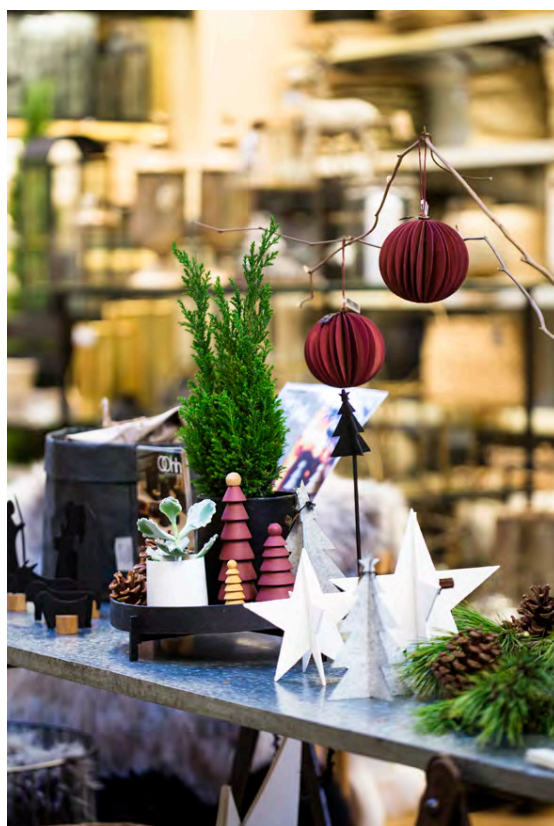
Jólaskreytingar í nýjstu litunum.