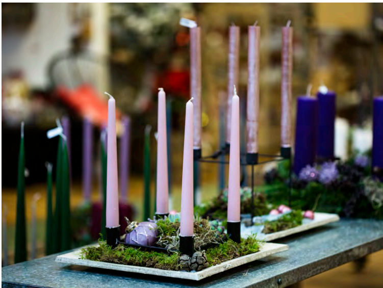
Nú er mest í tisku að hafa aðventukransinn náttúrulegan.