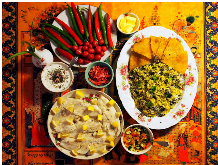
Hvítur fiskur með hrísgrjónum og úrvali jurta er dæmigerður írönsk-armenskur jólaréttur. Uppskrifin er einföld og ættu flestir að ráða við hana.