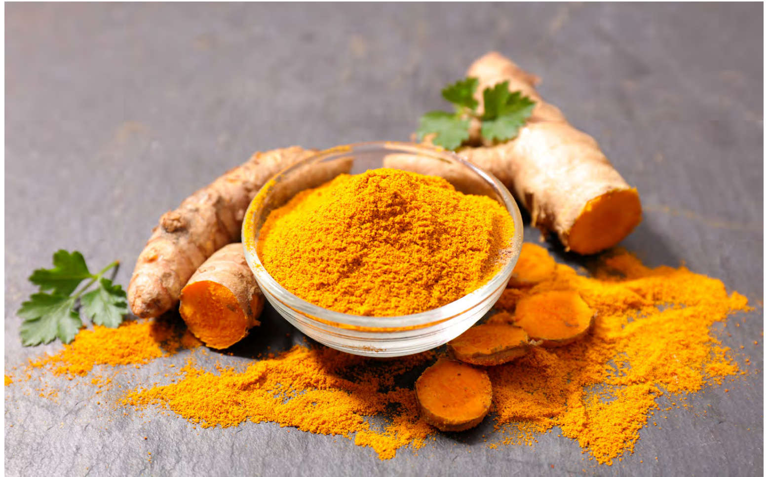
Það þykir sannað að túrmerik er frábært til að vinna gegn bólgum

Hámarks- upptaka ef sprautað er út í kinn