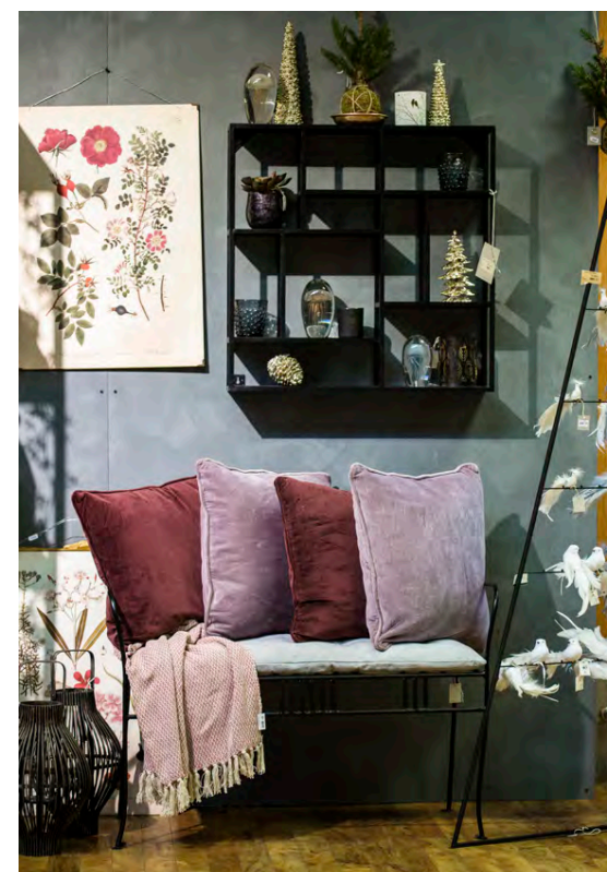
Það er margt fallegt í Garðheimum núna fyrir jólin, alls kyns fallegt í jólapakkann.