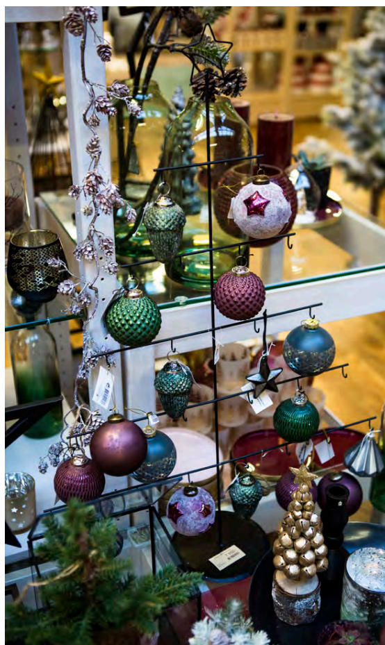
Jólaútlur í nýjstu litunum.