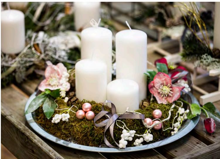
Mikið úrval er til af tilbúnum aðventuskreytingum.