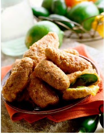
Æðislegur réttur fyrir þá sem vilja sterkan mat.