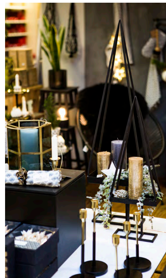
Margt fallegt fyrir heimilið.