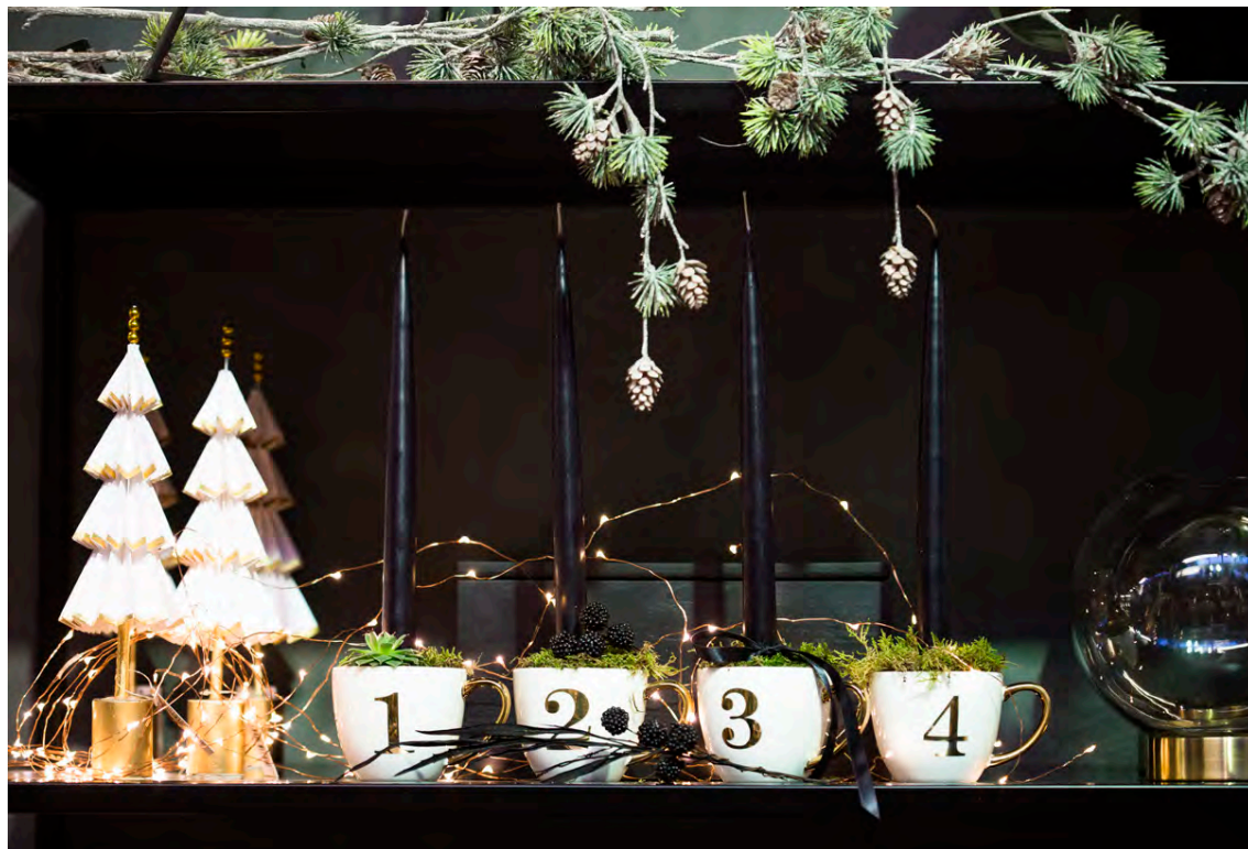
Aðventan byrjar á morgun. Það er hægt að fá allt til aðventuskreytinga í Garðheimum.

Þeir sem vilja fylgjast með viðburðum og öðrum uppakomum í Garðheimum geta fylgst með á Facebook-síðu fyrirtækisins.