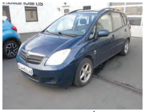
TOYOTA Corolla verso. Árgærd 2004, ekinn 157 þ.KM, bensín, 5 girar. Verð 490.000. Rnr.289334.