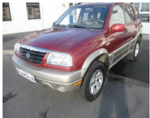
SUZUKI Grand vitara. Árgærd 2004, ekinn 203 þ.KM, bensín, sjálfskiptur. Dráttarkrökur. Verð 490.000. Rnr.152033.