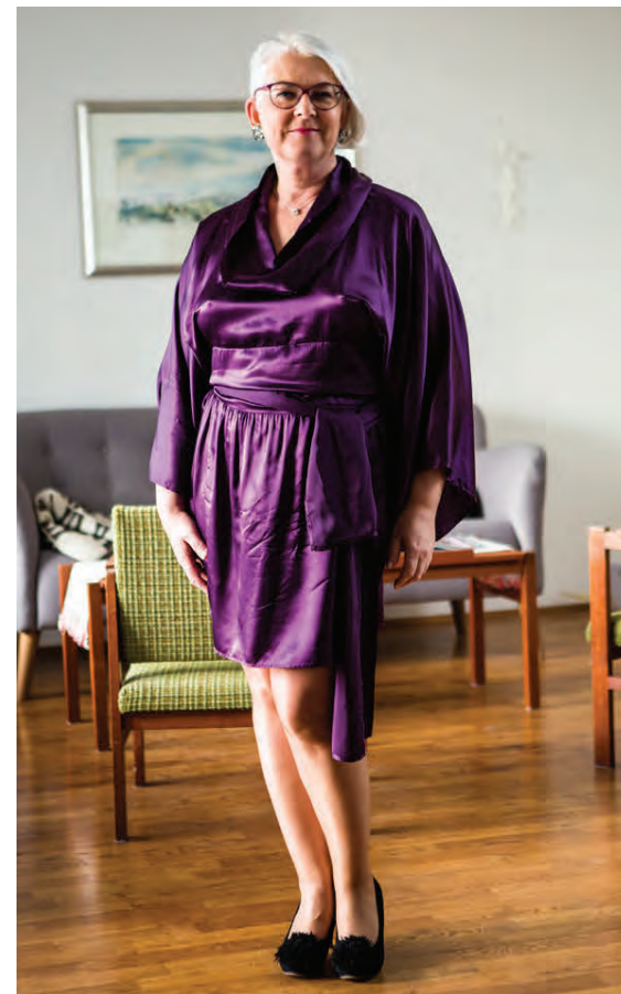
„Með bestu kaupum sem ég hef gert er fjólublár silkikjöll frá GuST sem ég er búin að nota mörg jöl í röð.“