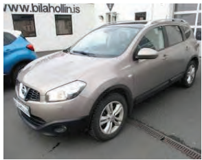
NISSAN Qashqai+2. Árgærd 2011, ekinn 98 þ.KM, bensín, sjálfskiptur. Verð 1.990.000. Rnr.152053.