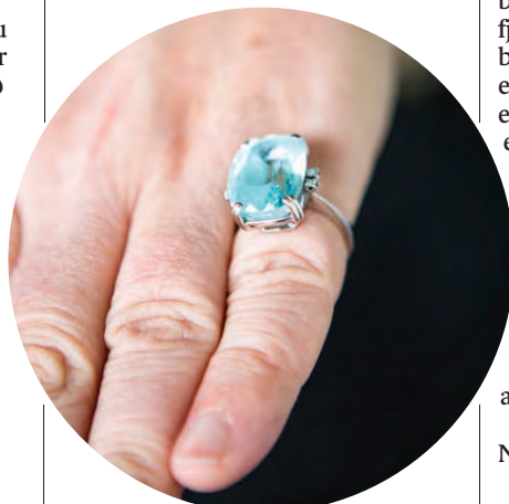
„Ég er mjög hrifin af kokteilhring frá ömmu minni þótt ég hafi fá tækifæri til að bera hann.“

Áttu þér uppáhaldsfataverslun? Flóamarkað Konukots.