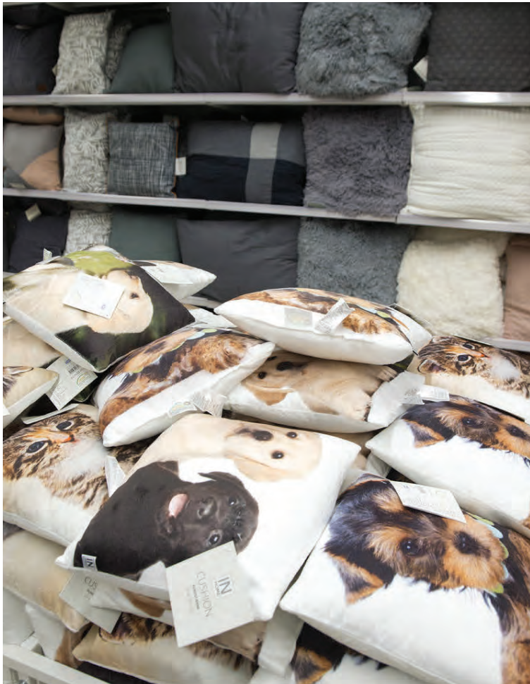
Gott úrval af púðum í ólíkum litum og með skemmtilegum myndum.