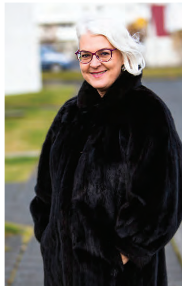
Pelsinn erfði Ester eftir ömmu sína. „Þegar ég fékk pelsinn voru sápu- stykki í vösunum á honum til að halda frá möl.“

Hvar kaupir þú helst fötin þín? Á flóamörkuðum og í búðum sem selja notuð föt. Mest spennandi eru finni „second hand“ búðir erlendis.