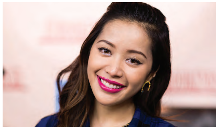
Michelle Phan var frumkvöðull í fegurðarbloggi á YouTube.