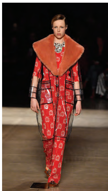
Miu Miu er frumleg þegar kemur að tiskunni.