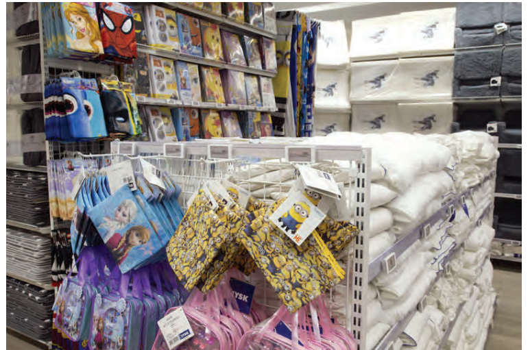
Fallegir gjafapokar eiga við um stór og smá tilefni.