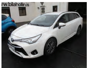
TOYOTA Avensis wagon active. Árgærd 2015, ekinn 92 þ.KM, bensín, sjálfskiptur. Verð 2.890.000. Rnr.152055.

Bílahöllin Bíldshöfða 5, 112 Rvk Sími: 567 4949 www.bilahollin.is