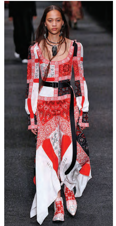
Glæsilegur síðkjóll frá Alexander McQueen.