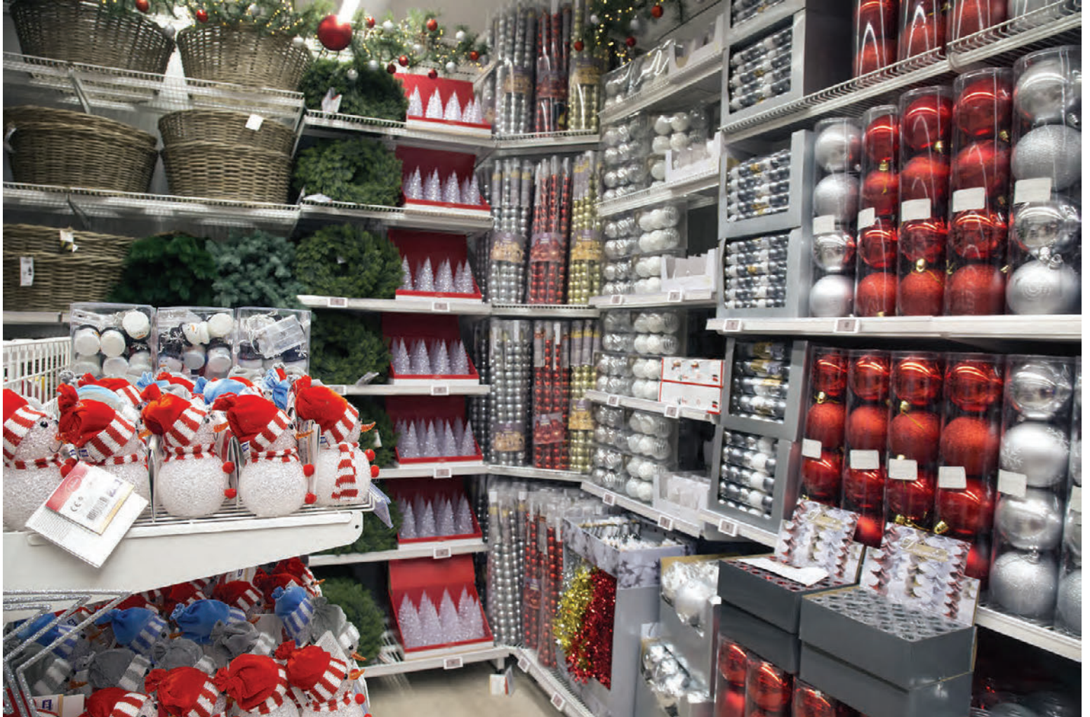
Verslanir Rúmfatalagersins eru fullar af glænýju og spennandi jólasakrauti fyrir fólk á öllum aldri.

Verslunin að Bildshöfða verður opnuð kl. 9 á laugardagsmorgun og biður Ívar gesti um að mæta tímanlega. „Þetta verður sannkallað risaparti. Ég mun klippa á borðann kl. 9 og segja nokkur orð. Svo bjóðum við gestum inn til okkar þar sem m.a. verður boðið upp á léttar veitingar og skemmtilega leiki. Við ætlum t.d. að vera með leik á Instag-ram-síðunni okkar þar sem hægt er að vinna rúm. Auk þess fá fyrstu 150 gestirnir sérstakan gjafapoka en fimmtán gjafapokar innihalda auka 30.000 kr. gjafabréf.“