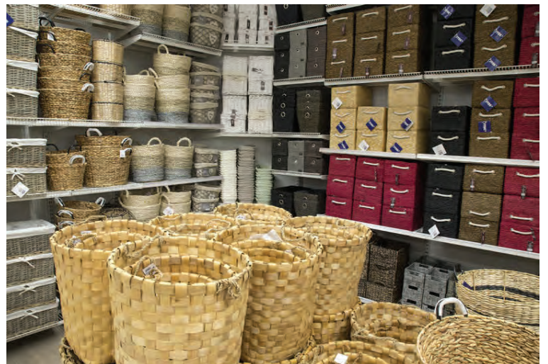
Fallegar kórður og kassar sem henta við ýmis ólík tilefni.