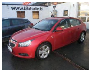
CHEVROLET Cruze Itz lux. Árgærd 2012, ekinn 59 þ.KM, bensín, sjálfskiptur. Verð 1.790.000. Rnr.288572.