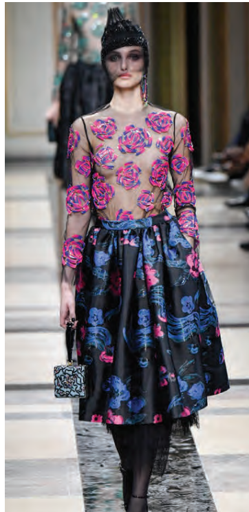
Svolítið magnaður kjóll frá Giorgio Armani.