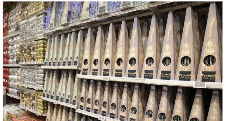
Það verður enginn svikinn af úrvalinu af jólavörum í Rúmfatalagerinum.