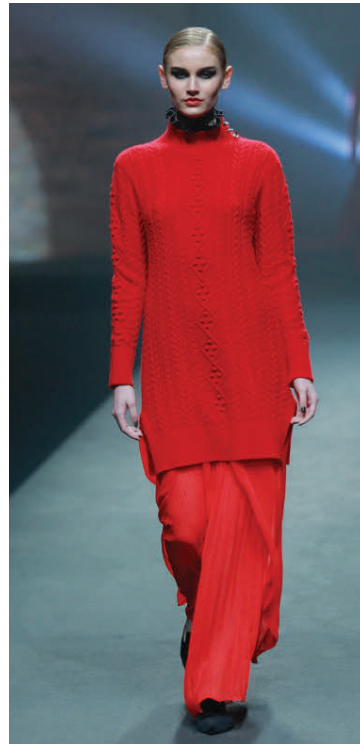
Síð rauð peysa við víðar buxur í jóla- legum litum. Þetta dress var sýnt á tiskuviku í Peking.