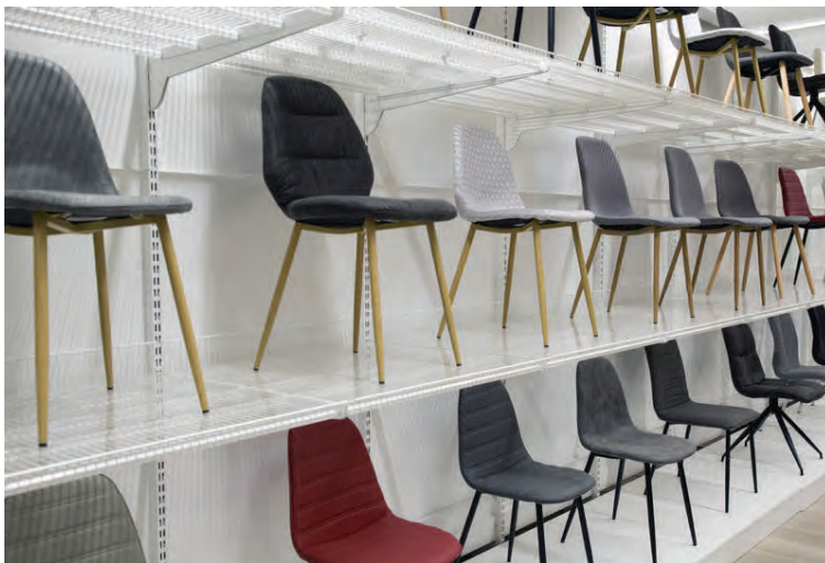
Mikið úrval fallegra stóla í ýmsum ólíkum litum.