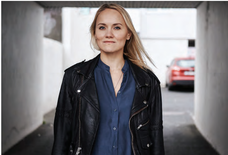
Bláa skyrtan gengur við hvað sem er.

Hvað er málið í haust og vetur? Haustin eru uppáhaldstímminn minn því þá fer maður í öll kósi fötin og hlýju yfirhafnirnar. Ég er mjög einföld þegar það kemur að fötum. Þegar ég fíla eitthvað þá væri ég mest til í að eiga það í