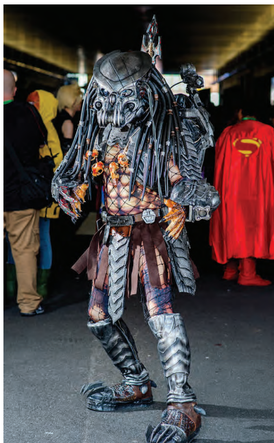
Predator safnaði hausjúpum.