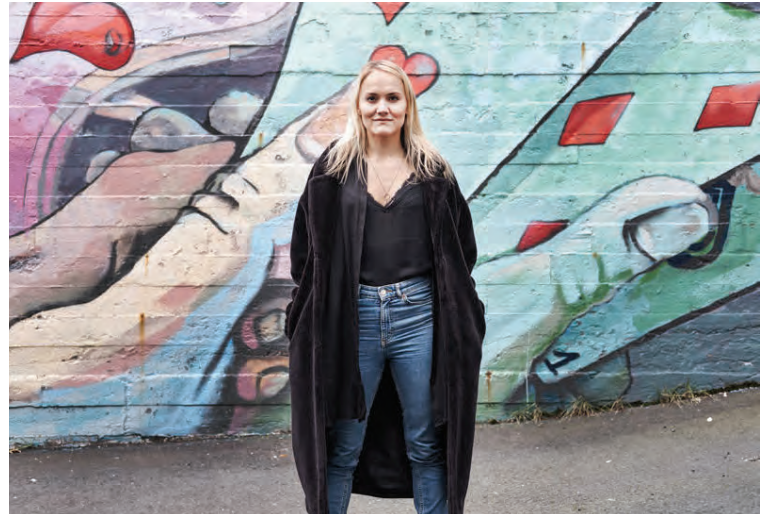
Haustið er í uppáhaldi hjá Unni því það kallar á stórar hlýjar peysur.

Hver er uppáhaldsflíkin þín? Vá! Erfið spurning. Ég held að ég verði að segja víða fallega bláa skyrtan mín, sem ég á í nokkrum litum, haha. Hún er uppáhalds því hún er víð, þægileg en samt hugguleg og ég er alveg fin í henni. Ég fékk hana í & Other Stories. Ég væri til í að kaupa lagerinn hjá þeim af skyrtum.