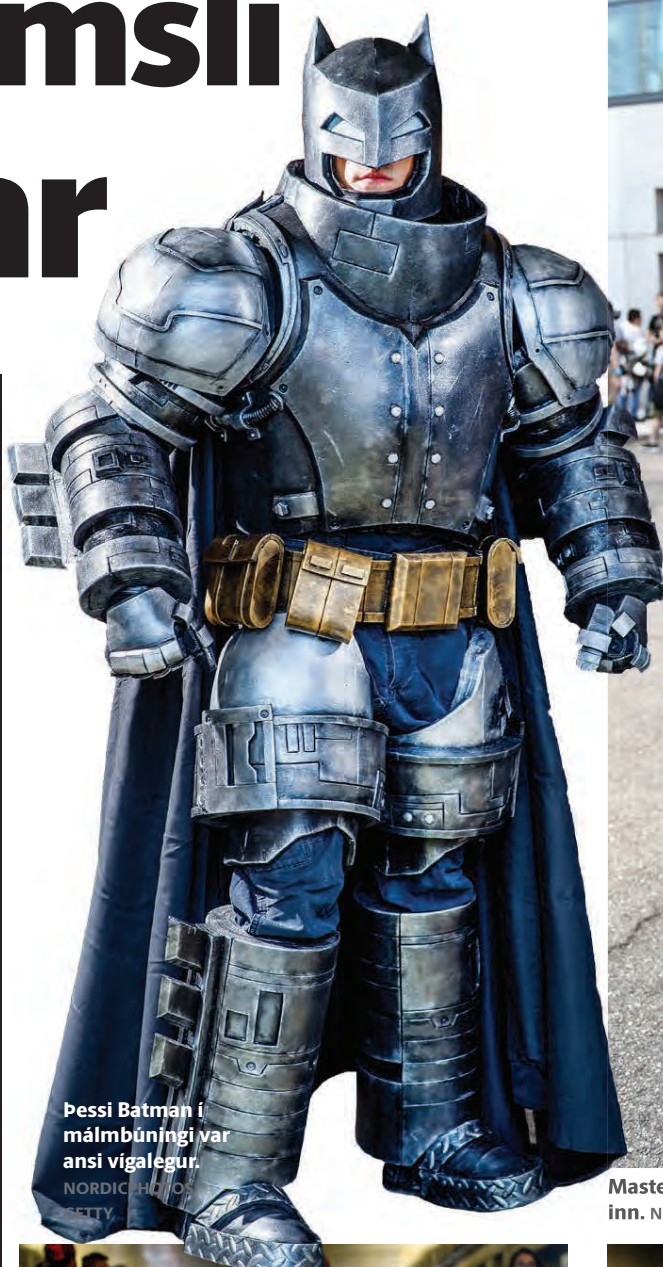
Þessi Batman í málbúningi var ansi vígalegur.

Fyrir vikið hefur metnaðurinn og gæðastadallinn á búningum aðdáenda rokið upp og á Comic-Con í dag eru ótrúlega glæsilegar ófreskjur, hetjur og þekktar sögupersónur á hverju strái. Hér er brot af því allra besta.