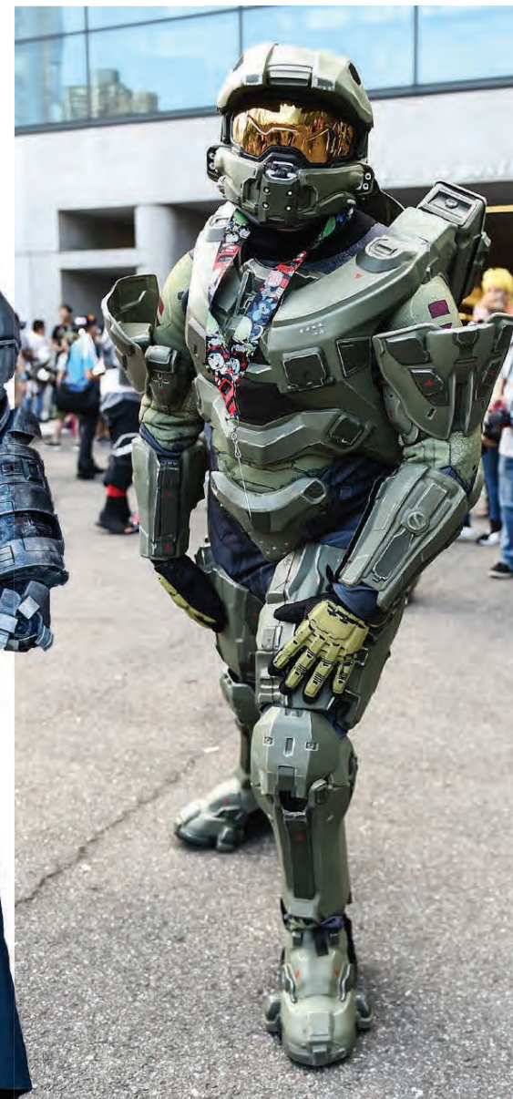
Master Chief var afvopnaður áður en honum var hleypt inn.