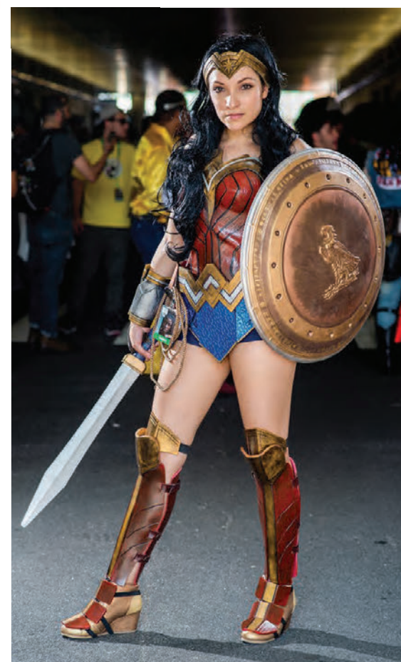
Wonderwoman hélt friðinn.