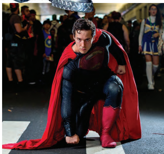
Superman lét ekki vaða yfir sig.