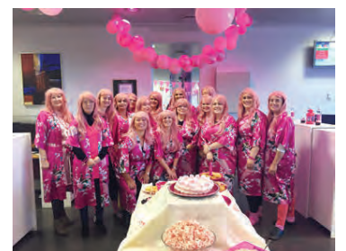
Starfsfólk Eimskips gerði sér glaðan dag á bleika daginn í fyrra.

Á vef Bleiku slaufunnar segir að bleiki mánuðurinn sé kjörinn fyrir fyrirtæki sem vilja fá jákvæða athygli og láta gott af sér leiða. Samkvæmt könnun sem Maskína gerði fyrir Krabbameinsfélagið vorði