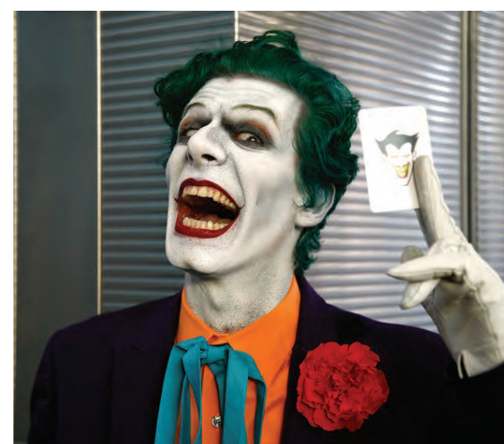
Það lá vel á Jókernum.

Ábendingahnappinn má finna á www.barnaheill.is