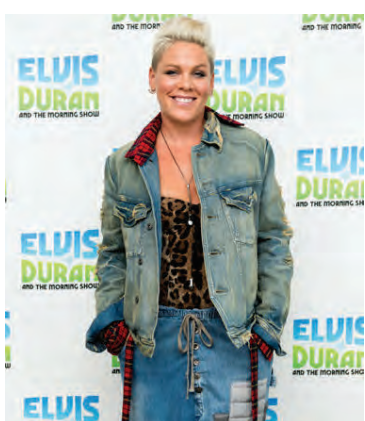
Söngkonan Pink skartaði þessum fina jakka í síðustu viku.

Debra hefur undanfarið leikið á Broadway en það hafði líka verið gamall draumur hennar. Hún ólst upp á Rhode Island og þegar hún kom til New York horfði hún á leikhúshverfið með aðdáun. Nýlega var gerð ný þáttaröð um Will & Grace með sömu leikurum. Hollywood-stjarna Debra er númer 2620 á götunni.