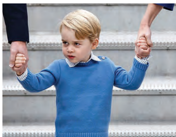
Fatastill Georgs prins hefur slegið í gegn.

Móðir hans er sjálf mikil tiskufyrirmynd og á greinilega ekki í vandræðum með að finna smekk-