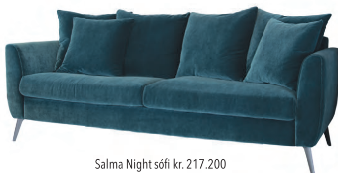
Salma Night sófi kr. 217.200