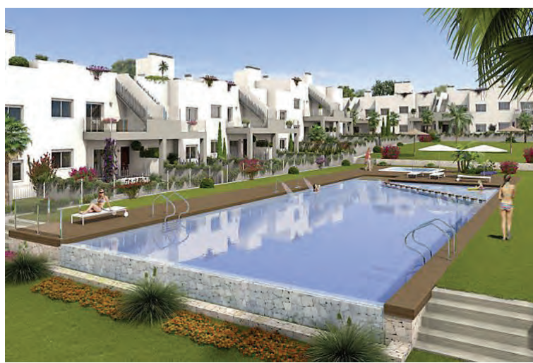
Verð á nýjum íbúðum í Torrevieja er frá 149.900 evrum.