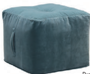
Praline pulla kr. 22.400