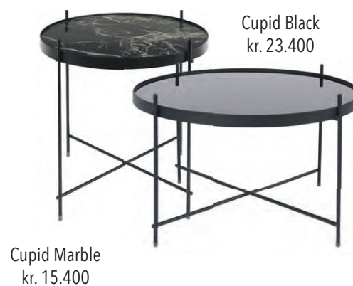
Cupid Marble kr. 15.400