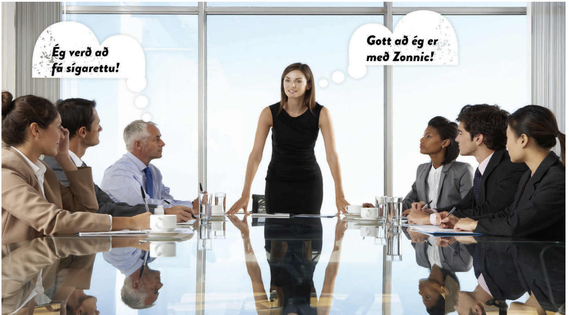
Þegar fólk vill ekki, getur ekki eða má ekki reykja, t.d. á fundum, í flugvélum, á veitingarhúsum, getur Zonnic mint skammtapokinn hentað vel