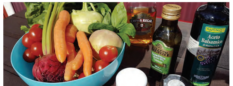
Úrval af góðu rötargrænmeti er notað í réttinn.

Hrefna á rótarbeði er sérlega fallegur og góður réttur.