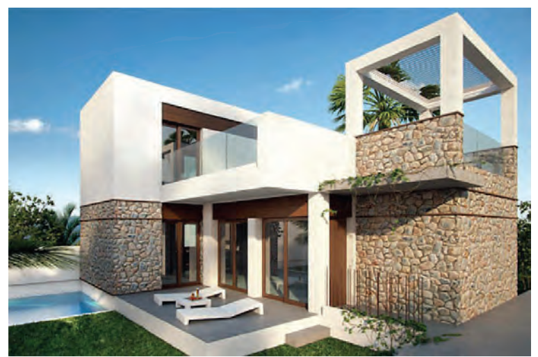
Verð á einbýlishúsi í Torrevieja er frá 230.000 evrum.

MASA International er ein fárra spænskra fasteignasala sem fengið hafa ISO 9001-staðal, en hann hann er eingöngu veittur fyrirtækjum sem veita framúrskarandi þjónustu og geta mætt þörfum viðskiptavina í hvívetna. „Það er þrautin þyngri að