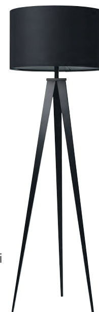
Tripod góflamp kr. 33.200