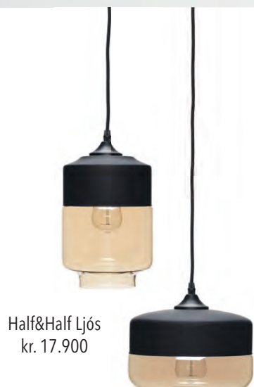
Half&Half Ljós kr. 17.900