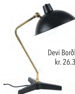
Devi Borðlampi kr. 26.300