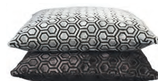
Dean Púðar kr. 6.700