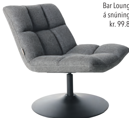
Bar Lounge tóll á snúningsfæti kr. 99.800