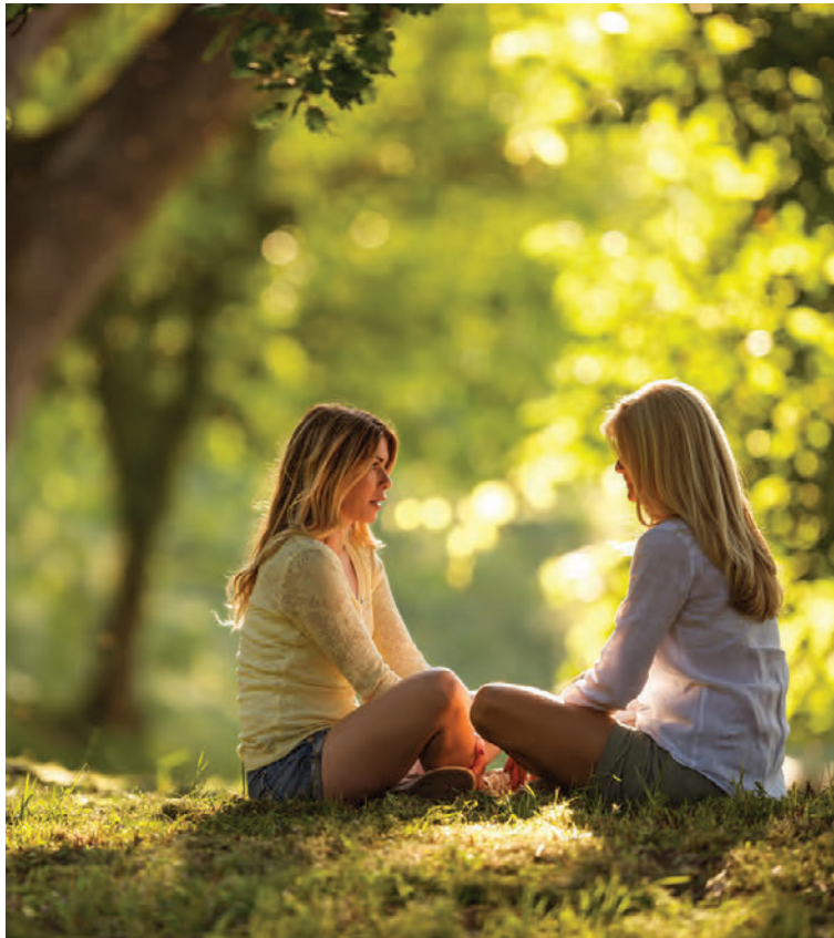
Á lífstöltinu er dýrmætt að eiga góðan vin sem kann og vill hlusta.