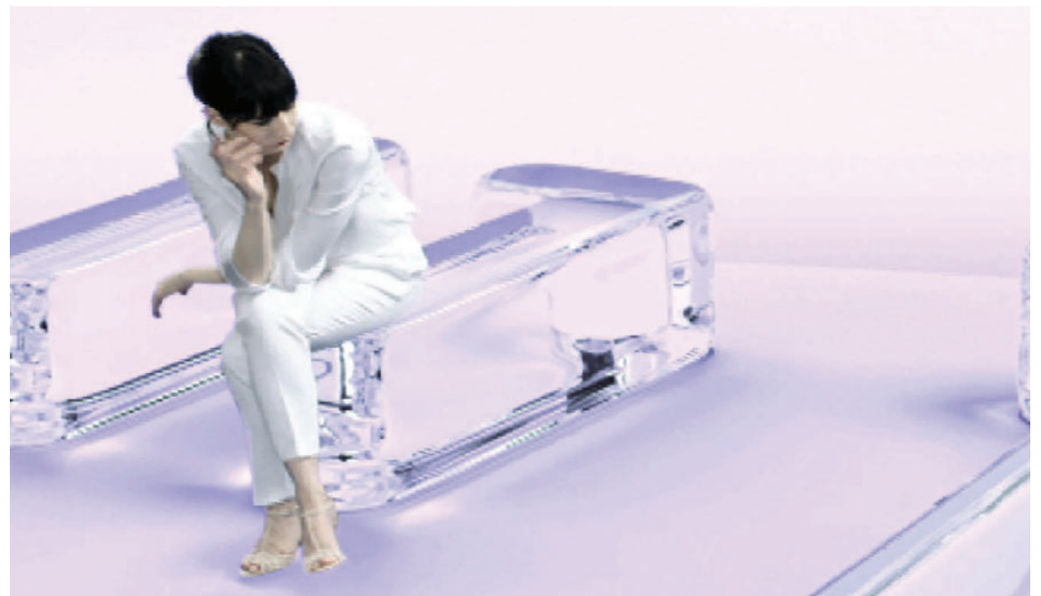
Talið er að um 10-20% almennings þjáist af hægðatregðu og allt að 40% þungaðra kvenna. Ástæður hægðatregðu geta verið mjög margar, eins og t.d. léleg næring, lítið af vökva, óhollur matur, aukaverkanir af lyfjum, veikindi eða stress.