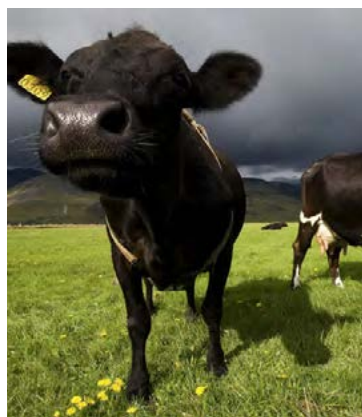
Kýr eru flóknar verur og dugar ekkert minna en háskólagráða til að eiga við þær.

í sálarlíf hesta en hið flókna og fallega samband milli manns og hests líka kannað. Hafi þig dreymt um að verða hestahvíslari er tækifærið komið!