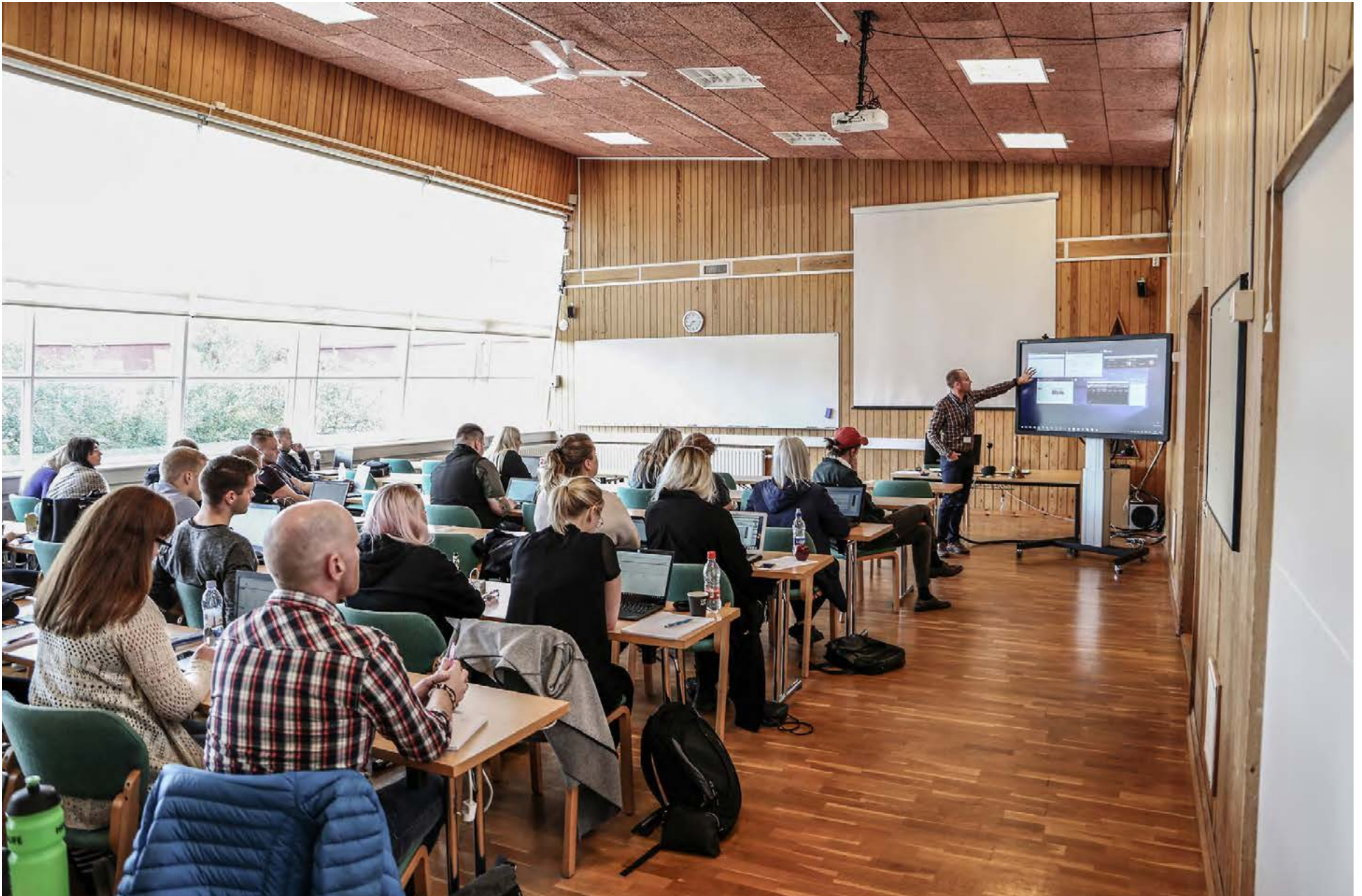
Kennsluáðferðir byggja á mikilli verkefnavinnu, bæði einstaklingsverkefnum og samvinnuverkefnum, og þjálfa nemendur til forystu í atvinnulífinu og samfélaginu.