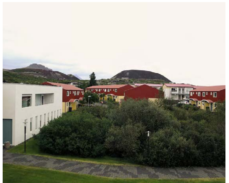
Öll aðstaða fyrir nemendur og fjölskyldur þeirra er til fyrirmyndar.