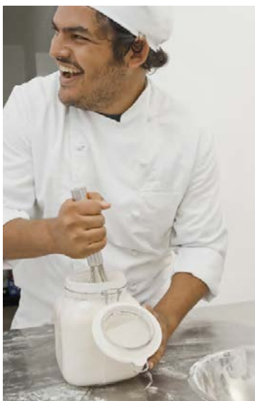
„Kökugærdarmaður tekur...“ próf í baktursvísindum við South Bank háskólann í London.

Háskólinn í Cambridge reð nýverið til sín prófessor til að sinna rannsóknnum á sambandi leiks og þroska barna en það er alþjóðlega Legó-stofnunin sem fjármagnar stöðuna sem heitir þess vegna Legóprófessor.