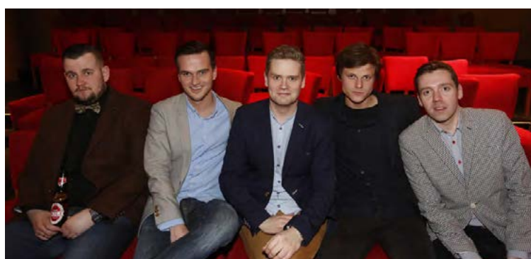
Félagarnir í Mið-Íslandi þurfa sjálfsgagt ekki mikið á MA-gráðu í uppistandi að halda en gætu mögulega sótt um kennslustöður.