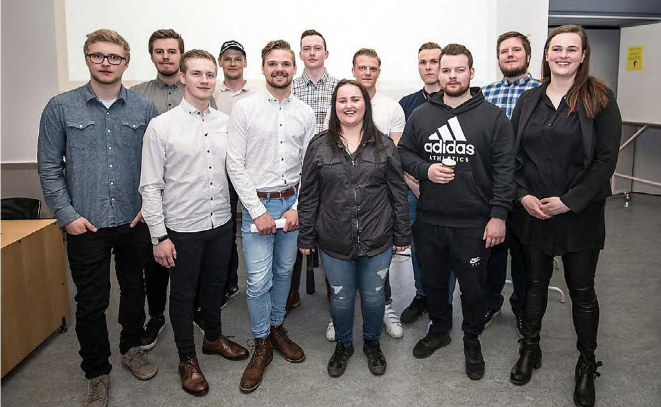
Útskriftarhópur Írisar að loknum vel heppnuðum kynningum á útskriftarverkefnum í vélstjórn við VMA.