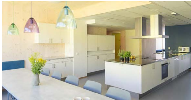
Góð sameiginleg aðstaða verður hjá nemendum.

Í nýju íbúðunum sem teknar verða í notkun næsta haust hittist fólkið reglulega og getur rappað saman. Vonast er til að þetta nýja fyrirkomulag geti orðið til þess að vinátta myndist á milli nemanda. Þá gætu þeir einnig lært saman í opna rýminu, stofnað hóp á Facebook þar sem hægt væri að deila upplýsingum eða bara sitja saman og spjalla.