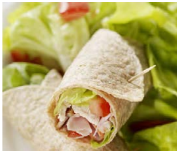
Einfalt og hollt nesti fyrir skólann.