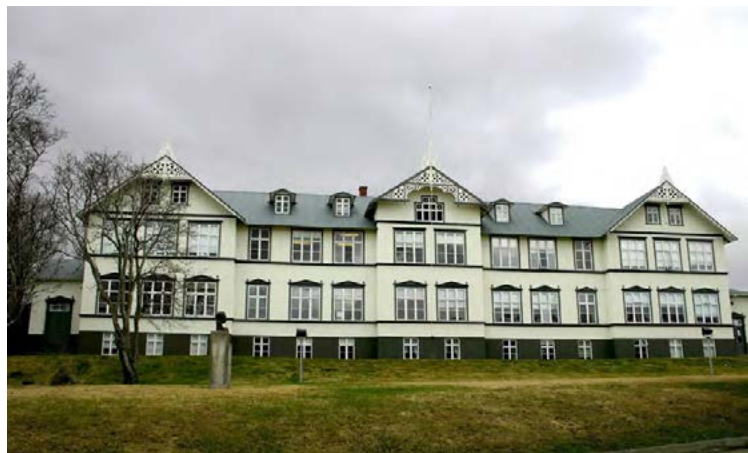
Menntaskólinn á Akureyri.

Yngstir á hátíðinni eru eins árs stúdentar sem kasta af sér hvíta kollinum á miðnætti en þeir elstu sem hafa boðað komu sína þetta árið eru 60 ára stúdentar.