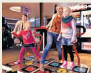
Öll fjölskyldan skemmtir sér saman.