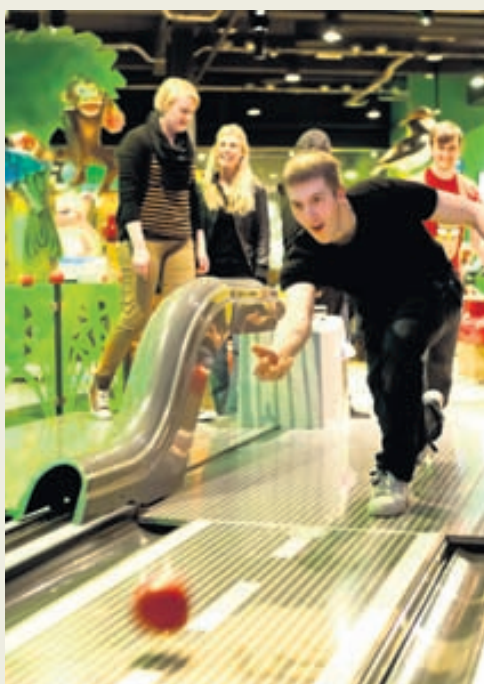
Keilan klikkar ekki.