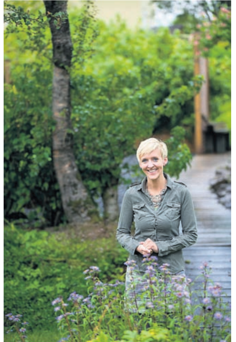
Gunnhildur segir vinnuvistfræði afar víðfeðmt svið en að orðið sé óþjálgt og sumir átti sig ekki á því hvað hugtakið þýðir.

Nánari upplýsingar um félagið er að finna á www.vinnis.is .