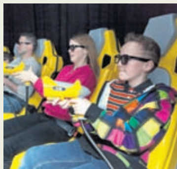
7D-bíósalurinn er alltaf vinsæll.