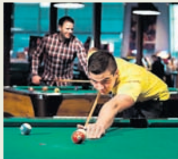
Einnig er hægt að skella sér í pool.