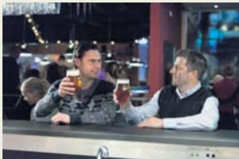
Á bar Skemmtigarðsins má gera sér glaðan dag og jafnvel syngja í karókí.