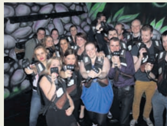
Ánægður hópur í lasertag.