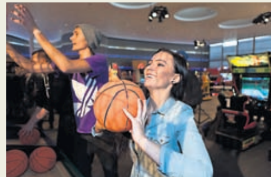
Leiktækin eru margvísleg.